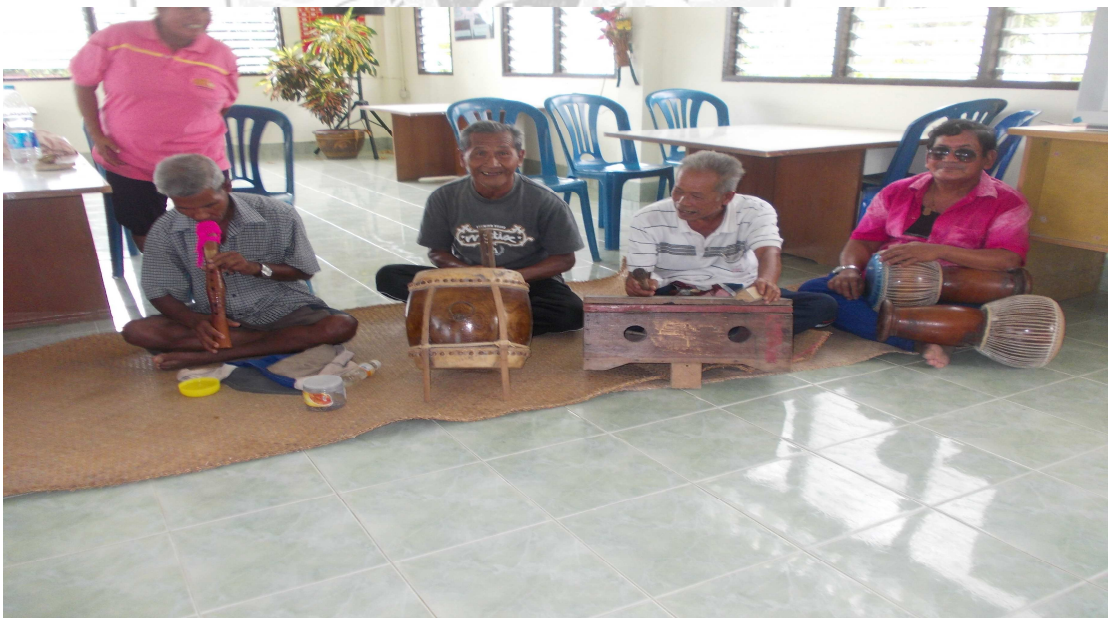
ภาพที่ 2 คณะลูกคู่โนรา