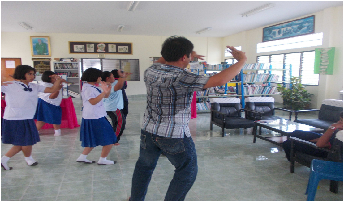
ภาพที่ 5 รำทำสอดสอยมาลา