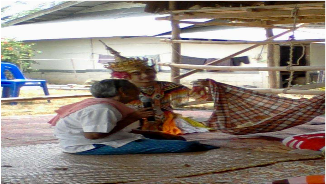
ภาพที่ 11 เกิดข่าวเกิดของ