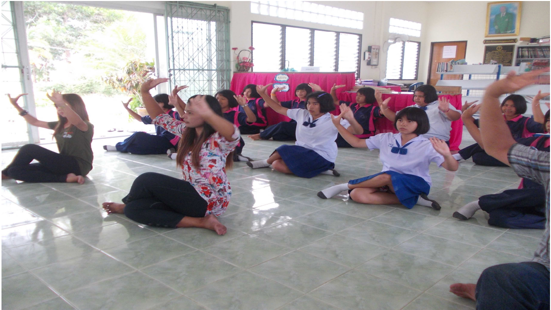
ภาพที่ 7 รำท่าเขาควาง