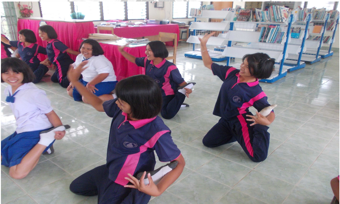
ภาพที่ 4 นักเรียนฝึกในการรำโนรา