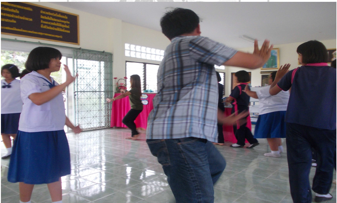
ภาพที่ 6 รำทำเดินวง