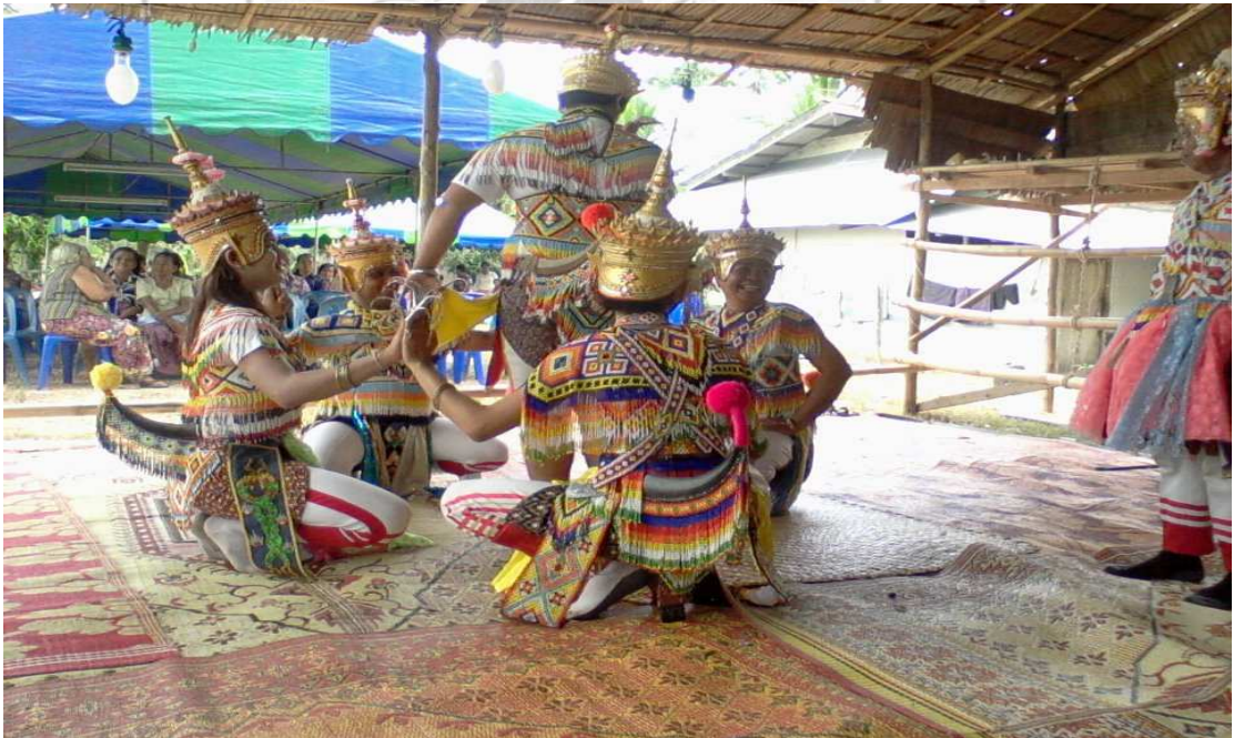
ภาพที่ 10 รำท่านกแขกเต้า