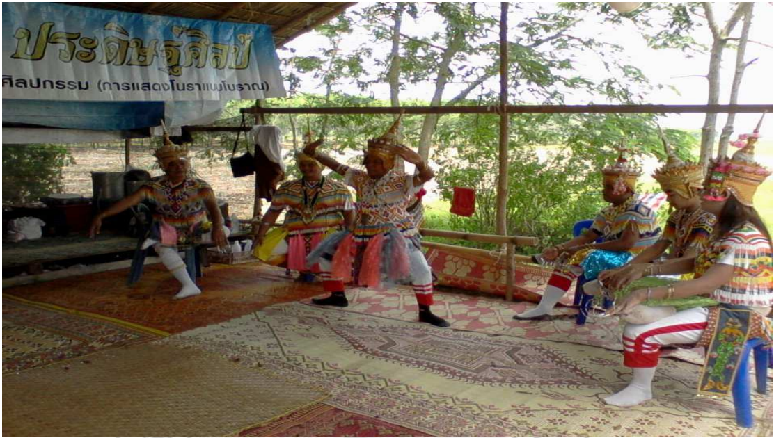
ภาพที่ 9 รำ 12 บท