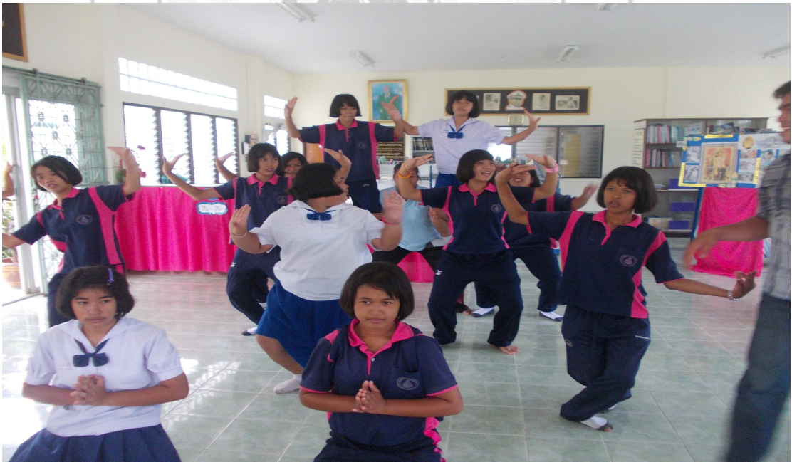
ภาพที่ 8 รำท่าพระจันทร์ทรงกรด