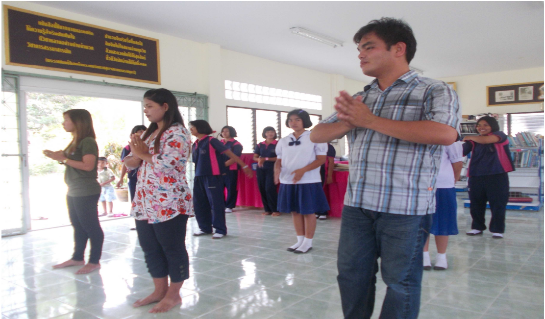
ภาพที่ 3 ครูให้คำแนะนำนักเรียนในการรำโนรา