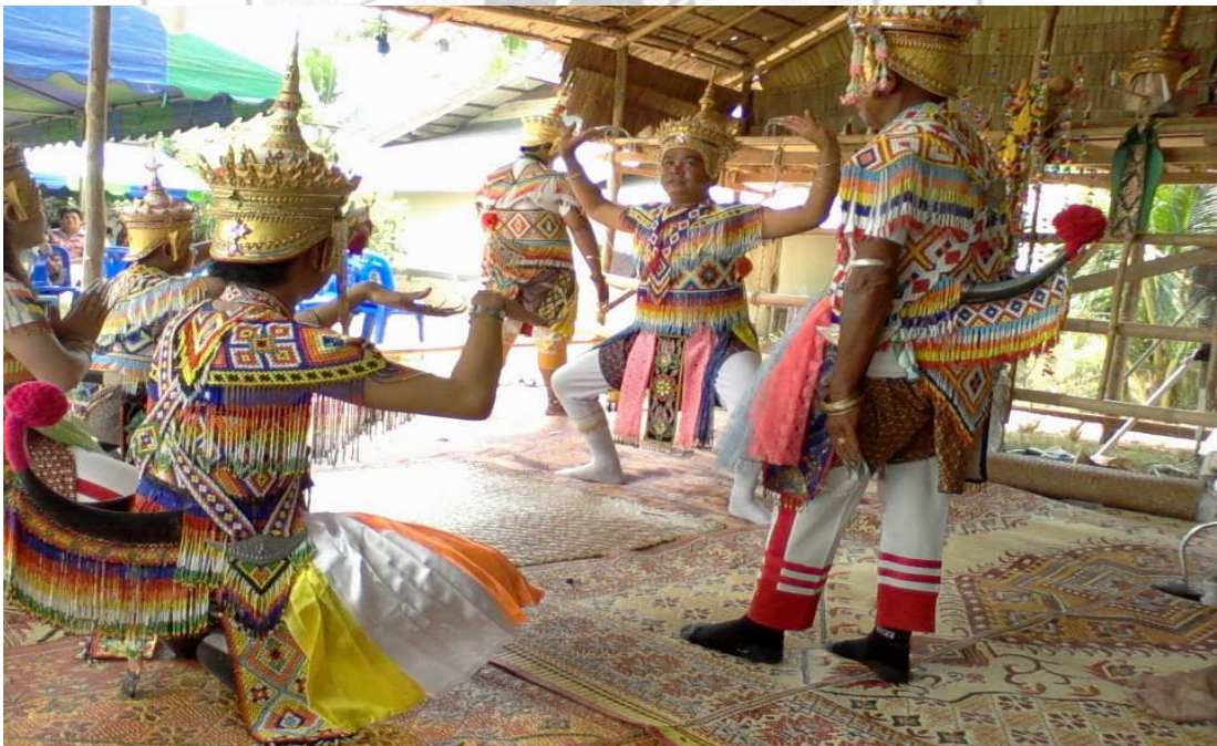
ภาพที่ 12 รำทำกระต่ายชมจันทร์