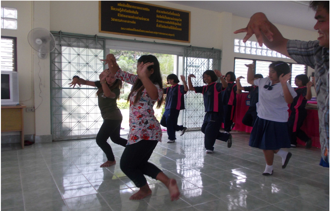
ภาพที่ 1 การเข้าร่วมกิจกรรมเสริมหลักสูตร