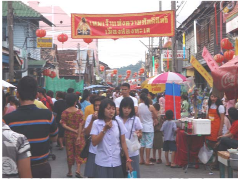
37. จุดเสี่ยงบริเวณงานปิดถนนคนเดินเท้า (ถนนนครนอก) อำเภอเมือง จังหวัดสงขลา