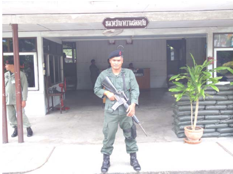
7. เจ้าหน้าที่ตำรวจ หมวดรักษาความปลอดภัย กก.ตชด.43 กำลังปฏิบัติหน้าที่