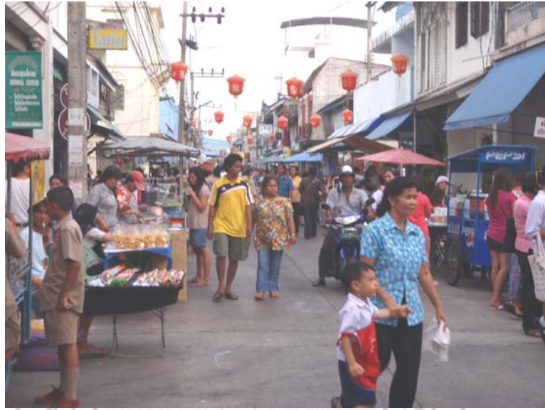
35. จุดเสี้ยว คนพลุกพล่านบริเวณงานที่ทางเทศบาลนครสงขลาจัดขึ้น