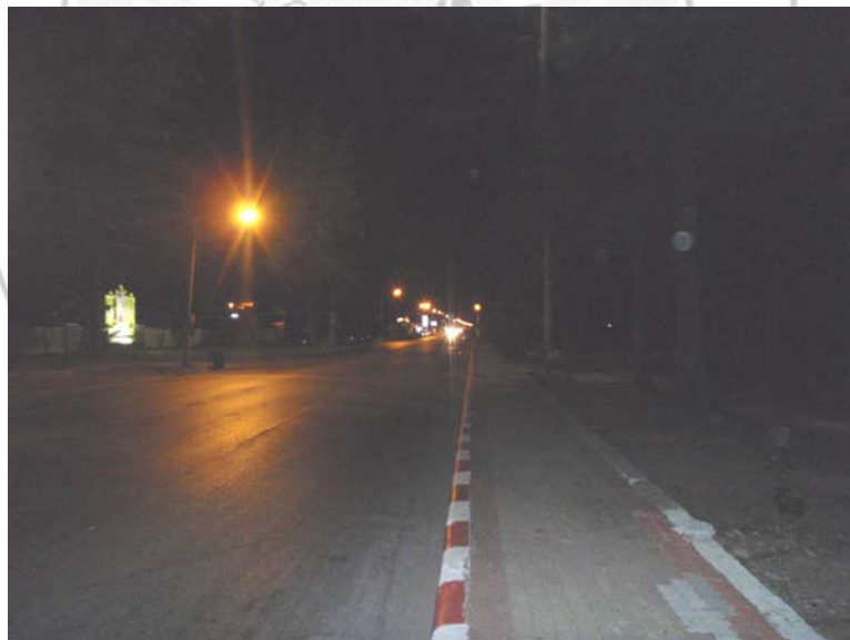
30. บรรยากาศตอนค่ำริมหาดสมิหลา ซึ่งเหมาะแก่การก่อวินาศกรรมของฝ่ายตรงข้าม 3 จังหวัดชายแดนภาคใต้เป็นอย่างยิ่ง เนื่องจากไม่มีสายตรวจเจ้าหน้าที่ตำรวจกำกับดูแลได้อย่างทั่วถึง