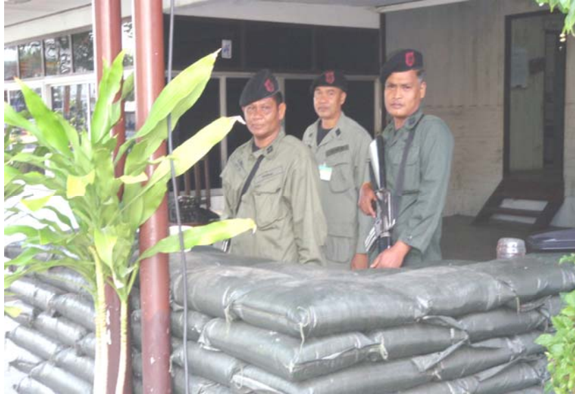
9. การเข้าเวร-ป้อมยาม เพื่อรักษาความปลอดภัยให้กับพี่น้องประชาชน