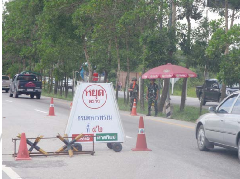
25. ป้อมจุดตรวจของเจ้าหน้าที่ทหารพราน กรมทหารพรานที่ 42