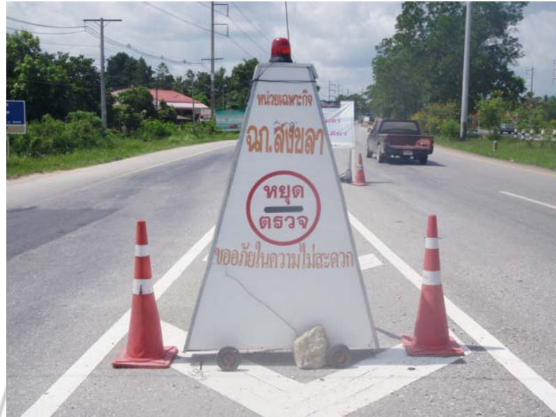
11. การป้องกันภัยโดยการตั้งจุดตรวจแบบ 24 ชั่วโมง ของหน่วยเฉพาะกิจสงขลา