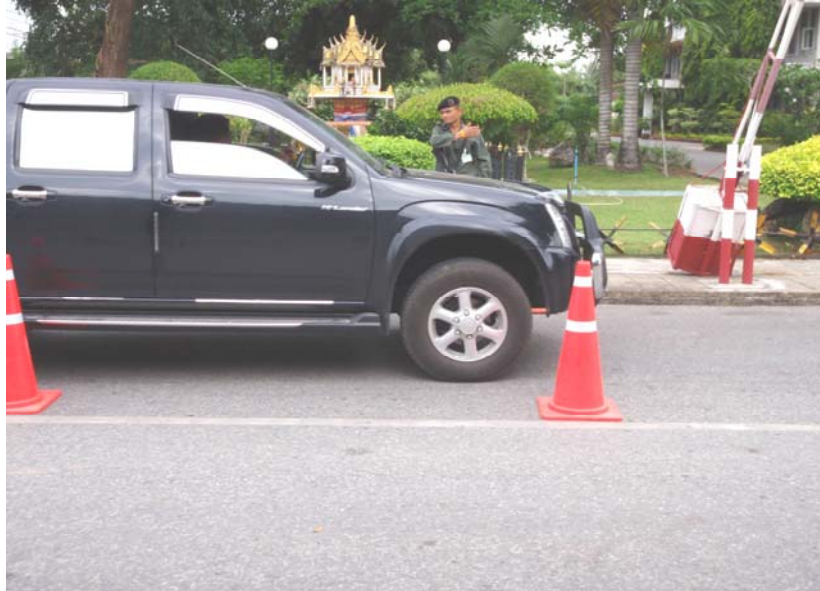
5. เจ้าหน้าที่กำลังตรวจตรารถยนต์เข้า-ออก สถานที่ราชการ