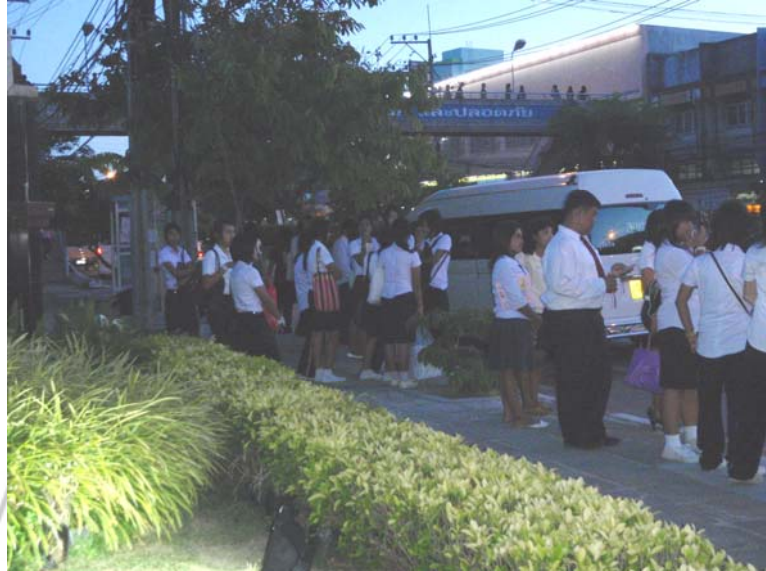
45. จุดเสี่ยง ตอนใกล้ค่ำบริเวณหน้ามหาวิทยาลัยราชภัฏสงขลา ซึ่งเต็มไปด้วยนักศึกษาที่กำลังขึ้นรถประจำทางเพื่อต้องการกลับบ้าน