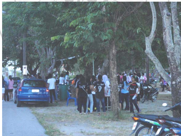
42. จุดเสียดงบริเวณสนามกีฬานในสถาบันราชภัฏสงขลา (ตอนเชันๆ)