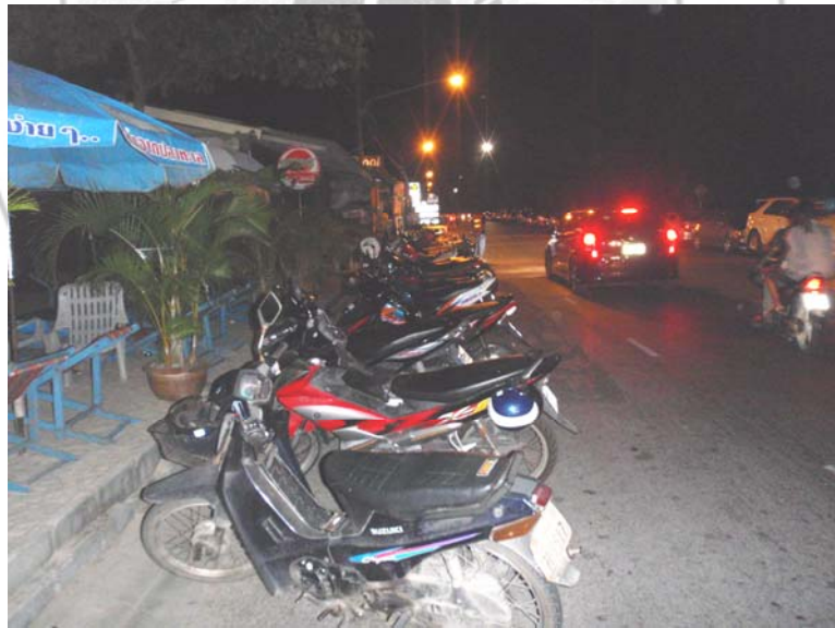
28. รถมอเตอร์ไซด์ของนักเที่ยวร้านอาหารบริเวณหาดสมิหลา อำเภอเมือง จังหวัดสงขลา