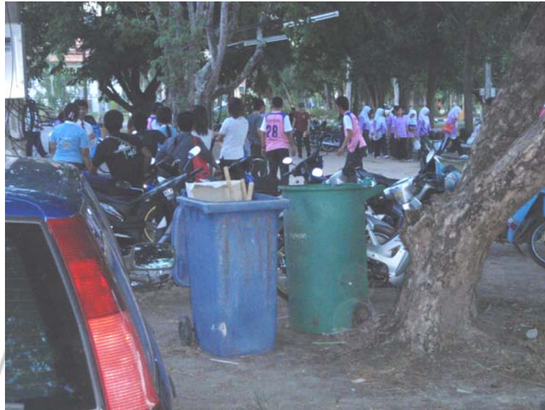
43. จุดเสี่ยง จากรถมอเตอร์ไซค์และถังขยะ บริเวณสนามกีฬาในสถาบันราชภัฏสงขลา