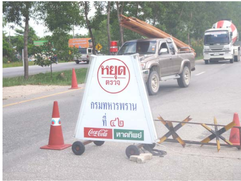
17. การป้องกันภัยโดยการตั้งจุดตรวจแบบ 24 ชั่วโมง ของหน่วยทหาร กรมทหารพรานที่ 24