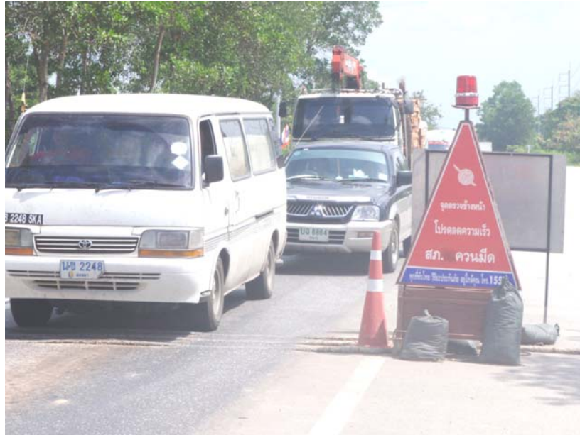
13. การป้องกันภัยโดยตั้งจุดตรวจแบบ 24 ชั่วโมง ของหน่วยเฉพาะกิจ สถานีตำรวจอำเภอควนมิ่ง