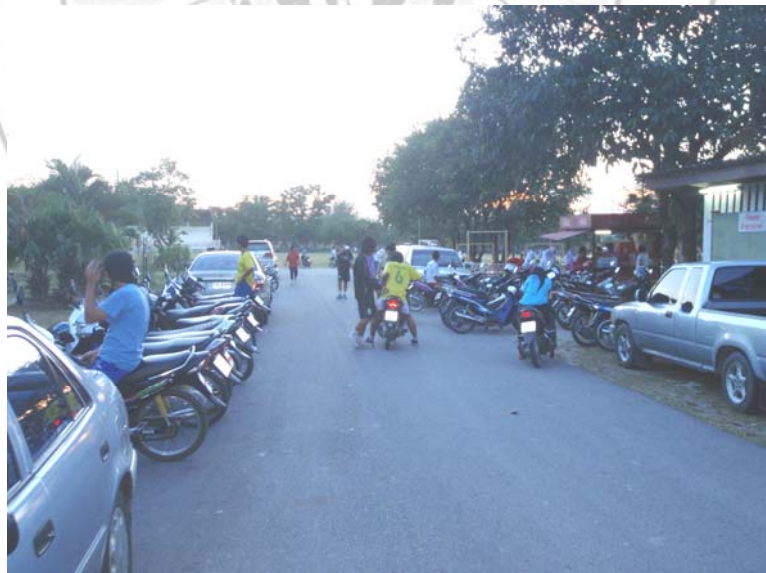
44. จุดเสี่ยงของประชาชนจากมอเตอร์ไซค์บริเวณสนามกีฬาภายในมหาวิทยาลัยราชภัฏสงขลา