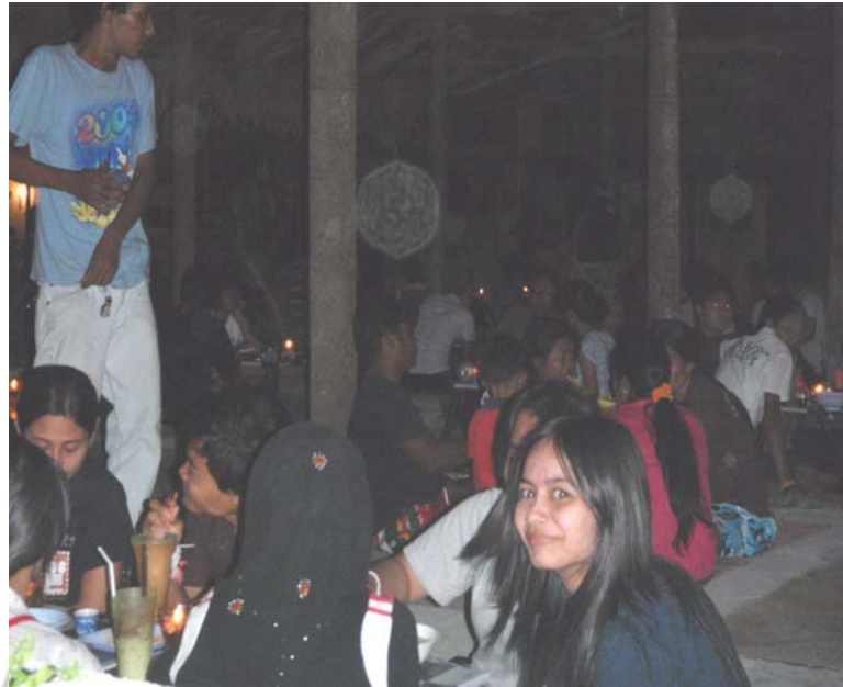
41. จุดเสียดง บรรยกาศตอนกลางคีนภายในร้านน้ำชา ซ่งแอดไปค้วยนักศีกษาและกลุ่มวัยรุ่น