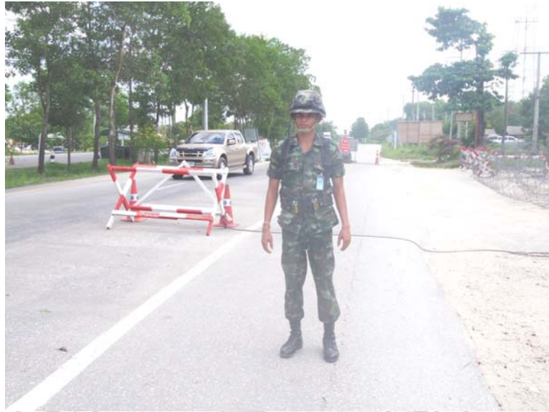
15. เจ้าหน้าที่ทหารกำลังปฏิบัติหน้าที่ ณ ป้อมจุดตรวจก่อนเข้าตัวเมืองสงขลา