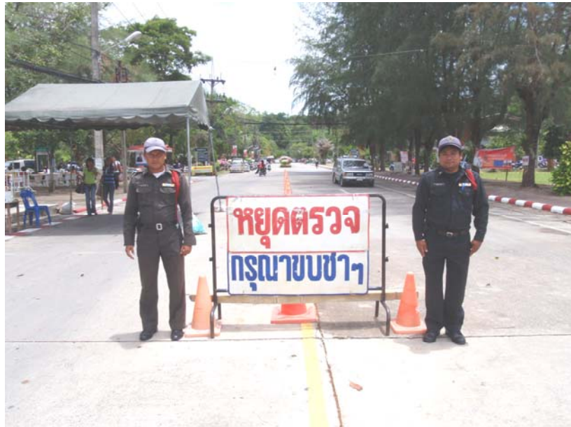
3. เจ้าหน้าที่รักษาความปลอดภัยคอยตรวจตรารถยนต์เข้าออกสถานที่ราชการ