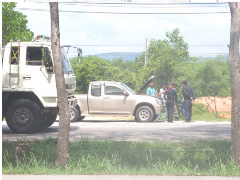
16. เจ้าหน้าที่ตำรวจกำลังตรวจค้นรถต้องสงสัย ขณะมุ่งหน้าเข้าตัวเมืองสงขลา