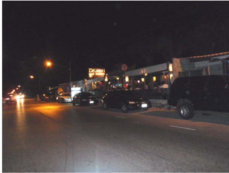
27. ร้านอาหาร Dr.cool ร้านที่เคยโดนวางระเบิดมาแล้ว จำนวน 2 ครั้ง