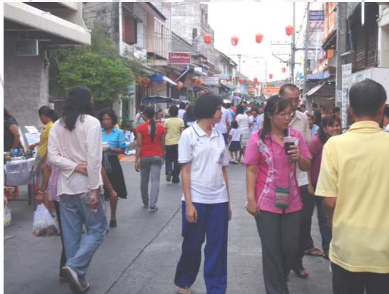
34. จุดเสี่ยง บริเวณถนนคนเดินเท้า (ปิดถนนจัดงาน)