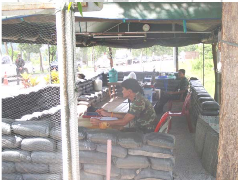
20. เจ้าหน้าที่ทหารพรานกำลังปฏิบัติหน้าที่ตั้งป้อมจุดตรวจรถยนต์ ก่อนมุ่งหน้าเข้า เขตพื้นที่อำเภอเมือง จังหวัดสงขลา