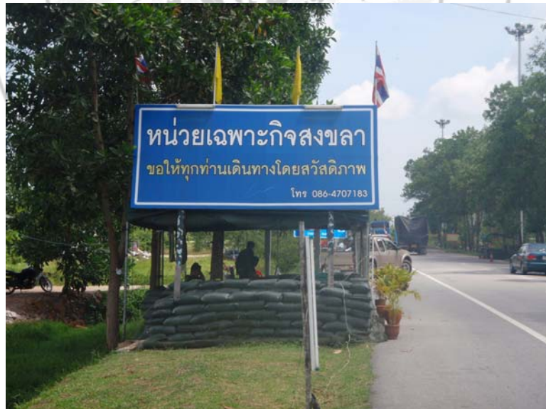
24. ป้อมจุดตรวจแบบ 24 ชั่วโมงของหน่วยเฉพาะกิจสงขลา