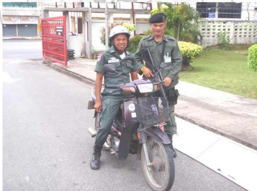
8. หยุดตรวจ...ก่อนเข้าสำนักงาน