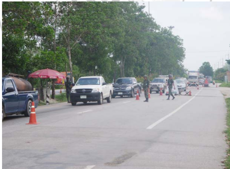
18. เจ้าหน้าที่ทหารกำลังปฏิบัติหน้าที่ตรวจตรารถยนต์ ขณะมุ่งหน้าเข้า เขตพื้นที่อำเภอเมือง จังหวัดสงขลา