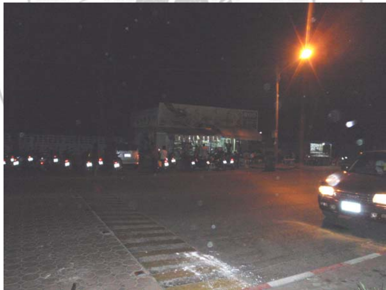
32. ร้านค้าที่เคยโดนวางระเบิด บริเวณลานดนตรี ริมหาดชลทัศน์ อำเภอเมือง จังหวัดสงขลา