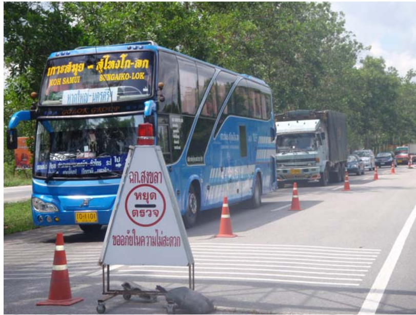
23. รถยนต์ที่ผ่านจุดตรวจเฉพาะกิจสงขลา ที่มุ่งหน้าเข้าเขตพื้นที่อำเภอเมือง จังหวัดสงขลา