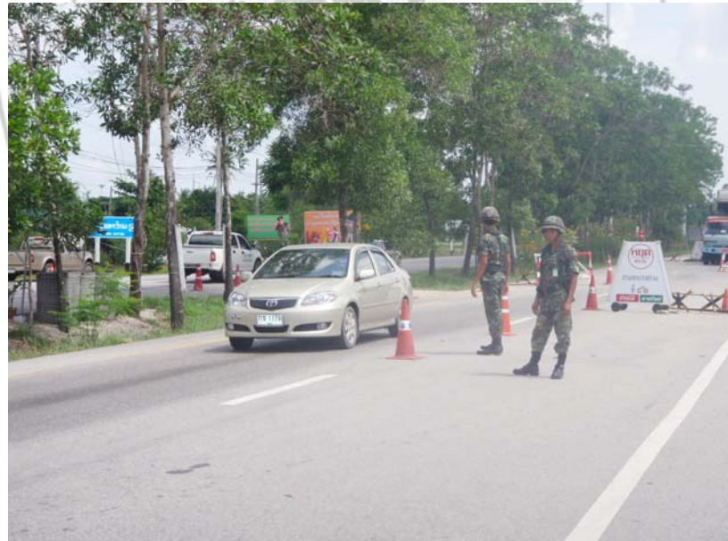
14. เจ้าหน้าที่ตำรวจ – ทหาร กำลังปฏิบัติหน้าที่