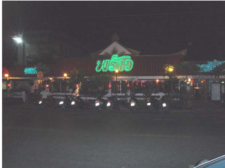
29. จุดเลี้ยง บริเวณร้านอาหาร “พร้าว” บรรยากาศตอนกลางคืนริมหาดสมิหลา สงขลา