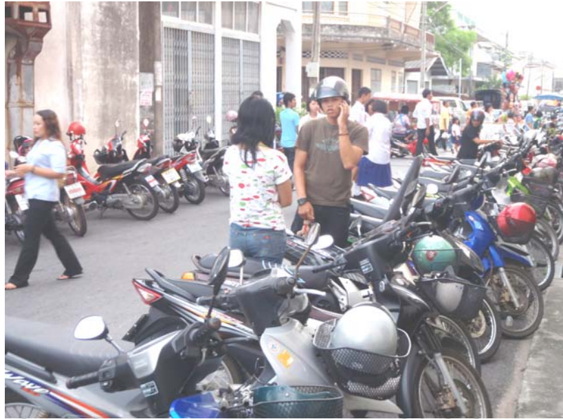
33. จุดเสี่ยงมอเตอร์ไซด์ที่จอดในงาน ปิดถนนให้คนเดินเท้า บริเวณถนนนางงาม นครนอก-นครใน เขตอำเภอเมือง จังหวัดสงขลา