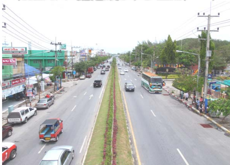
2. เส้นทางเดินรถที่เข้า – ออก เขตพื้นที่อำเภอเมือง จังหวัดสงขลา