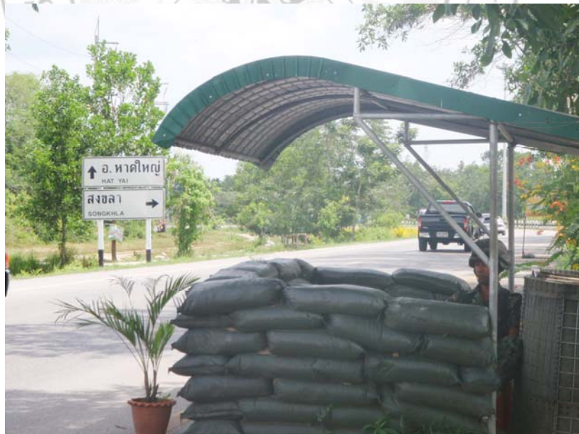
26. ป้อมจุดตรวจของทหารพรานก่อนมุ่งหน้าเข้าสู่เขตพื้นที่อำเภอเมือง จังหวัดสงขลา