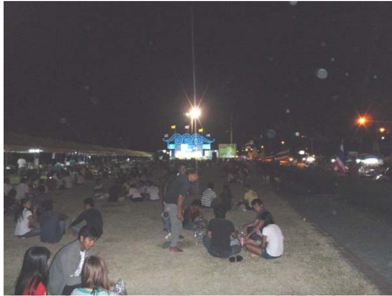
31. จุดชมดนตรี บริเวณลานดนตรี-ลานวัฒนธรรม ริมหาดชลทัศน์สงขลา