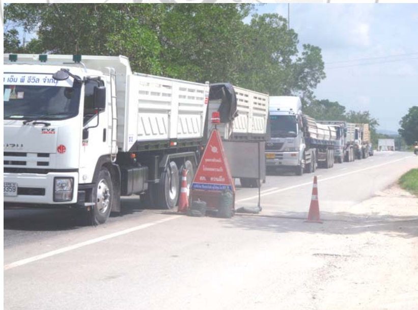
12. ปริมาณรถยนต์ที่ผ่านเส้นทางจุดตรวจ