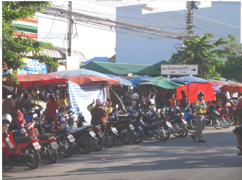
38. จุดเสี่ยงที่เหมาะสมแก่การก่อวินาศกรรม บริเวณตลาดนัดเชิงหน้ามหาวิทยาลัยราชภัฏสงขลา