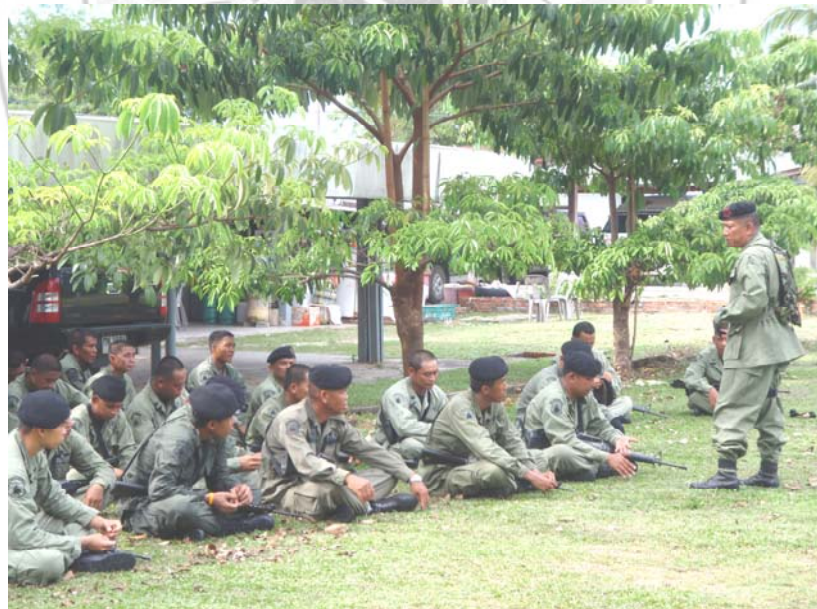
10. การฝึกอบรมตำรวจชุดรักษาความปลอดภัย