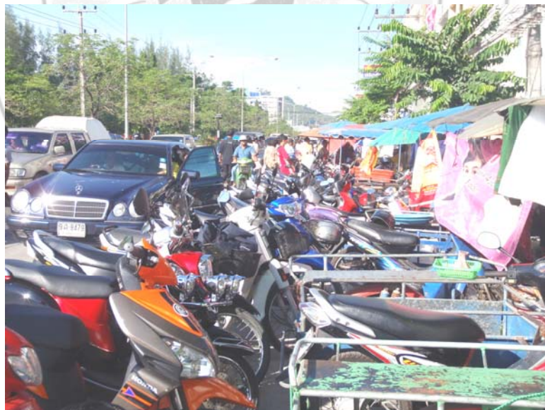
40. จุดเสี่ยง อันตรายจากมอเตอร์ไซค์ที่จอดริมถนน ซึ่งไม่สามารถรู้ได้เลยว่าคันไหนมีระเบิดซุกซ่อนอยู่