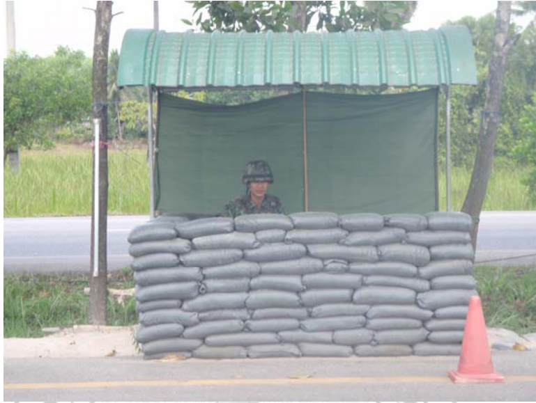
19. ป้อมจุดตรวจแบบ 24 ชั่วโมง ก่อนเข้าเขตพื้นที่อำเภอเมือง จังหวัดสงขลา