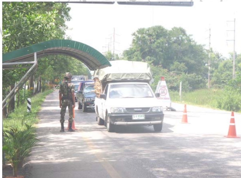
22. เจ้าหน้าที่กำลังปฏิบัติหน้าที่