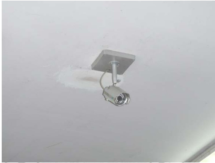
1. การป้องกันภัยด้วยการติดตั้งกล้องวงจรปิด