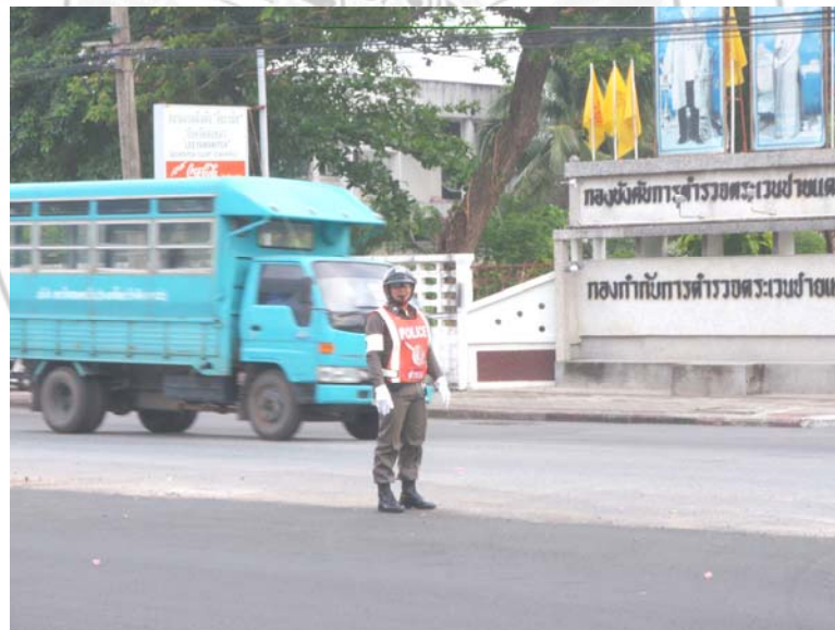
4. งานจราจร-กับแนวทางการป้องกันภัยบนท้องถนนให้กับประชาชน