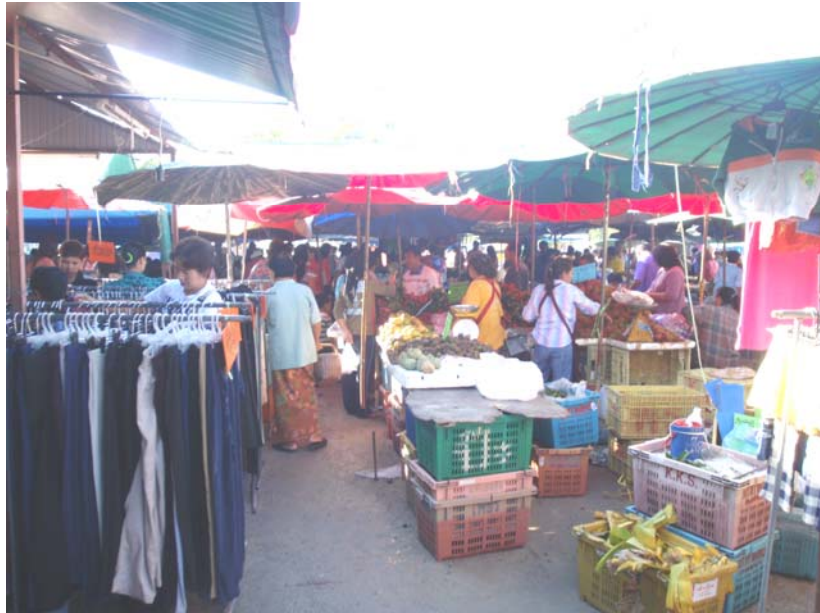
39. จุดเสี่ยง คนพลุกพล่านและสินค้าภายในบริเวณตลาดนัด ซึ่งยากต่อการตรวจตราของเจ้าหน้าที่