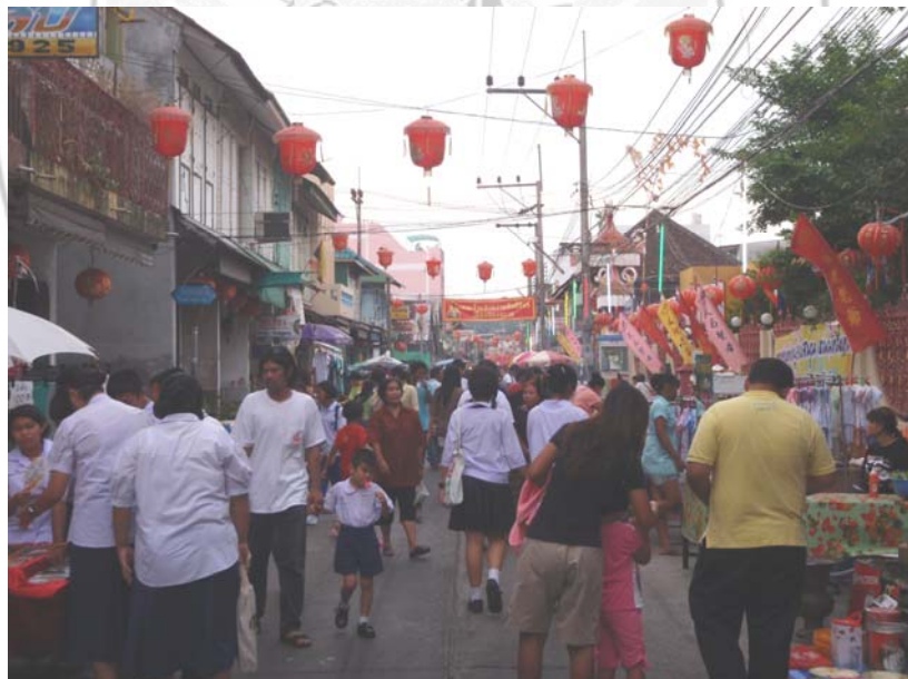
36. จุดเสี้ยว คนพลุกพล่านที่เหมาะสมแก่การก่อวินาศกรรม