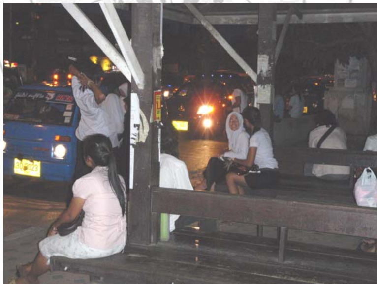
46. จุดเสี่ยงของนักศึกษาและประชาชนตอนย่ำค่ำบริเวณศาลารอรถหน้ามหาวิทยาลัยทักษิณ อำเภอเมือง จังหวัดสงขลา