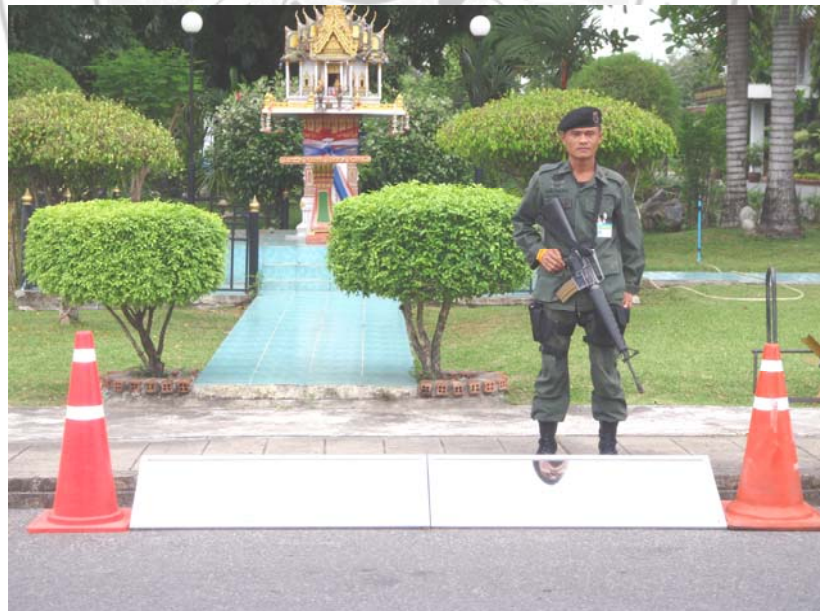
6. เจ้าหน้าที่รักษาความปลอดภัย