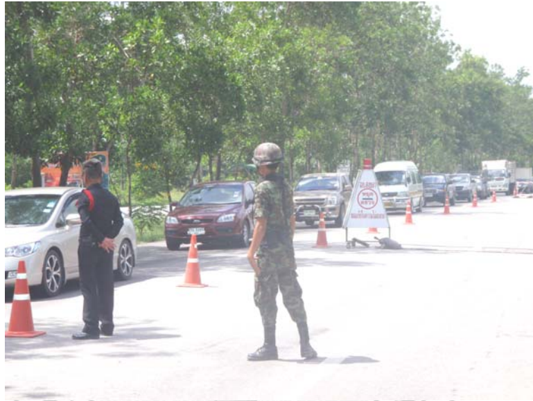
21. เจ้าหน้าที่ตำรวจ – ทหาร กำลังร่วมกันปฏิบัติหน้าที่ตรวจรถยนต์ ก่อนเข้าเขตพื้นที่อำเภอเมือง จังหวัดสงขลา