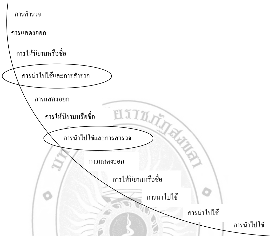
ภาพ 5 แสดงการสอนเนื้อหาหลายมโนคติที่ต่อเนื่องกัน ที่มา: Cohen, Staley และ Horak, 1989 อ้างถึงใน ภพ เลาห์ไพบุลย์, 2542: 145.

วงจรการเรียนรู้จะต้องใช้มากกว่า 1 ครั้ง เพื่อให้นักเรียนได้เรียนรู้ตามวัตถุประสงค์ของบทเรียนที่มีมโนคติหรือกระบวนการที่ค่อนข้างซับซ้อน แผนผังวงจรการเรียนรู้ในการขยายขั้นตอนนั้นจะใช้กิจกรรมการเรียนการสอนตามธรรมชาติในวงจรการเรียนรู้ เช่น จากขั้นตอนหนึ่งไปสู่อีกขั้นตอนถัดไป หรือจากวงจรการเรียนรู้หนึ่งไปสู่อีกวงจรการเรียนรู้ถัดไป ให้สังเกตว่าจุดเชื่อมต่อระหว่างวงจรการเรียนรู้อันหนึ่งกับวงจรถัดไปจะใช้กิจกรรมที่ให้ประสบการณ์ในขั้นการนำไปใช้และการสำรวจใหม่