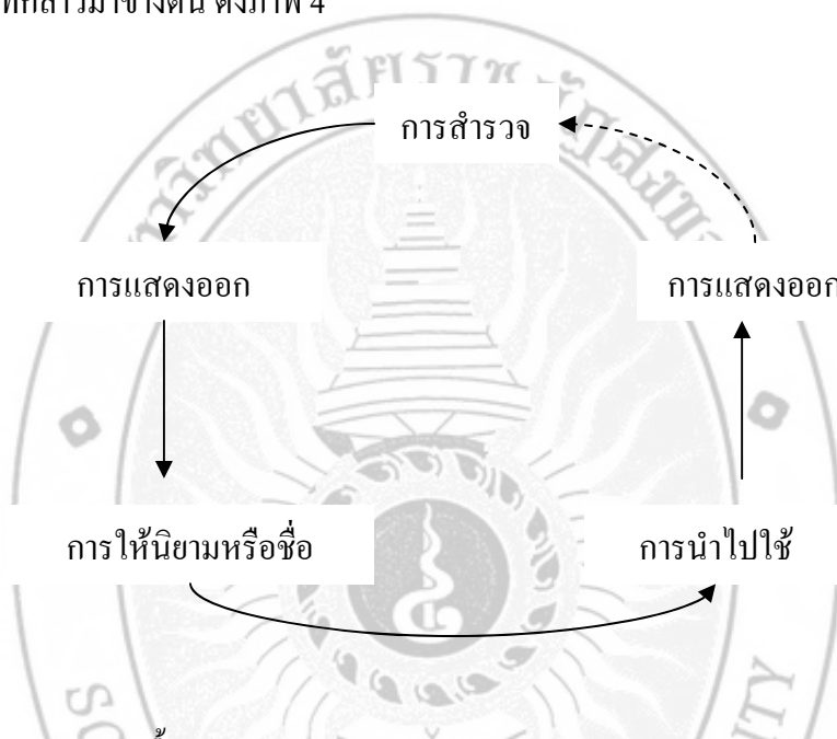
ภาพ 4 แสดงการสอนเนื้อหาหมโนคติเดียว

1. วงจรการเรียนรู้มโนคติหรือกระบวนการเดียวใน 1 ครั้ง ซึ่งครูสามารถนำไปใช้ตามขั้นตอนที่กล่าวมาข้างต้น ดังภาพ 4