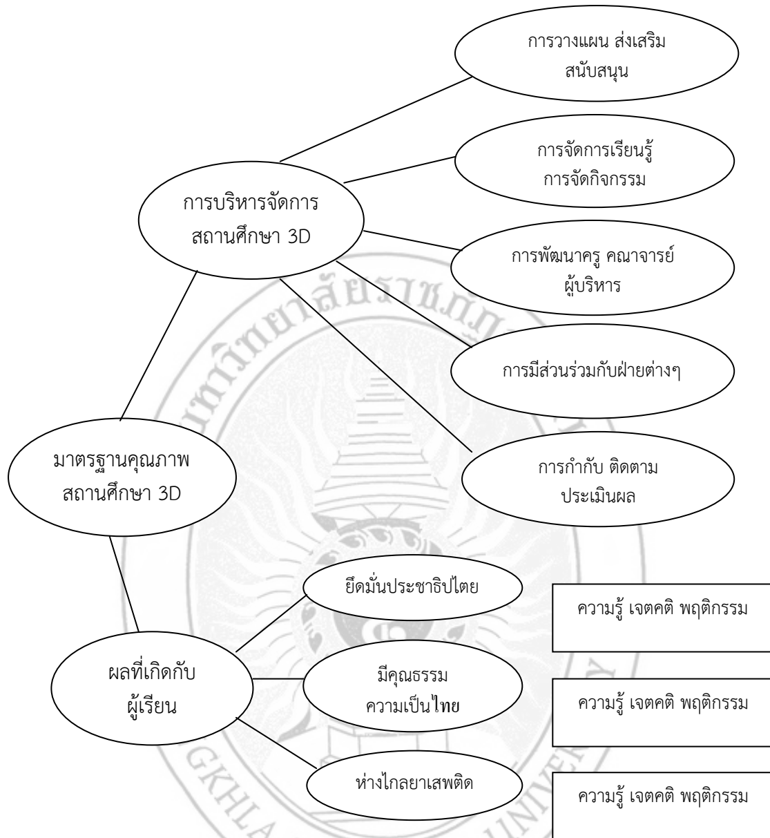
ภาพ 3 แสดงมาตรฐานคุณภาพสถานศึกษา 3D