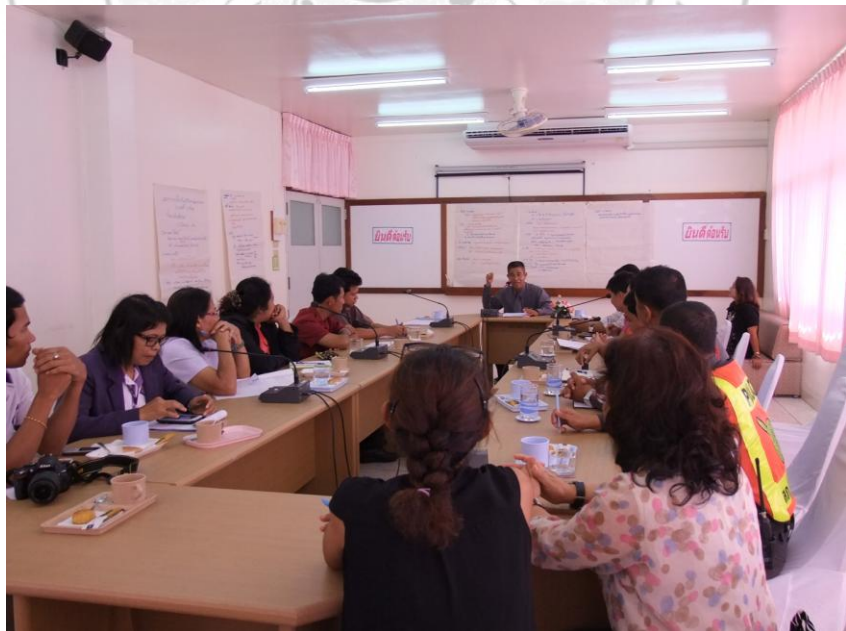
อภิปรายซักถามการสนทนากลุ่ม