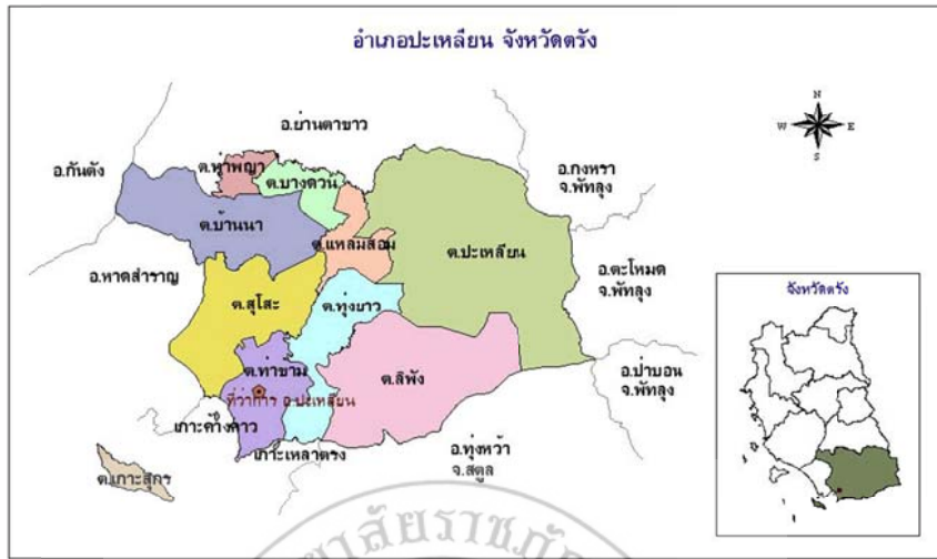
ภาพ 2 แผนที่แสดงภูมิประเทศและจุดที่ตั้งของตำบลในอำเภอพะเหลียน จังหวัดตรัง