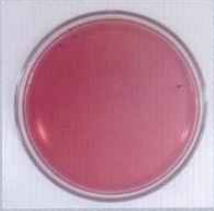
จำนวนเชื้ออีโคไลหลังทดสอบด้วยผงซิงค์ออกไซด์ ที่ผ่านการเผาที่อุณหภูมิ ๗๐๐ องศาเซลเซียส รูปที่ ๒ จำนวนเชื้ออีโคไล

ผศ.ดร.วีระชัย กล่าวว่า ผลการทดลองในครั้งนี้ สามารถนำไปต่อยอดหรือนำไปประยุกต์ใช้ในอุตสาหกรรมต่างๆ เช่น นำไปผสมในอุตสาหกรรมสีทาบ้าน เพื่อช่วยให้สีทาบ้านมีคุณสมบัติในการยับยั้งหรือฆ่าเชื้อแบคทีเรียได้