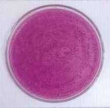
จำนวนเชื้ออีโคไลของตัวควบคุม