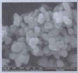
รูปที่ ๑ ลักษณะของผงซิงค์ออกไซด์

ผลการทดสอบการฆ่าเชื้ออีโคไลของผงซิงค์ออกไซด์ พบว่า ผงซิงค์ออกไซด์สามารถฆ่าเชื้ออีโคไลได้ดี เมื่อเปรียบเทียบกับตัวควบคุม โดยผงซิงค์ออกไซด์ที่ผ่านการเผาที่อุณหภูมิ ๓๐๐ ๕๐๐ และ ๗๐๐ องศาเซลเซียส สามารถฆ่าเชื้ออีโคไลได้เท่ากับ ๘๓.๓๓ ๘๓.๓๓ และ ๘๘.๐๐% ภายในเวลา ๒๐ นาที ดังรูปที่ ๒