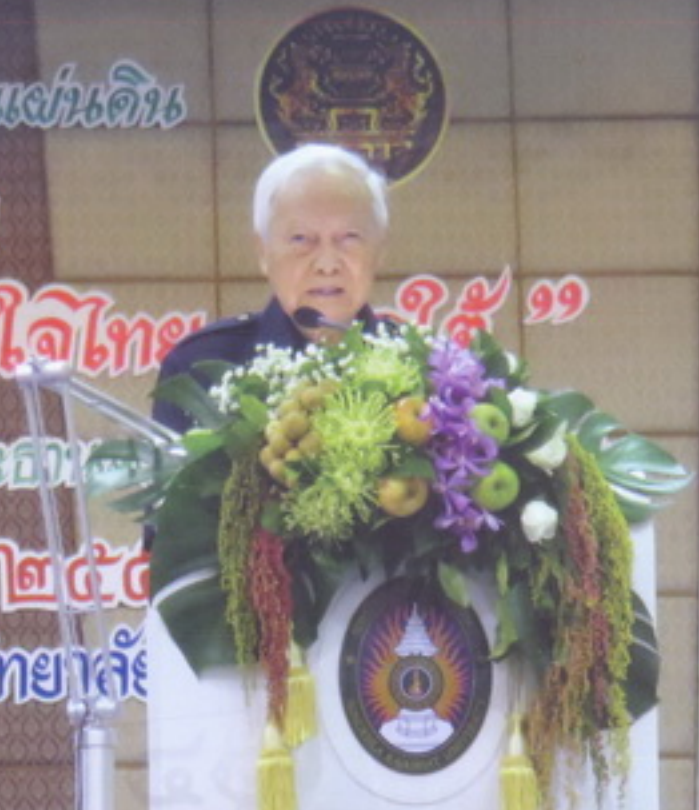
ฯพณฯ พลเอกเปรม กล่าวเปิดงาน รวมพล ๑๐ ปี เยาวชน โครงการ “สานใจไทย สู่ใจใต้”