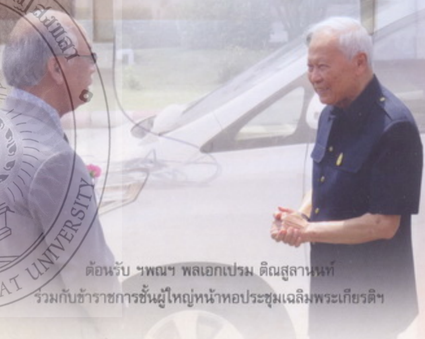
ต้อนรับ ฯพณฯ พลเอกเปรม ติณสูลานนท์ ร่วมกับข้าราชการชั้นผู้ใหญ่หน้าหอประชุมเฉลิมพระเกียรติฯ