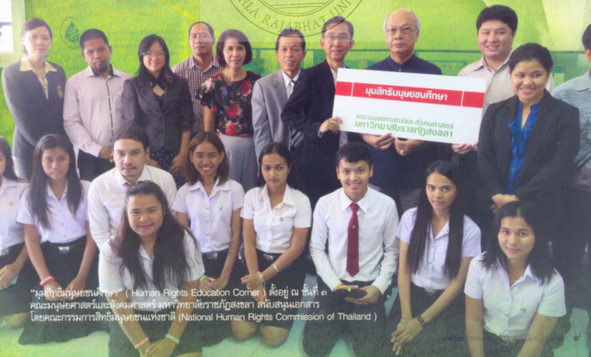
“มุมสิทธิมนุษยชนศึกษา” (Human Rights Education Corner) ตั้งอยู่ ณ ชั้นที่ ๓ คณะมนุษยศาสตร์และสังคมศาสตร์ มหาวิทยาลัยราชภัฏสงขลา สนับสนุนเอกสารโดยคณะกรรมการสิทธิมนุษยชนแห่งชาติ (National Human Rights Commission of Thailand)

“ให้ถือประโยชน์ส่วนตัวเป็นที่สอง ประโยชน์ของเพื่อนมนุษย์เป็นกิจที่หนึ่ง ลากทรัพย์ และเกียรติ จะตกมาแก่ท่านเอง ถ้าท่านทรงธรรมะแห่งอาชีพไว้ให้บริสุทธิ์”