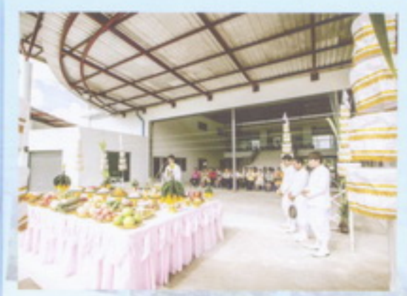
ติดตามข่าวสารได้ทางเพจ สระว่ายน้ำมหาวิทยาลัยราชภัฏสงขลา