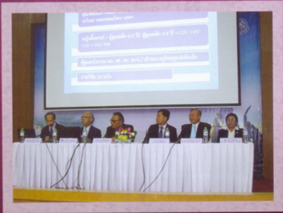
ภาพจากซ้าย : อธิการบดี มอ. มร.ภ.สงขลา ผู้ดำเนินการ ม.ทักษิณ ผู้แทน ม.หาดใหญ่ ผู้แทน มทร.ศรีวิชัย