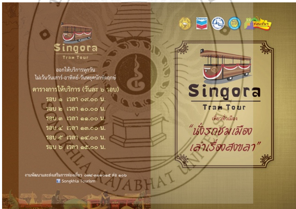
ภาพ 3 รอบเวลาการให้บริการรถราง “นั่งรถชมเมือง เล่าเรื่องสงขลา”

การบริการนักท่องเที่ยว “นั่งรถชมเมือง เล่าเรื่องสงขลา” เทศบาลนครสงขลา ได้จัดเพื่ออำนวยความสะดวกแก่นักท่องเที่ยวให้มีความสะดวกสบายมากยิ่งขึ้น และเป็นการช่วยลดภาระค่าใช้จ่ายของนักท่องเที่ยวและสามารถดึงดูดนักท่องเที่ยวให้มาเที่ยวในจังหวัดสงขลาได้มากยิ่งขึ้น ได้เปิดให้บริการตั้งแต่วันที่ 3 มีนาคม พ.ศ. 2555 ซึ่งมีรถรางนำเที่ยวจำนวน 3 คัน คันละ 32 ที่นั่ง โดยใช้เส้นทางรถท่องเที่ยวในเทศบาลนครสงขลา ได้จัดเส้นทางรถท่องเที่ยวไว้ 8 จุด เริ่มจากพิพิธภัณฑสถานแห่งชาติเป็นจุดออกรถ จากนั้นรถรางนำเที่ยวไปย่านเมืองเก่า ถนนนครใน ถนนนางงาม ศาลหลักเมือง เขียวริมหาดชลาทัศน์ ประติมากรรมทางพญานาค ประติมากรรม 14 ชั้นงาน ชมสระคือพญานาค ประติมากรรมพญานาคพ่นน้ำ สักการะอนุสาวรีย์กรมหลวงชุมพรเขตอุดมศักดิ์ และเที่ยวชมเขาดังกวน เปิดให้บริการทุกวัน ไม่เว้นวันหยุดราชการ ให้บริการวันละ 6 รอบ เวลา 09.00 น., 10.00 น., 11.00 น., 13.00 น., 14.00 น. และ 15.00 น.