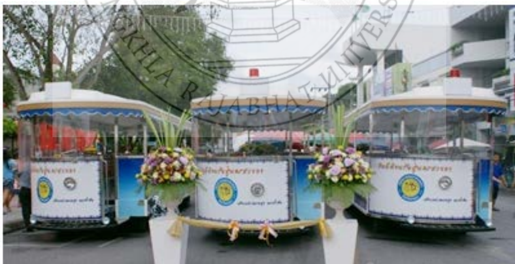
ภาพ 2 การเปิดตัวแถลงข่าวให้บริการรถราง