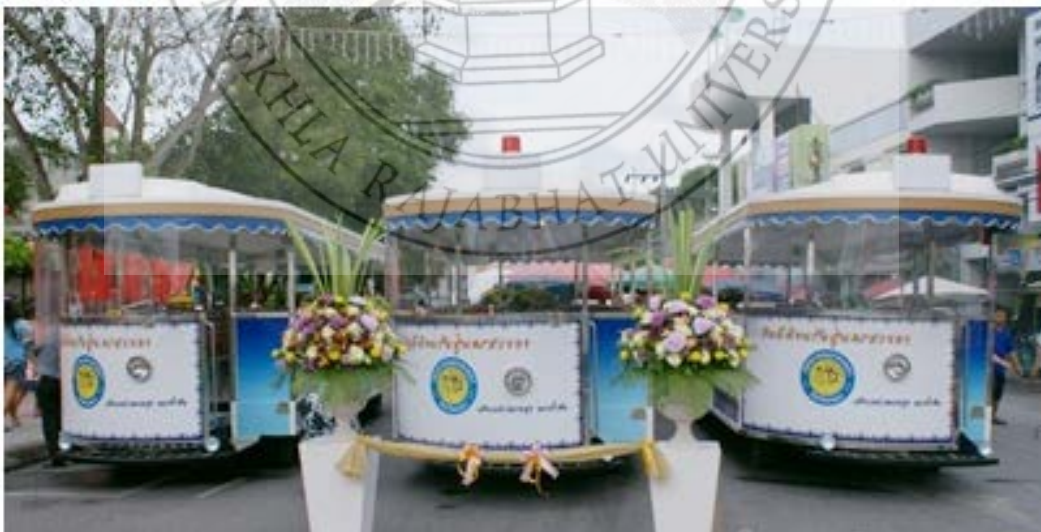
ภาพ 2 การเปิดตัวแถลงข่าวให้บริการรถราง