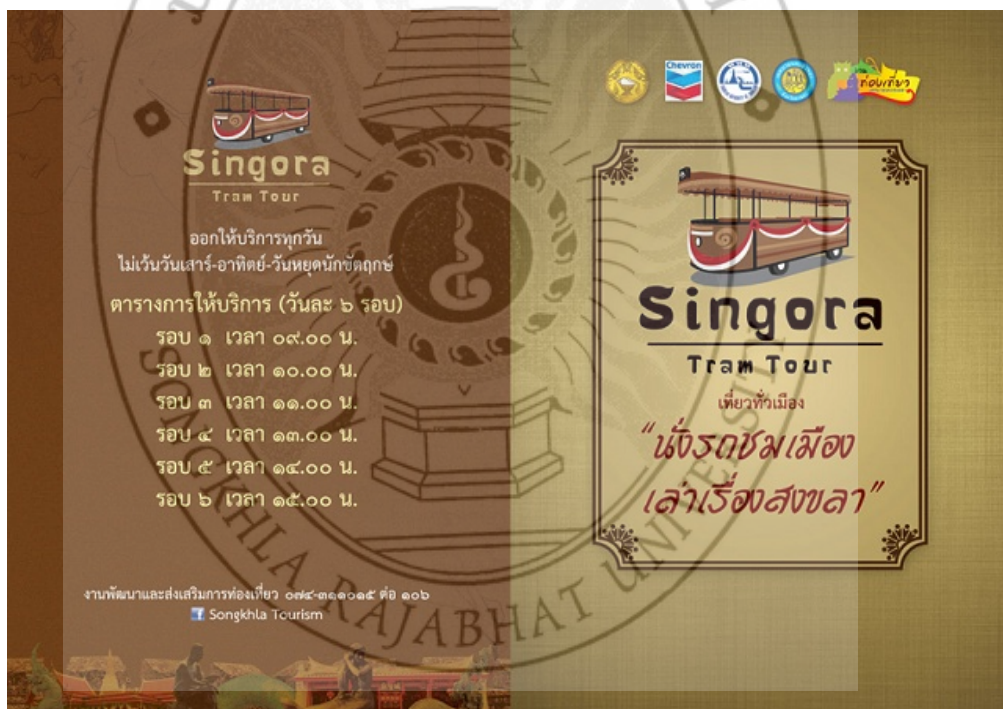
ภาพ 3 รอบเวลาการให้บริการรถราง “นั่งรถชมเมือง เล่าเรื่องสงขลา”

การบริการนักท่องเที่ยว “นั่งรถชมเมือง เล่าเรื่องสงขลา” เทศบาลนครสงขลา ได้จัดเพื่ออำนวยความสะดวกแก่นักท่องเที่ยวให้มีความสะดวกสบายมากยิ่งขึ้น และเป็นการช่วยลดภาระค่าใช้จ่ายของนักท่องเที่ยวและสามารถดึงดูดนักท่องเที่ยวให้มาเที่ยวในจังหวัดสงขลาได้มากยิ่งขึ้น ได้เปิดให้บริการตั้งแต่วันที่ 3 มีนาคม พ.ศ. 2555 ซึ่งมีรถรางนำเที่ยวจำนวน 3 คัน คันละ 32 ที่นั่ง โดยใช้เส้นทางรถท่องเที่ยวในเทศบาลนครสงขลา ได้จัดเส้นทางรถท่องเที่ยวไว้ 8 จุด เริ่มจากพิพิธภัณฑสถานแห่งชาติเป็นจุดออกรถ จากนั้นรถรางนำเที่ยวไปย่านเมืองเก่า ถนนนครใน ถนนนางงาม ศาลหลักเมือง เขียวริมหาดชลาทัศน์ ประติมากรรมทางพญานาค ประติมากรรม 14 ชั้นงาน ชมสระคือพญานาค ประติมากรรมพญานาคพ่นน้ำ สักการะอนุสาวรีย์กรมหลวงชุมพรเขตอุดมศักดิ์ และเที่ยวชมเขาดังกวน เปิดให้บริการทุกวัน ไม่เว้นวันหยุดราชการ ให้บริการวันละ 6 รอบ เวลา 09.00 น., 10.00 น., 11.00 น., 13.00 น., 14.00 น. และ 15.00 น.