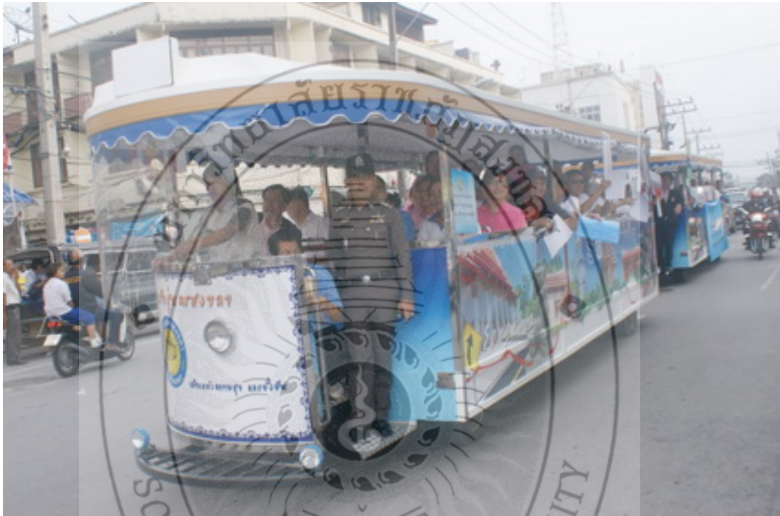
ภาพ 4 การให้บริการรถรางในเขตเทศบาลนครสงขลา ที่มา: ศูนย์ข่าวพลังชนสงขลา.

มากยิ่งขึ้น ได้เพิ่มจำนวนรถรางการให้บริการอีก 2 คัน รวมเป็น 5 คัน และเพิ่มตารางรอบการให้บริการรถรางเป็น 8 รอบต่อวัน เปิดให้บริการทุกวันไม่เว้นวันหยุดราชการ รอบเช้า เวลา 09.00 น., 10.00 น., 11.00 น. และ 12.00 น. รอบบ่าย 13.00 น., 14.00 น., 15.00 น. และ 16.00 น. การให้บริการรถรางใช้เวลาประมาณรอบละ 45 นาที และการให้บริการฟรีตลอดเส้นทาง