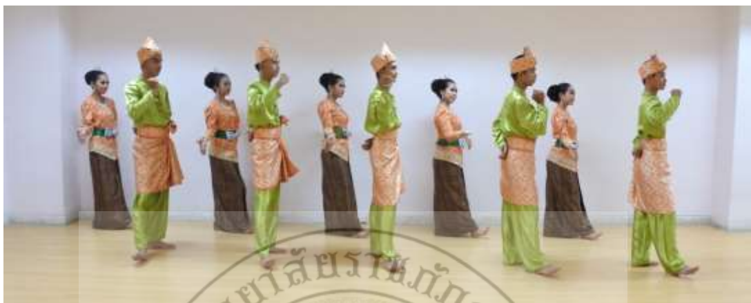
ภาพที่ 1 : ทำจำปาตะ 1