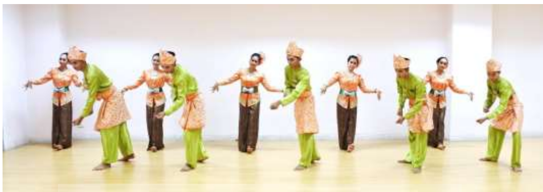
ภาพที่ 5 : ท่าจำปาตะ 5