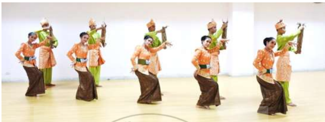
ภาพที่ 25 : ทำจำปาละ 25