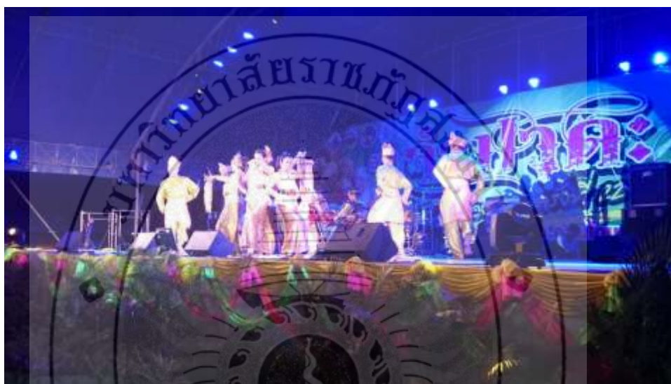
ภาพที่ 42 : การแสดงครั้งแรกในงานวันจำปาตะ

การแสดงชุดตารีจำปาตะ เป็นนวัตกรรมทางการแสดงที่สร้างสรรค์ขึ้นเพื่อช่วยประชาสัมพันธ์และส่งเสริมการประกอบอาชีพการทำสวนจำปาตะในเขตพื้นที่อำเภอควนโดน จังหวัดสตูล เมื่อสร้างสรรค์เสร็จสมบูรณ์ได้นำเผยแพร่ครั้งแรกเมื่อวันที่ 22 สิงหาคม 2559 โดยใช้แสดงในงานวันจำปาตะของอำเภอควนโดน จังหวัดสตูล การแสดงครั้งนี้ได้รับการชื่นชมจากชาวบ้านผู้มาชมงาน และศิลปินพื้นบ้านดาระในพื้นที่อำเภอควนโดน จังหวัดสตูล ดังภาพต่อไปนี้