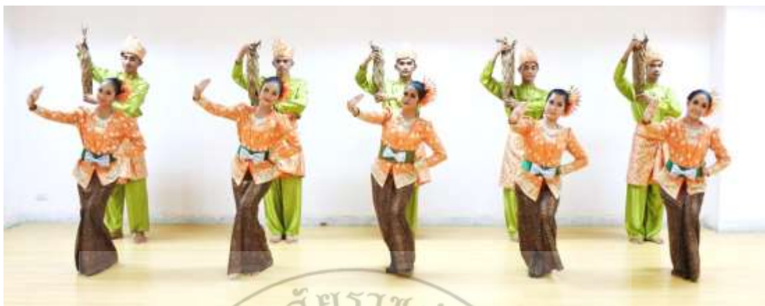
ภาพที่ 32 : ทำจำปาตะ 32