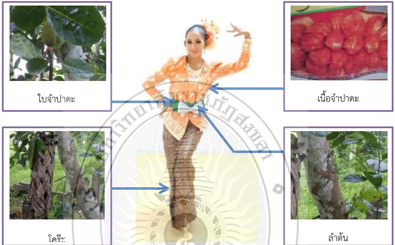
ภาพที่ 40 : การแต่งกายนักแสดงผู้หญิง

การออกแบบเครื่องแต่งกายนักแสดงผู้หญิงก็นำมาจากลักษณะกายภาพของจำปาตะเช่นเดียวกัน เสื้อบานงใช้สีส้มซึ่งเป็นสีของเนื้อจำปาตะ ผ้าคาดเอวสีเขียวแก่นำมาจากสีของใบจำปาตะ โบว์สีเทานำมาจากสีของลำตันจำปาตะ ผ้านุ่งลายตารางสีน้ำตาลนำมาจากสีของโครีะที่แห้งจนเป็นสีน้ำตาล