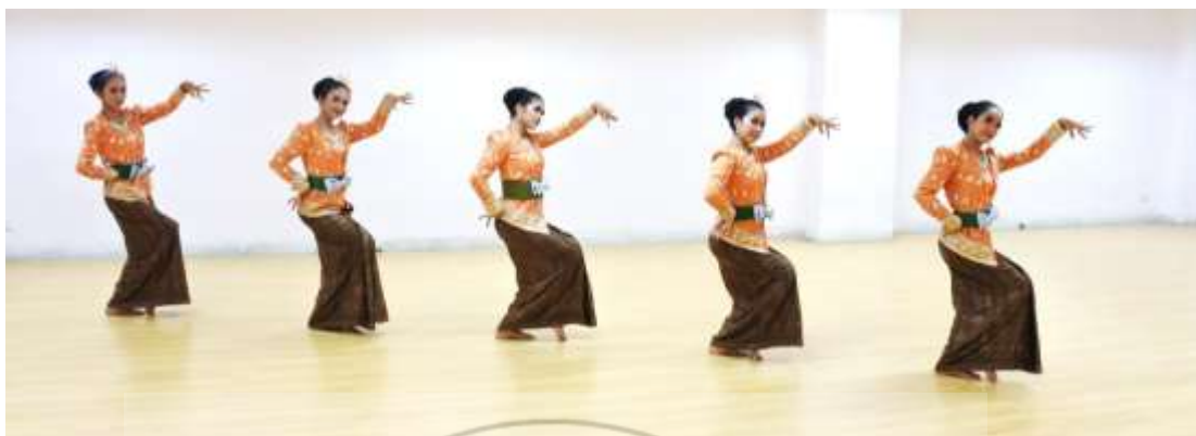
ภาพที่ 24 : ทำจำปาตะ 24