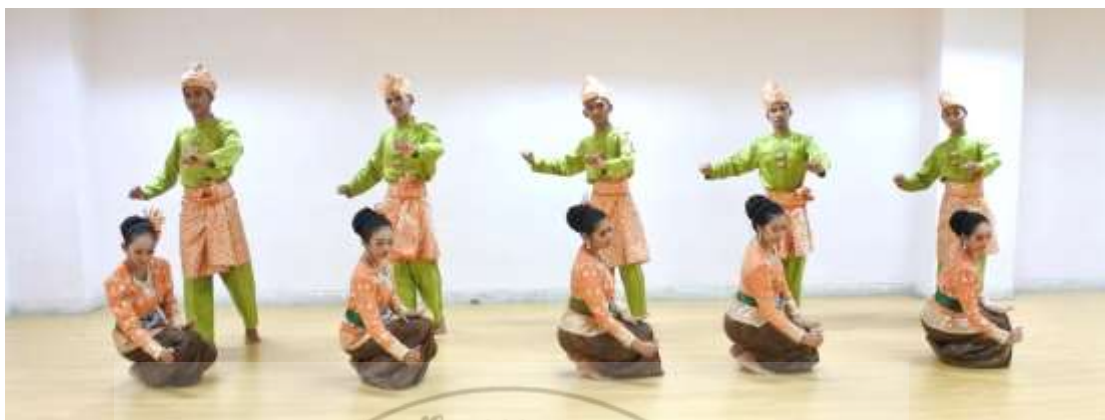
ภาพที่ 16 : ทำจำปาตะ 16