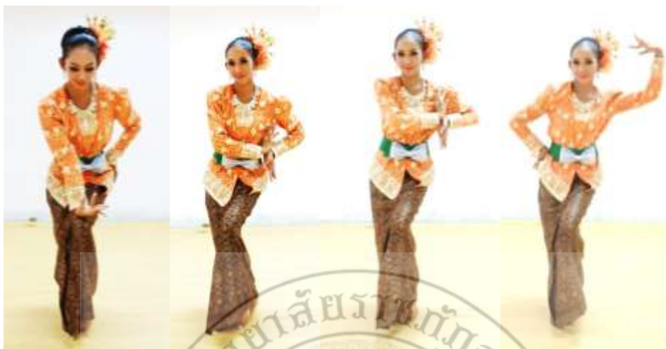
ภาพที่ 23 : ทำจำปาตะ 23