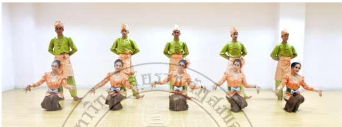
ภาพที่ 12 : ท่าจำปาตะ 12