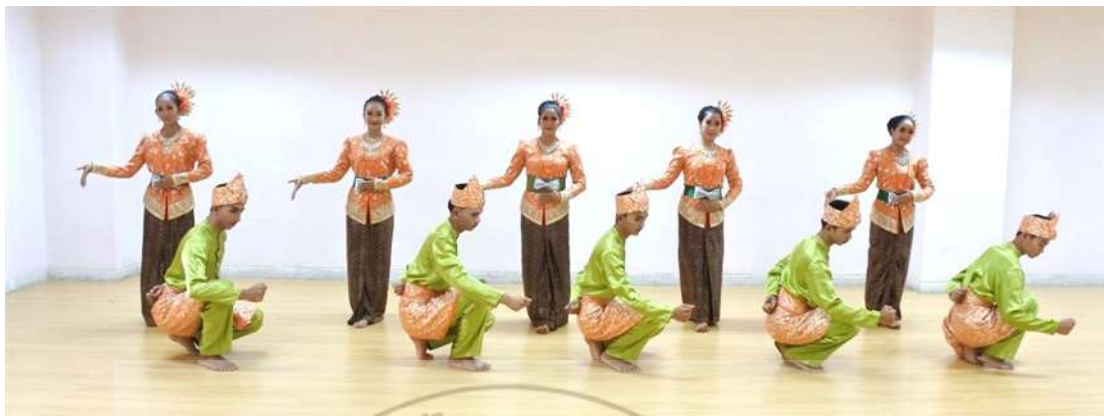
ภาพที่ 14 : ทำจำปาตะ 14