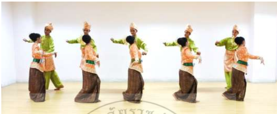
ภาพที่ 21 : ทำจำปาตะ 21