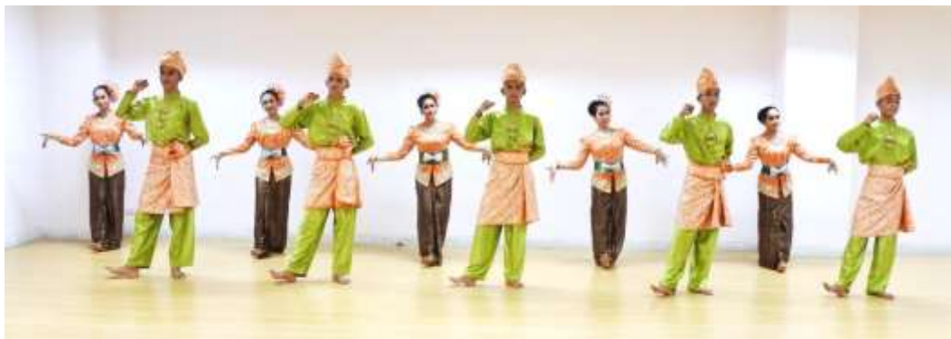
ภาพที่ 3 : ทำจำปาตะ 4