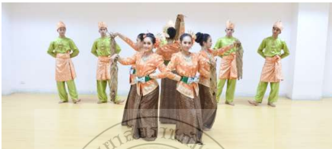
ภาพที่ 28 : ทำจำปาตะ 28