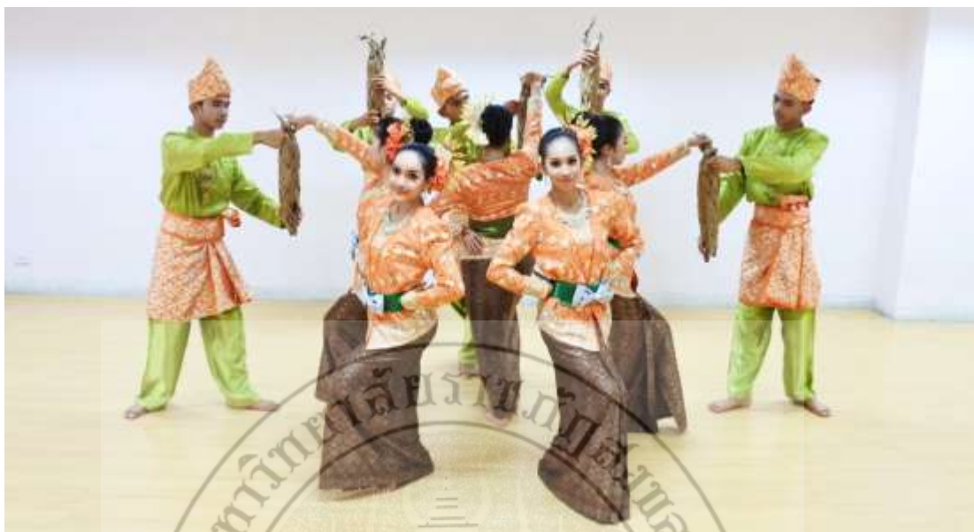
ภาพที่ 31 : ทำจำปาตะ 31