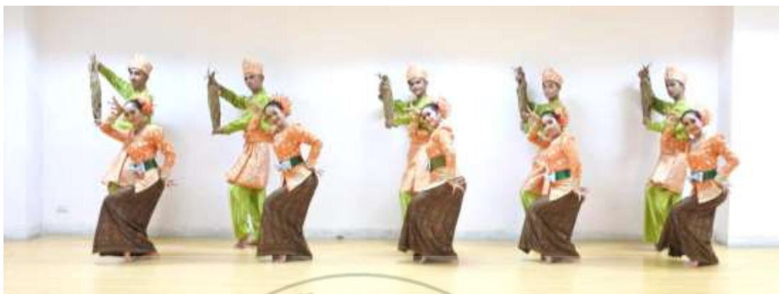
ภาพที่ 36 : ทำจำปาตะ 36