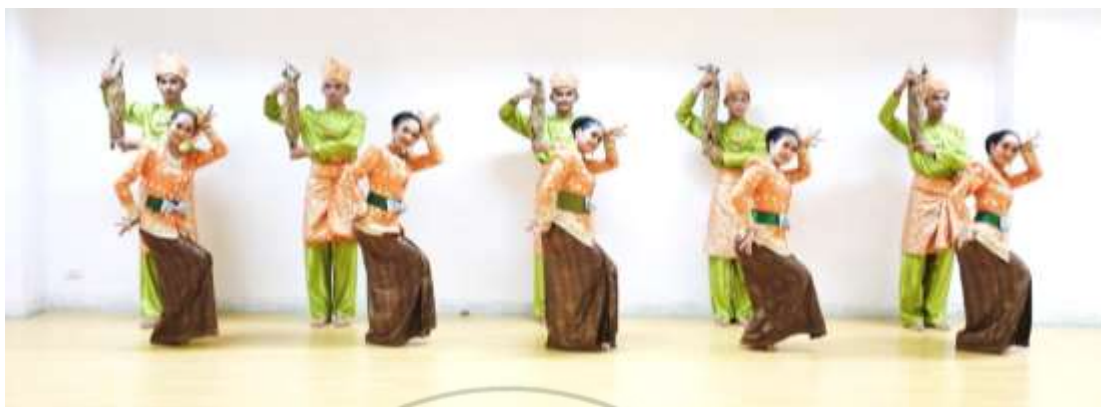
ภาพที่ 35 : ทำจำปาตะ 35