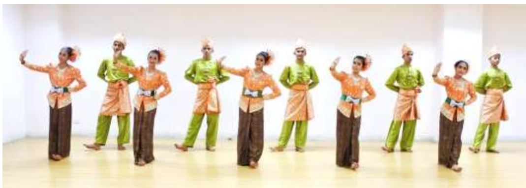
ภาพที่ 7 : ทำจำปาตะ 7