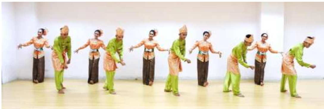
ภาพที่ 3 : ท่าจำปาละ 3