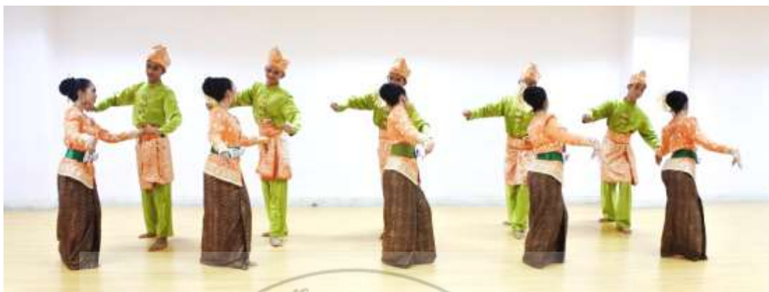
ภาพที่ 13 : ทำจำปาตะ 13