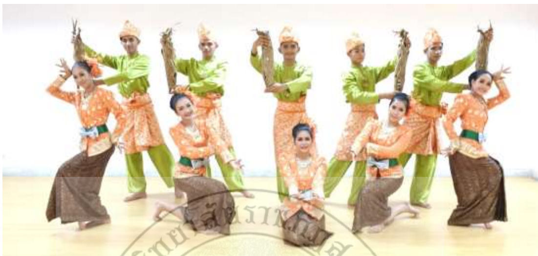
ภาพที่ 37 : ทำจำปาตะ 37