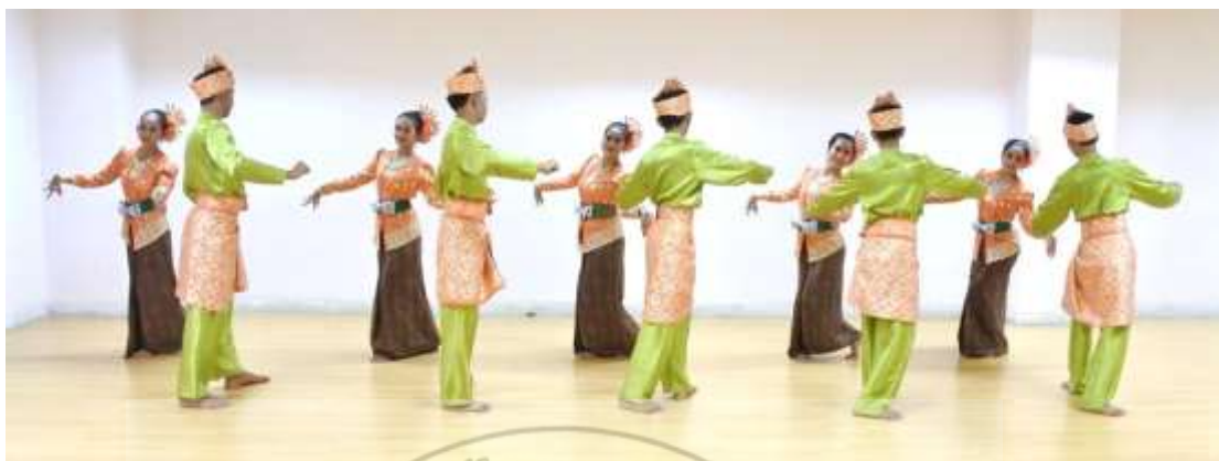
ภาพที่ 15 : ทำจำปาละ 15