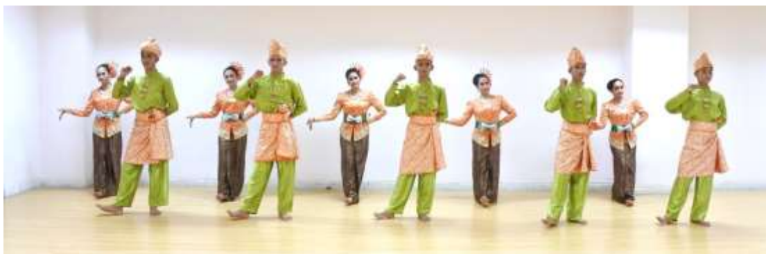
ภาพที่ 2 : ทำจำปาตะ 2