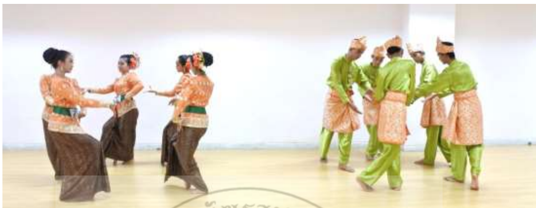
ภาพที่ 18 : ทำจำปาตะ 18