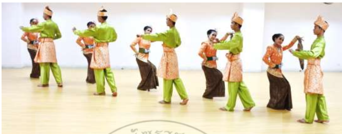
ภาพที่ 27 : ทำจำปาตะ 27