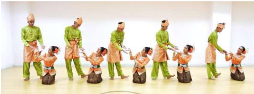
ภาพที่ 9 : ท่าจำปาตะ 9