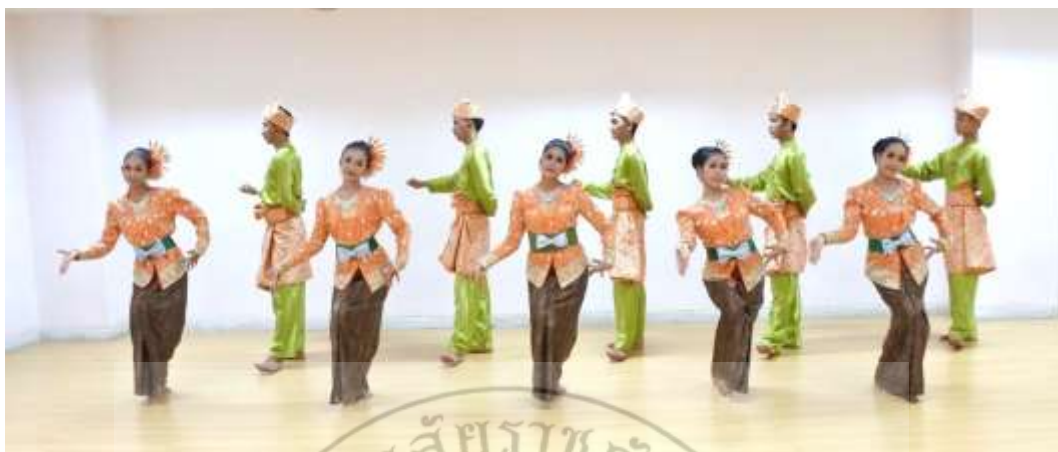
ภาพที่ 19 : ทำจำปาตะ 19