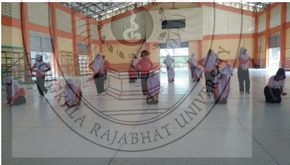
ภาพที่ 44 : กิจกรรมการถ่ายทอดตำรายาประจำภาคให้กับนักเรียน 2