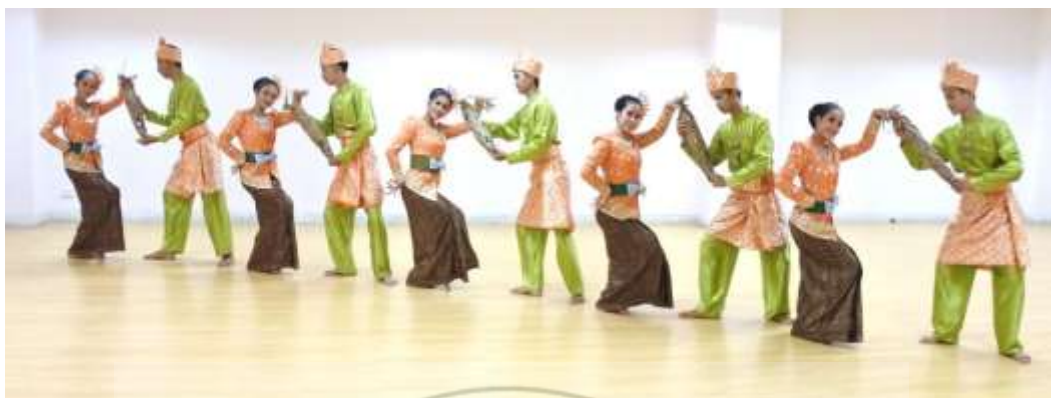
ภาพที่ 26 : ทำจำปาตะ 26