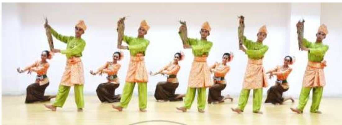
ภาพที่ 34 : ท่าจำปาตะ 34