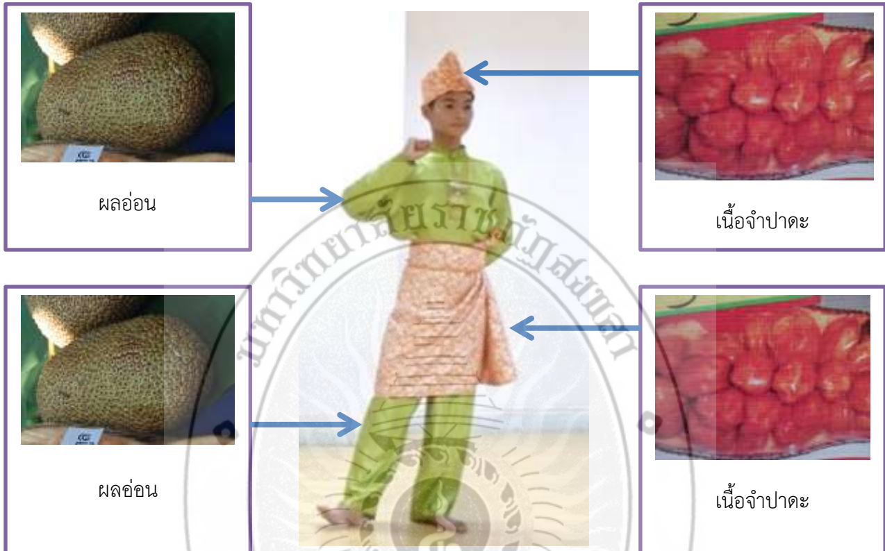
ภาพที่ 39 : การแต่งกายนักแสดงผู้ชาย