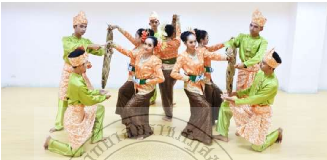
ภาพที่ 30 : ทำจำปาตะ 30