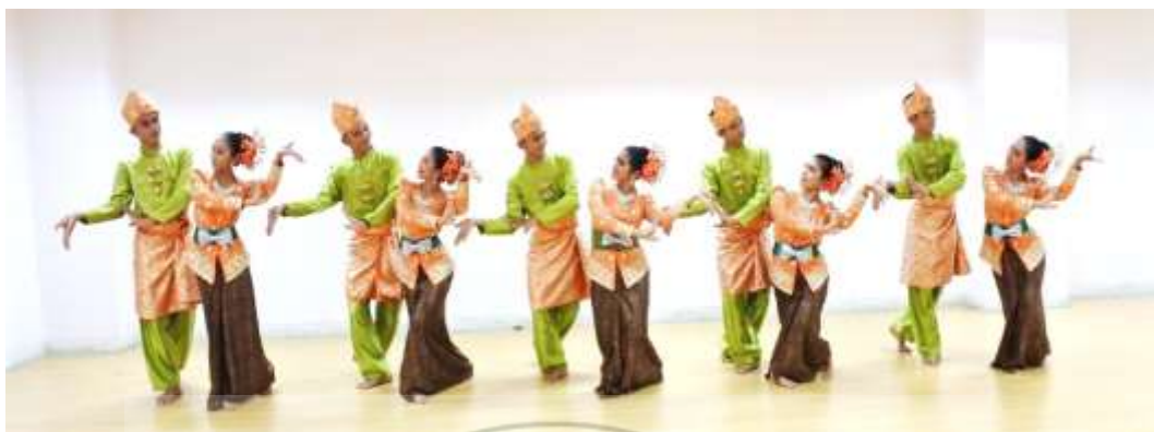
ภาพที่ 20 : ทำจำปาตะ 20