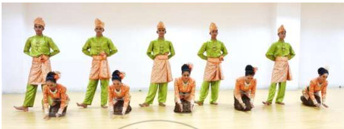
ภาพที่ 10 : ทำจำปาตะ 10