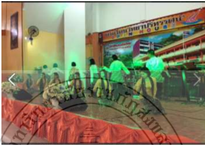
ภาพที่ 45 : ชุมชนนำตารีจำปาตะโป้ใช้แสดง

เมื่อวันที่ 10 มกราคม พ.ศ. 2560 โรงเรียนควนโดนวิทยาได้จัดกิจกรรมเปิดบ้านวิชาการ ซึ่งเป็นกิจกรรมที่เชิญนักเรียนจากโรงเรียนอื่น ๆ เข้ามาดูงานหรือแนะแนว ในการจัดกิจกรรมครั้งนี้ ทางโรงเรียนควนโดนวิทยาได้นำการแสดงชุด “ตารีจำปาตะ” ซึ่งเป็นผลงานวิจัยเรื่องการศึกษา พัฒนาการจำปาตะสู่ผลงานสร้างสรรค์ : ตารีจำปาตะ มาเผยแพร่สู่สาธารณชนเป็นครั้งแรกหลังจาก ได้รับการถ่ายทอดการแสดงจากคณะนักวิจัย ดังนั้นการสร้างสรรค์ทางการแสดงต้องมองถึง ผู้นำไปใช้เป็นหลักสำคัญ สร้างสรรค์การแสดงให้มีความใกล้เคียงกับวิถีชีวิตของผู้สืบสานหรือผู้ใช้จริง ผลงานวิจัยสร้างสรรค์จึงจะได้ประโยชน์อย่างคุ้มค่า