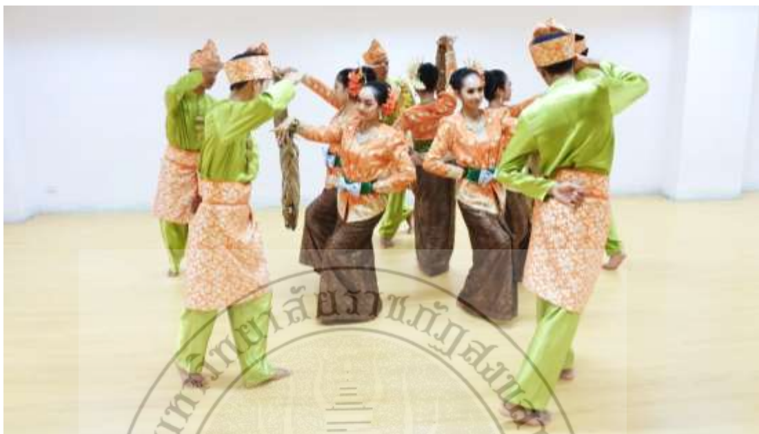
ภาพที่ 29 : ทำจำปาตะ 29