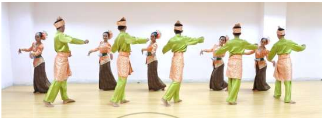
ภาพที่ 17 : ทำจำปาตะ 17