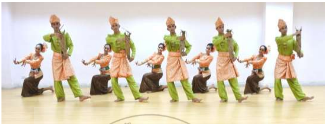
ภาพที่ 33 : ทำจำปาตะ 33