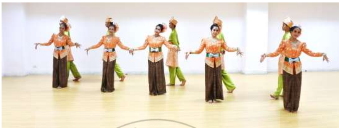
ภาพที่ 22 : ทำจำปาละ 22