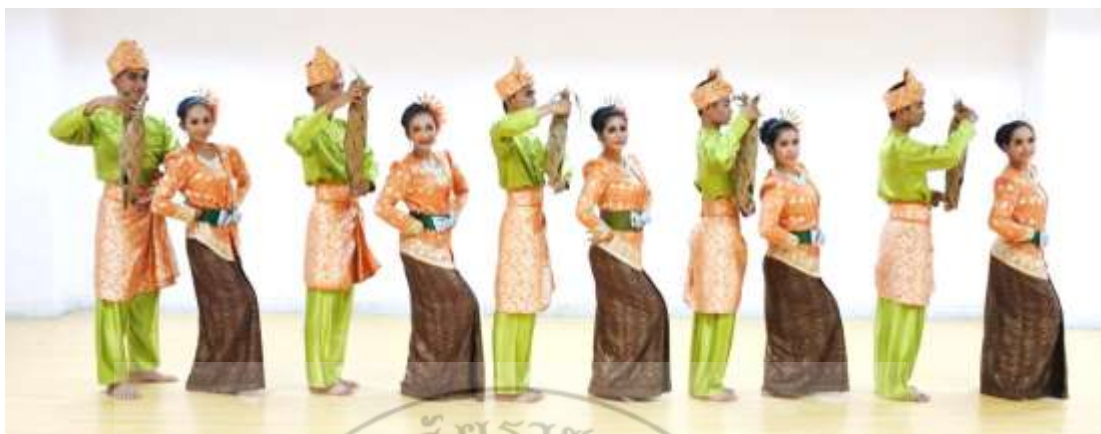
ภาพที่ 38 : ท่าจำปาตะ 38