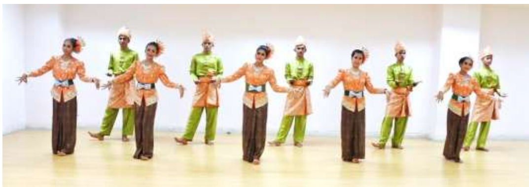
ภาพที่ 8 : ทำจำปาตะ 8