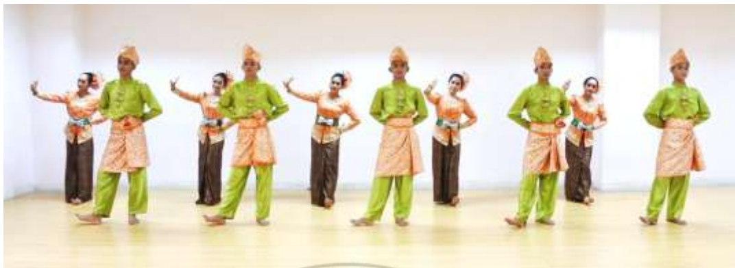
ภาพที่ 6 : ทำจำปาตะ 6