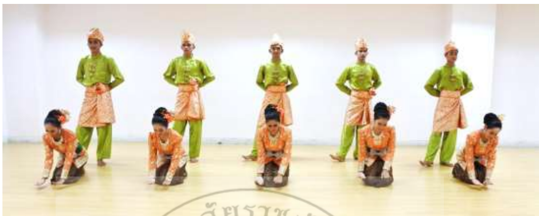
ภาพที่ 11 : ทำจำปาตะ 11