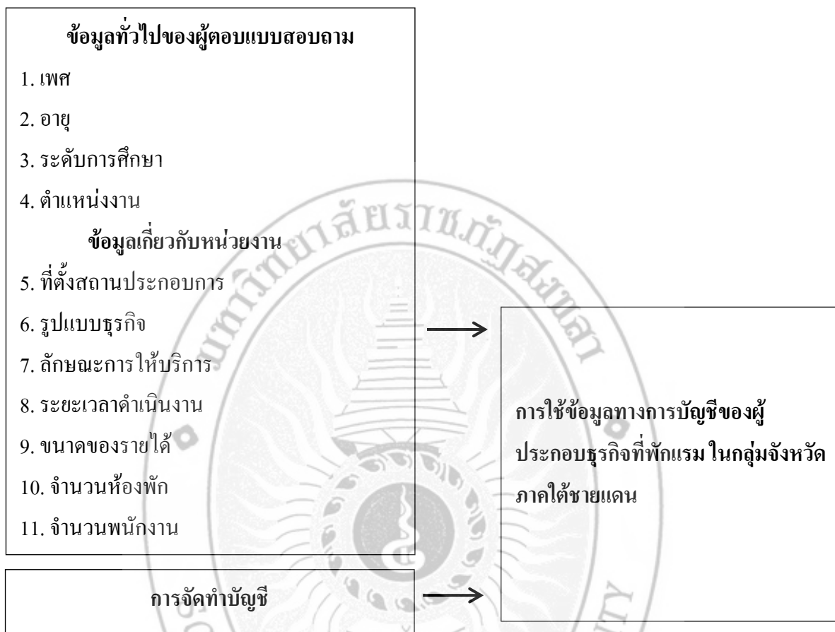
ภาพที่ 2 กรอบแนวคิด