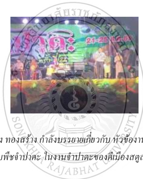
ภาพประกอบที่ 2 ดร.บรรจง ทองสร้าง กำลังบรรยายเกี่ยวกับ หัวข้องานวิจัย การสร้างสรรค์บทเพลง เกี่ยวกับพืชจำปาตะ ในงานจำปาตะของดีเมืองสตูล ปี 2559