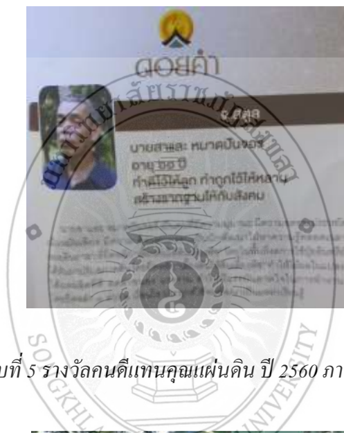
ภาพประกอบที่ 5 รางวัลคนดีแทนคุณแผ่นดิน ปี 2560 ภาคใต้ จังหวัดสตูล