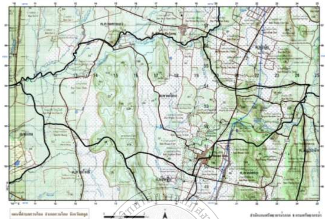
ภาพประกอบที่ 1 แผนที่ตำบลควนโดน