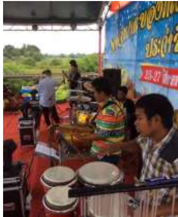
ภาพประกอบที่ 10 อาจารย์และนักเรียนจากโรงเรียนราชประชานุเคราะห์ 42 จังหวัดสตูล กำลังร่วมบรรเลงกีตาร์และเพอร์คัสชันในงานจำปาอะของดีเมืองสตูลปี 2560