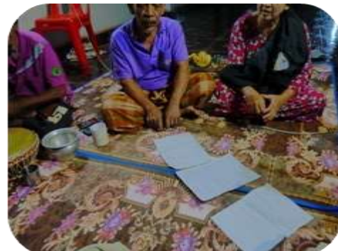
ภาพประกอบที่ 25-26 ผู้วิจัยกำลังสนทนากลุ่ม กับศิลปินวงบาลาจัน