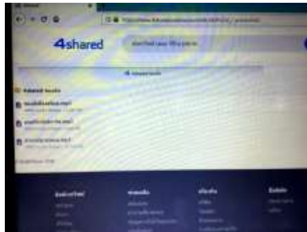
ภาพประกอบที่ 1 ตัวอย่างการเผยแพร่เพลงเกี่ยวกับพืชจำปาตะในสื่อออนไลน์

การเผยแพร่เพลงของวงบาลาจันในสื่อหรือกิจกรรมต่างๆ ที่เกี่ยวกับพืชจำปาตะ ตามคำแนะนำของ เจ้าหน้าที่ที่เกี่ยวข้อง