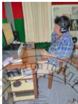
ภาพประกอบที่ 30 ผู้วิจัยกำลังทำการบันทึกเสียง ณ Dr.Music Studio