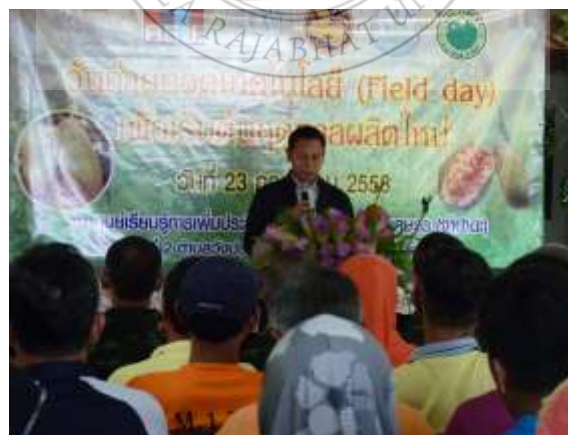
ภาพประกอบที่ 16 ภาพกิจกรรมในวัน Field day เพื่อการเริ่มต้นฤดูแห่งผลผลิตใหม่