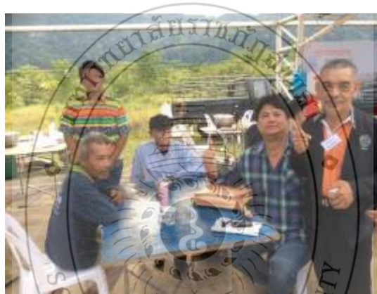
ภาพประกอบที่ 11 ผู้วิจัยร่วมปรึกษาแนวทางในการเผยแพร่ผลงานเพลงกับวงบาลาจัน และอาจารย์สอนดนตรี โรงเรียนราชประชานุเคราะห์ 42 ปี 2560