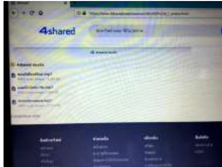
ภาพประกอบที่ 75 ตัวอย่างการเผยแพร่เพลงเกี่ยวกับพีชจำปาตะในสื่อออนไลน์