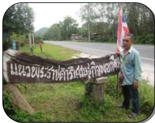
ภาพประกอบที่ 9-13 สภาพทั่วไปในพื้นที่ศูนย์เศรษฐกิจพอเพียงตามแนวพระราชดำริ