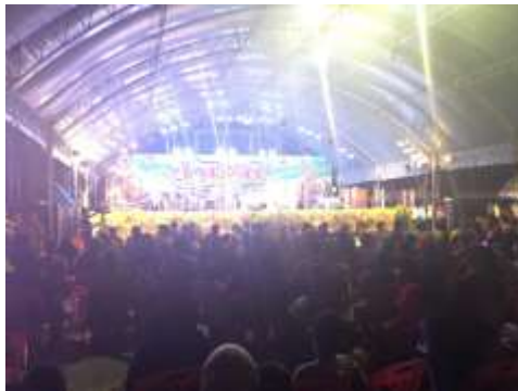
ภาพประกอบที่ 78 ภาพบรรยากาศผู้คนอันล้นหลาม ร่วมรับชมรับฟังการแสดงบทเพลงที่เกี่ยวกับพืชจำปาตะ ในงานวันจำปาตะของคีเมืองสตูล ปี 2559