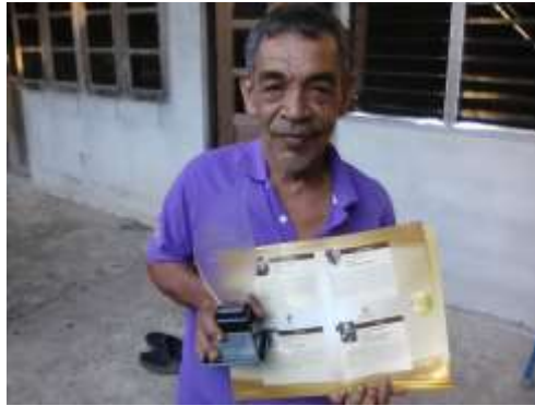
ภาพประกอบที่ 4 ได้รับรางวัลคนดีแทนคุณแผ่นดิน ปี 2560