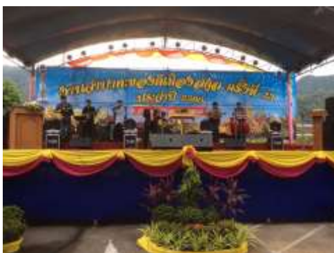
ภาพประกอบที่ 7 งานบำเพ็ญประโยชน์ของคณาจารย์มหาวิทยาลัยราชภัฏสุราษฎร์ธานี ประจำปี 2560