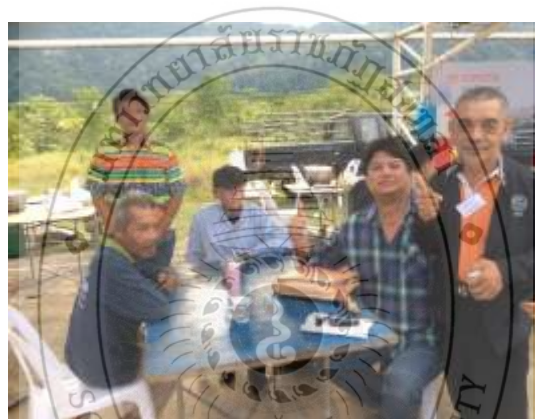
ภาพประกอบที่ 85 ผู้วิจัยร่วมปรึกษาแนวทางในการเผยแพร่ผลงานเพลงกับวงบาลาจัน และอาจารย์สอนดนตรี โรงเรียนราชประชานุเคราะห์ 42 ปี 2560