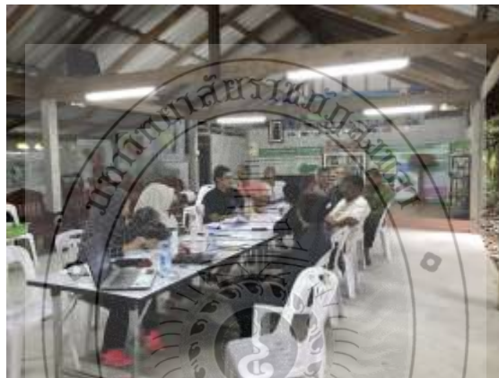
ภาพประกอบที่ 88 นายสาและ หมัดปิ่นจอร์ ร่วมประชุมเครือข่าย ณ ศูนย์เศรษฐกิจพอเพียง และใช้เพลงที่วงบาลาจันแต่งขึ้นมาเผยแพร่ในงานดังกล่าว