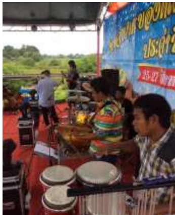
ภาพประกอบที่ 84 อาจารย์และนักเรียนจากโรงเรียนราชประชานุเคราะห์ 42 จังหวัดสตูล กำลังร่วมบรรเลงกีตาร์และเพอร์คัสชันในงานจำปาอะของดีเมืองสตูลปี 2560