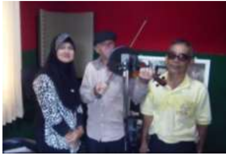
ภาพประกอบที่ 29 บรรยากาศในการบันทึกเสียง