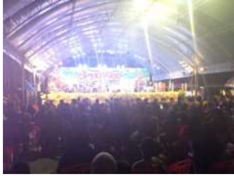
ภาพประกอบที่ 4 ภาพบรรยากาศผู้คนอันล้นหลาม ร่วมรับชมรับฟังการแสดงบทเพลงที่เกี่ยวกับพีชจำปาตะ ในงานวันจำปาตะของดีเมืองสตูล ปี 2559