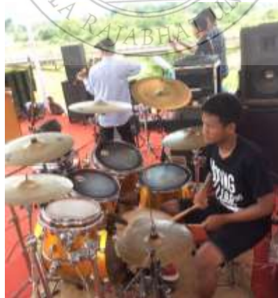
ภาพประกอบที่ 83 นักเรียนจากโรงเรียนราชประชานุเคราะห์ 42 จังหวัดสตูล ร่วมบรรเลงกลองชุดในงานจำปาตะของดีเมืองสตูล ปี 2560