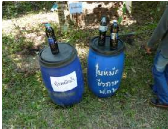
ภาพประกอบที่ 14 การสาธิตทำปุ๋ยหมักชีวภาพ