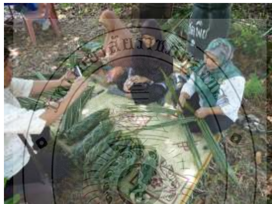
ภาพประกอบที่ 15 การสาธิตวิธีการสวน โครีะ