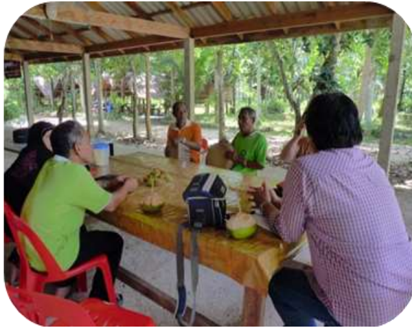
ภาพประกอบที่ 24 ผู้วิจัยกำลังสัมภาษณ์กลุ่มศิลปินบาหลี