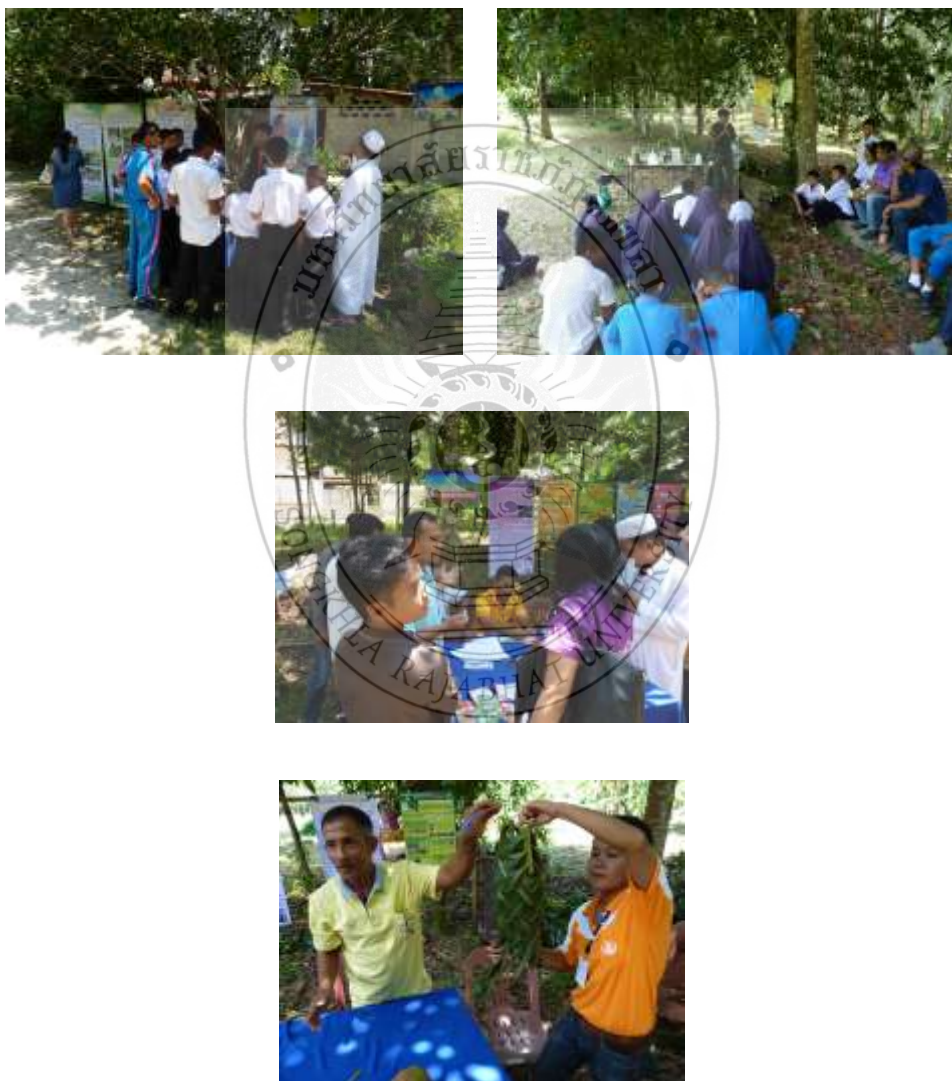
ภาพประกอบที่ 19-22 นักเรียน นักศึกษา และผู้ที่สนใจ เข้ามาศึกษาหาความรู้ จากศูนย์เศรษฐกิจพอเพียง