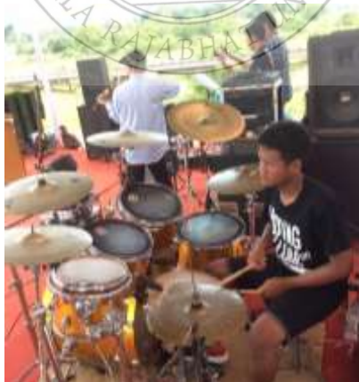
ภาพประกอบที่ 9 นักเรียนจากโรงเรียนราชประชานุเคราะห์ 42 จังหวัดสุราษฎร์ธานี ร่วมบรรเลงกลองชุดในงานบำเพ็ญประโยชน์ของคณาจารย์มหาวิทยาลัยราชภัฏสุราษฎร์ธานี ประจำปี 2560