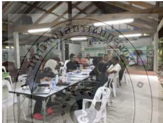
ภาพประกอบที่ 14 นายสาและ หมัดปิ่นจอร์ ร่วมประชุมเครือข่าย ณ ศูนย์เศรษฐกิจพอเพียง และใช้เพลงที่วงบาลาจน์แต่งขึ้นมาเผยแพร่ในงานดังกล่าว