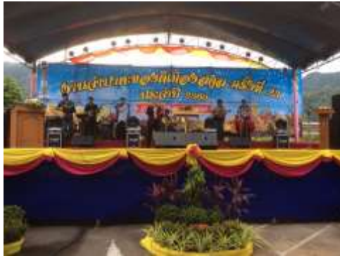
ภาพประกอบที่ 81 งานจำปาตะของดีเมืองสตูลครั้งที่ 23 พ.ศ.2560