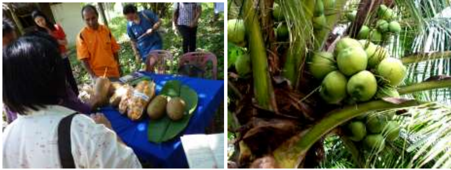
ภาพประกอบที่ 17-18 ผลผลิตจากศูนย์เศรษฐกิจพอเพียงตามแนวพระราชดำริ