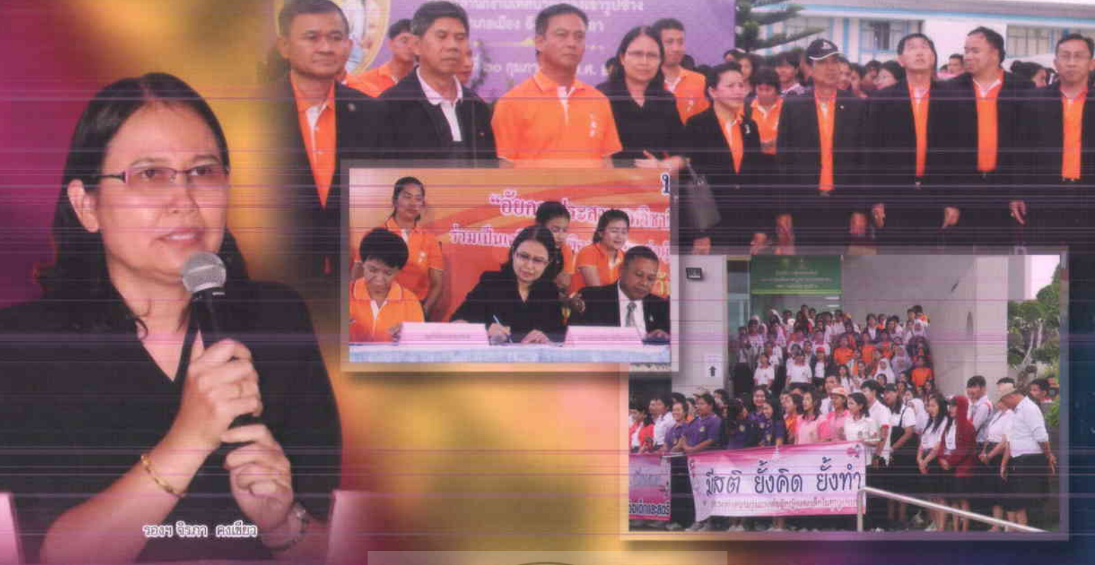
รองอธิการฯ คองเซียว