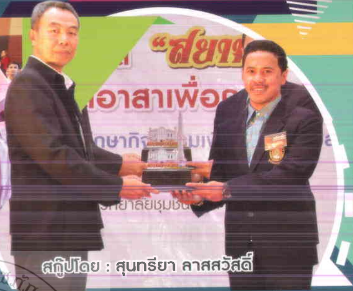
สถิติโดย : สุนทรียา ลาศสวัสดิ์

“รางวัลนักร้องสารมวลชน ผู้ทำคุณประโยชน์ต่อสังคมดีเด่น เป็นรางวัลที่เกิดจากการมีจิตอาสา และยอมเสียสละเวลาส่วนตัว ทุกครั้งที่ทีมงานในสายสื่อสารมวลชนเข้ามา โดยไม่เคยปรักปรำกัน และไม่ได้นึกถึงสิ่งตอบแทน แค่ได้ทำงานที่รัก ซื่อสัตย์กับหน้าที่ และนำประสบการณ์มาพัฒนาตัวเองให้ก้าวต่อไปไม่มีวันหยุด แต่คงเหมือนสากษัตริย์ปิดทองหลังพระอย่างที่โบราณเขาว่าไว้ ในวันที่ทองล้นออกมาแต่ผมจะตั้งใจทำทุกอย่างให้เต็มที่เหมือนเดิม”