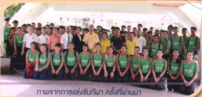
ภาพจากการแข่งขันกีฬา ครั้งที่ผ่านมา