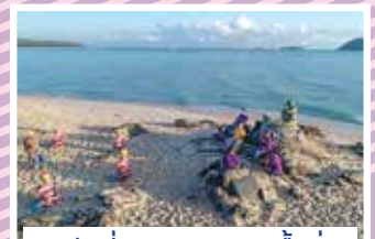
รางวัลที่ ๓ “อารยธรรมพื้นถิ่น”