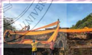
รางวัลชมเชย “ห่มผ้าพระธาตุเจดีย์เขาน้อย”