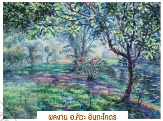
ผลงาน อ.ศิวะ อินทะโคตร