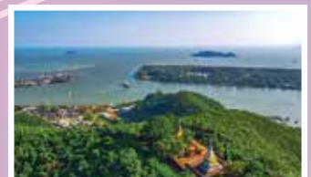
รางวัลชมเชย “สองศาล”

และด้านบริหารที่เกี่ยวกับหน่วยอนุรักษ์สิ่งแวดล้อมธรรมชาติและศิลปกรรมท้องถิ่น จึงต้องการข้อมูลมาไว้ในฐานข้อมูลแหล่งศิลปกรรมอันควรอนุรักษ์ของสำนักงานนโยบายและแผนทรัพยากรธรรมชาติและสิ่งแวดล้อม ที่ไม่ใช่แค่เพียงในมุมมองของเรา แต่อยากได้การมีส่วนร่วมจากประชาชนผ่านมุมมองของหลังเลนส์