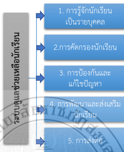
ภาพ 3 กระบวนการบริหารงานระบบดูแลช่วยเหลือนักเรียน