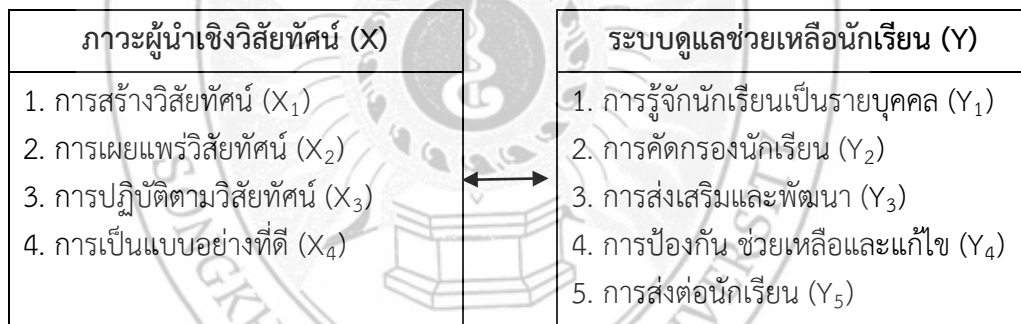
ภาพ 1 กรอบแนวคิดการวิจัย

การวิจัยครั้งนี้นำเสนอเป็นองค์ประกอบของตัวแปรที่ใช้ในการวิจัย ดังภาพ 1 กรอบแนวคิดการวิจัย