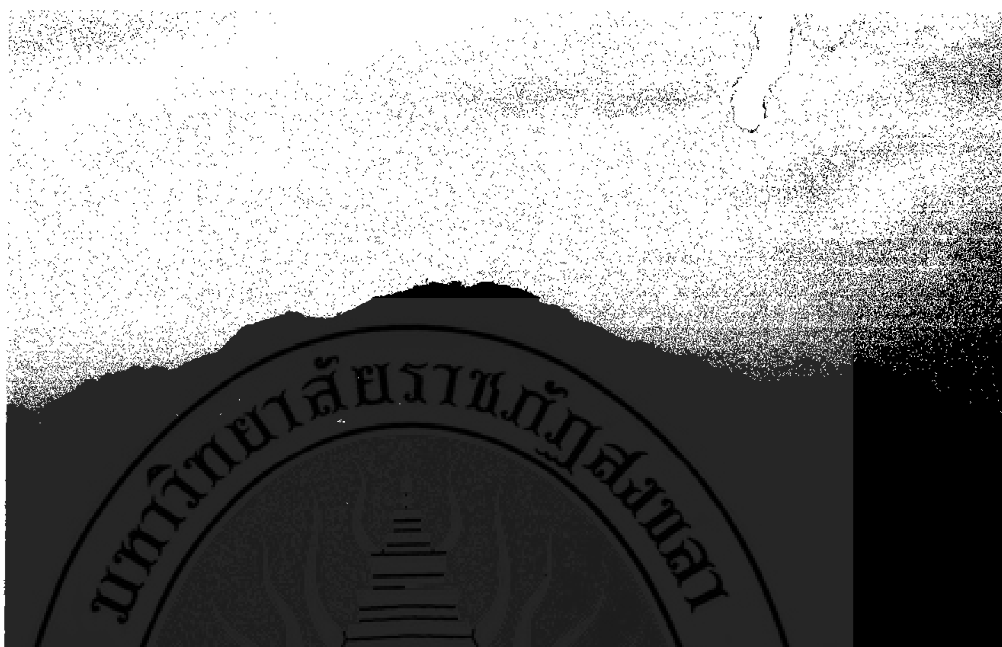
ภาพที่ 3.1 ภาพเกาะกระดานทิศเหนือ