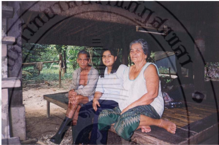
ภาพที่ 8 ลูกขวัญ ผู้วิจัย และภรรยาลูกขวัญ

ที่กล่าวข้างต้น แสดงให้เห็นว่าการเดินทางเข้าไปอยู่ในพื้นที่ระยะเริ่มแรกนั้น เต็มไปด้วย ความยากลำบาก ดังคำให้สัมภาษณ์ของผู้ให้ข้อมูลหลักข้างต้น “สมัยนั้นลำบากแสนสาหัส ลูกเอ๊ย ไปไหนก็เดินกันอย่างเดียว ลำบากจนไม่รู้จะพูดอย่างไร สมัยนี้ดีกว่าเดิมมาก ไม่เคยคิดว่าจะมีไฟฟ้าเข้ามาถึง ถนนลาดยางมะตอยตัดเข้ามาถึง ตอนนั้นคิดว่าไม่มี ‘ไอ้คนเหลือเดน’ คนไหนเข้ามาอาศัยอยู่ได้อีกแล้ว”