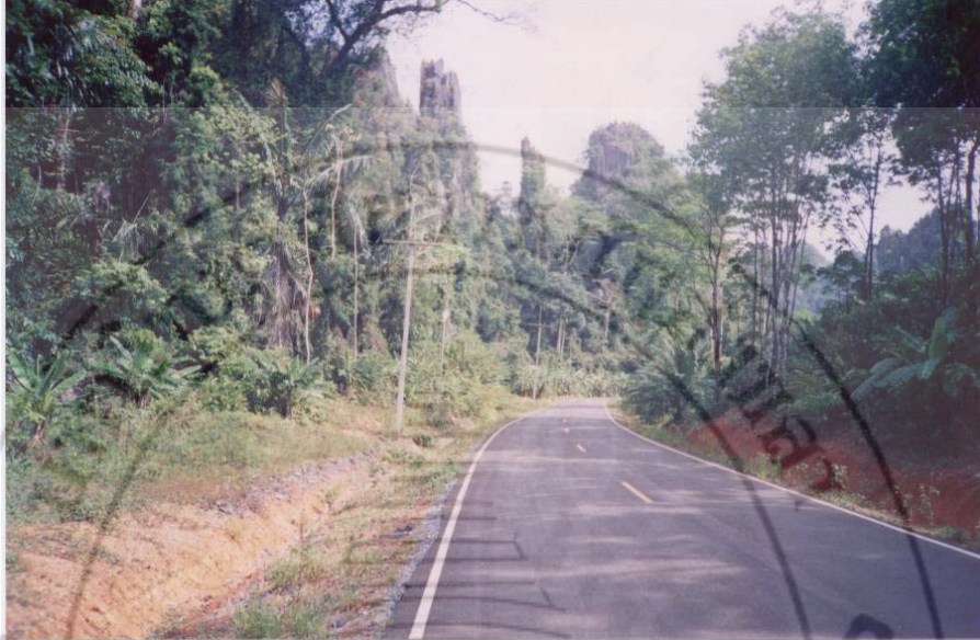
ภาพที่ 9 ถนนสายมะนัง-บ้านป่าพน เส้นทางไปถ้ำภูผาเพชรในปัจจุบัน (ถ่ายภาพโดย นายเฉลิมเกียรติ ขุนทองเพชร วันที่ 23 มีนาคม 2547)

อุดมสมบูรณ์ของพื้นที่ป่า ทำให้การอพยพจากบุคคลภายนอกมีมากขึ้น โดยการชักชวนเครือญาติของผู้ที่อาศัยอยู่เดิม