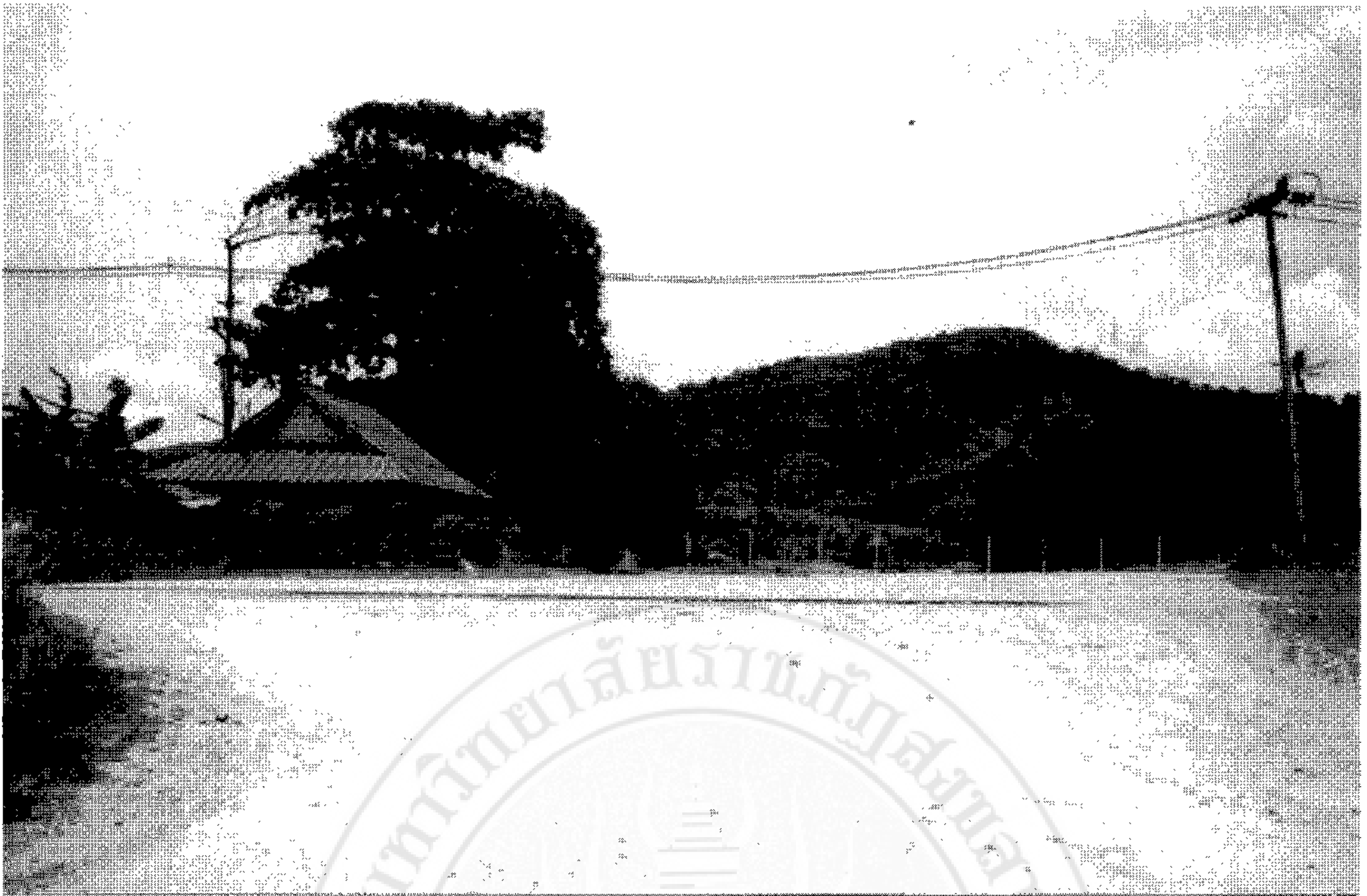
ภาพที่ 2.2 ที่ตั้งหน่วยตรวจการณบนเขารูปช้างในช่วงสงครามโลกครั้งที่ 2 อำเภอเมือง จังหวัดสงขลา เป็นจุดสั่งการให้ทหารปืนใหญ่เล็งวิถีกระสุนทำลายเรือรบญี่ปุ่น นับเป็นชัยภูมิที่เหมาะสม เพราะสามารถมองเห็นเรือรบของข้าศึกที่จอดเรียงรายตามชายฝั่งได้ชัดเจน

4.2 การเลือกผู้ที่ทำหน้าที่สัมภาษณ์ ควรเป็นคนชุดเดียวกันและควรมีคุณสมบัติพิเศษมีความรับผิดชอบ อดทน ตรงต่อเวลา รู้จักตั้งคำถาม มีความสามารถในการจับประเด็น มีบุคลิกภาพที่เป็นมิตร และที่สำคัญ คือ จะต้องมีความเชื่อมั่นว่า วิธีการประวัติศาสตร์จากการบอกเล่า จะเป็นเครื่องมือการวิจัยทางประวัติศาสตร์ที่จะนำมาซึ่งข้อมูลที่เชื่อถือได้และเป็นจริง