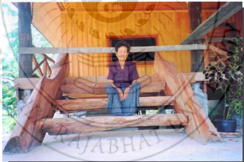
ภรรยาผู้มีบทบาทในการสร้างโรงเรียน