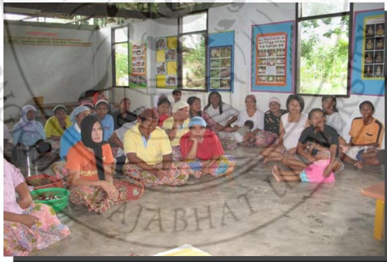
ประชุมผู้ปกครอง