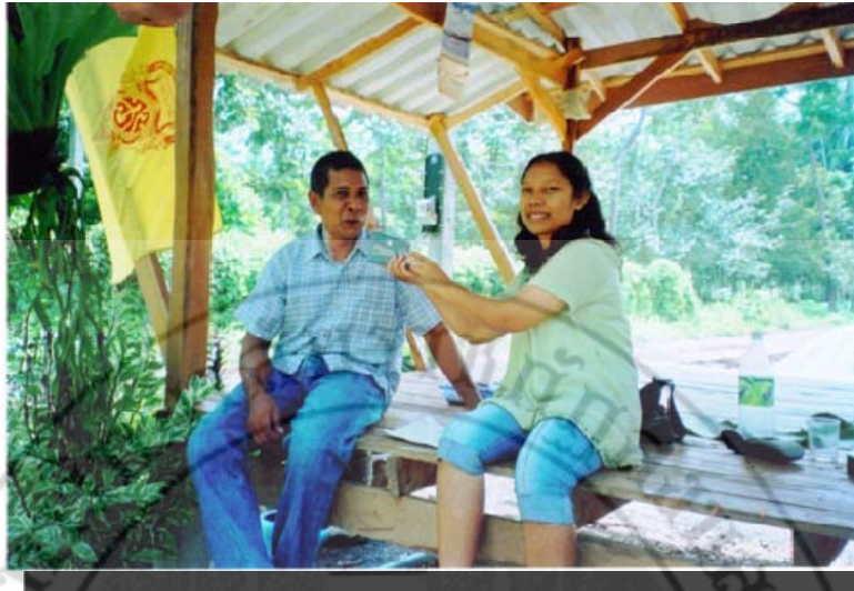
สัมภาษณ์คณะกรรมการสถานศึกษา