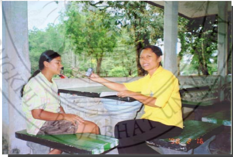
สัมภาษณ์ผู้ปกครอง