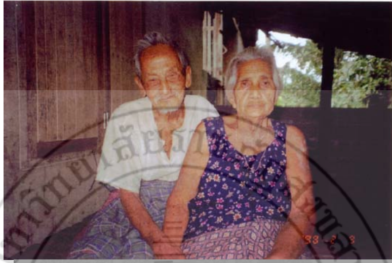
ผู้บริจาคที่ดินให้กับโรงเรียน