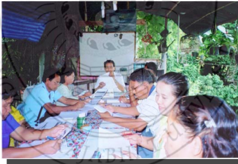
การจัดกลุ่มสนทนา