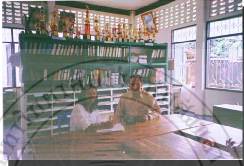
สัมภาษณ์ผู้บริหารสถานศึกษา