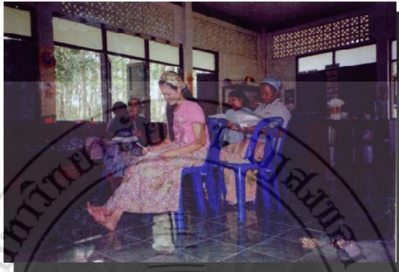
การจัดกลุ่มสนทนา