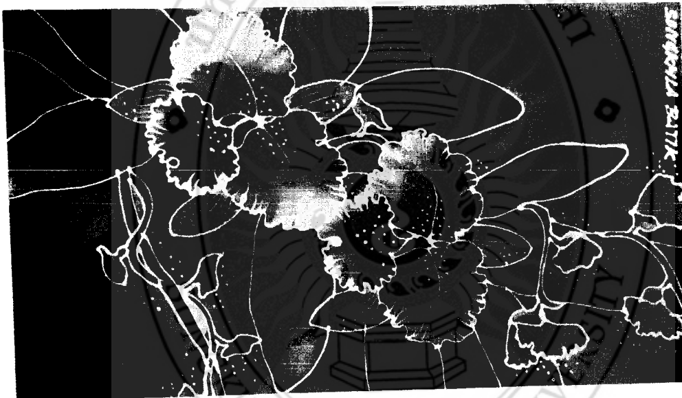
ภาพที่ 63 ลักษณะของรูปแบบลวดลายดอกกล้วยไม้ของจังหวัดสงขลา

1. จังหวัดสงขลา ลักษณะเด่นของรูปแบบลวดลายที่ปรากฏคือดอกไม้ที่นิยมเขียน ได้แก่ ดอกกล้วยไม้ ดอกกุหลาบ ดอกโป๊ยเซียนและดอกชบา เรียงตามลำดับ รองลงมาคือรูปแบบลวดลายทิวทัศน์ป่าเขา-ฮาลา น้ำตก ภูเขา ต้นไม้และปลาใต้ท้องทะเล เป็นต้น