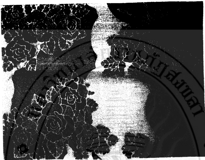
ภาพที่ 64 ลักษณะของรูปแบบลวดลายดอกกุหลาบของจังหวัดสตูล

2. จังหวัดสตูล ลักษณะเด่นของรูปแบบลวดลายที่ปรากฏ คือ ดอกไม้ที่นิยมเขียน ได้แก่ ดอกกล้วยไม้ ดอกกุหลาบ ดอกชบาและดอกกาหลง เรียงตามลำดับ รองลงมาคือ รูปแบบลวดลาย สัตว์ปีก ได้แก่ ผีเสื้อ นก เป็นต้น