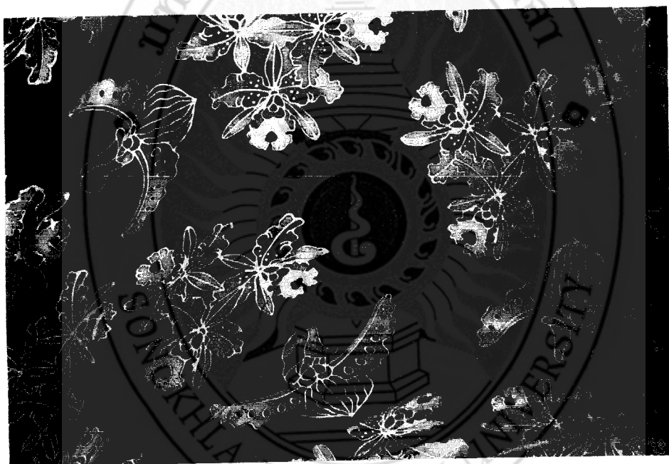
ภาพที่ 67 ลักษณะของรูปแบบลวดลายดอกกล้วยไม้ของจังหวัดนราธิวาส

5. จังหวัดนราธิวาส ลักษณะเด่นของรูปแบบลวดลายที่ปรากฏ คือ ดอกไม้ ที่นิยมเขียนได้แก่ดอกกล้วยไม้ ดอกชบา ดอกกุหลาบ ดอกบานบุรี และดอกเฟื่องฟ้า เรียงตามลำดับ รองลงมาคือรูปแบบลวดลายทิวทัศน์อ่าวมะนาว ภูเขา ต้นไม้และทุ่งหญ้า รวมทั้งรูปและลวดลายเรือกอและที่เป็นสัญลักษณ์ประจำจังหวัด