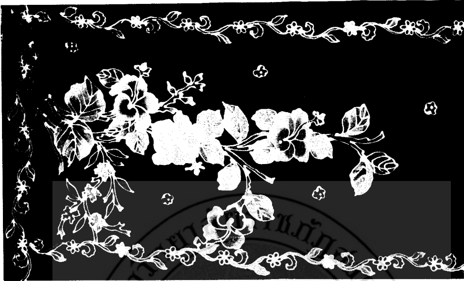
ภาพที่ 65 ลักษณะของรูปแบบลวดลายดอกชบาของจังหวัดปัตตานี

จากรูปแบบจะเห็นว่าเป็นการเขียนในลักษณะของลายเส้นด้วยน้ำเขียนสีขาว ถ่ายทอดลักษณะและโครงสร้างของดอก ก้านดอก และใบ โดดเด่นถึงความเป็นจริงตามธรรมชาติโดยการจัดวางช่อดอก ก้านดอก และใบตามลักษณะรูปและพื้นบนฐานของการจัดองค์ประกอบเรื่องการจัดวางลงสีตามจินตนาการของผู้เขียนเอง แยกให้เห็นโทนสีต่าง ๆ ที่มีน้ำหนักอ่อนแก่แต่แต่ละดอกและใบในลักษณะของสีเอกรงค์ แล้วลงสีพื้นแบบเรียบให้เกิดความแตกต่างของรูปและพื้นบนตัวลวดลาย