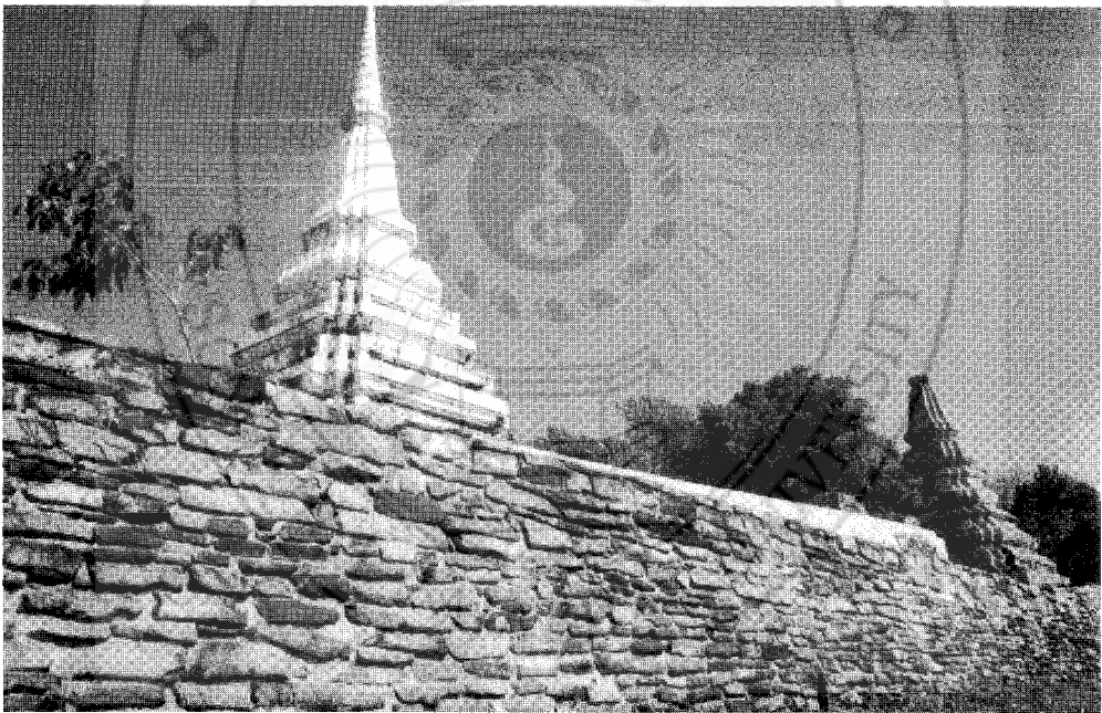
เจดีย์สองพี่น้อง บนเขาแดง อำเภอสิงหนคร จังหวัดสงขลา สร้างในสมัยรัชกาลที่ 3

ผมเคยบรรยายไว้เมื่อเดือนที่แล้วที่ผมมาว่า สมัยรัชกาลที่ 3 เมื่อตอนไทรบุรี ปัตตานี แข็งเมือง ไม่ยอมส่งดอกไม้เงินดอกไม้ทอง แล้วก้าวร้าวยกทัพมาตีเมืองสงขลา สงขลาไม่มีสมรภูมิที่สงขลารบกับปัตตานีอยู่ตั้งนาน วันนั้นได้ใหม่ว่าสมรภูมิที่ตายกันตั้งเยอะอยู่ที่ไหน ซึ่งไม่ได้ถ้าสนใจ ขวนขวายจริง ๆ มันต้องหาได้ แล้วสร้างเรื่องเป็นแหล่งท่องเที่ยว แล้วมันอาจจะทำอะไรได้เยอะที่มันมีเงินมีทองเข้ามา รัชกาลที่ 3 ส่งขุนนางสองพี่น้องเข้ามาลงมาเป็นพระยาทั้งคู่ มาอยู่ที่นี้ 3 เดือนปราบกบฏสู้กับข้าศึกจบเรียบร้อยชนะ ท่านก็สร้างเจดีย์ขึ้นบนหัวเขาแดง คนที่สร้างองค์คนน้องสร้างองค์เป็นอนุสรณ์เจดีย์ดำ เจดีย์ขาวมาจนทุกวันนี้ เจดีย์ยังอยู่จนเดี๋ยวนี้ แต่คนสงขลาลืมไปแล้วว่าเจดีย์อะไร สร้างทำไมและใครสร้าง