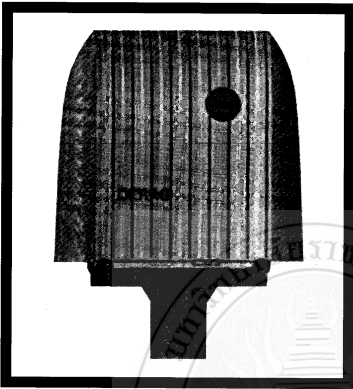
ภาพมุมมองของ Sleep & Go ของ เบอกิสสัน

ในช่วงเวลาแห่งอดีต แม้จะมีความขัดแย้งรุนแรงเกิดขึ้น แต่ประชาชาติสแกนดิเนเวียยังคงความสุขสันติได้ยาวนานเกือบ 200 ปี มีประวัติศาสตร์ที่คลุกเคล้าไปกับเทพนิยาย สร้างความบันเทิงใจให้กับผู้คน ที่อาศัยด้วยสภาพที่สมบูรณ์ของธรรมชาติ จึงทำให้คนสแกนดิเนเวียมีสภาพทั่วไปที่ไม่ต่างกันมากนักในทางเชื้อชาติ ศาสนา และมีระบบกฎหมายมาจากพื้นฐานปรัชญาเดียวกัน