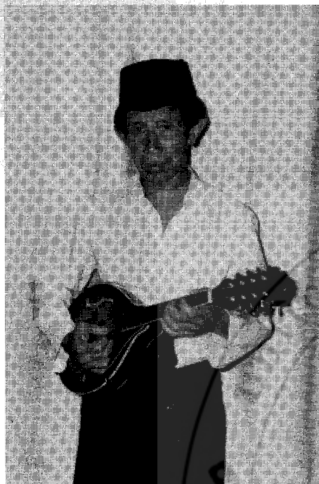
แมนโดลิน