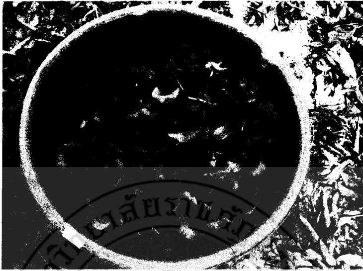
ภาพที่ 4 แสดงลักษณะการเลี้ยงผักตบชวา