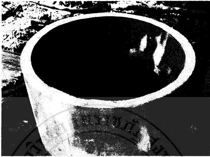
ภาพที่ 3 ชุดควบคุม