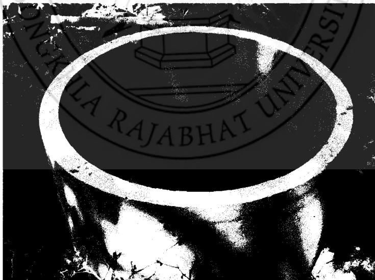
ภาพที่ 2 ชุดทดลองที่ใช้ไขอก