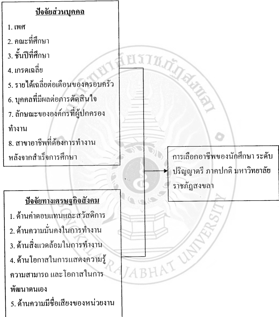
ภาพ 2 กรอบแนวคิดในการวิจัย

เพื่อให้เกิดความเข้าใจที่ชัดเจน ผู้วิจัยจึงกำหนดกรอบแนวคิดไว้ดังนี้