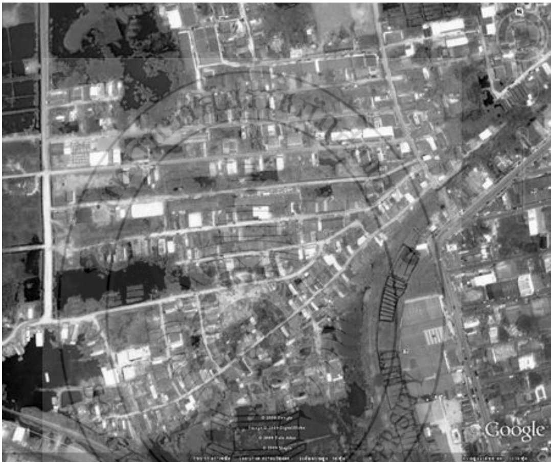
ภาพที่ 4 ความหนาแน่นของการตั้งบ้านเรือนในชุมชนบ้านท่าไทร

พงศกร บอกว่าตั้งแต่ปี พ.ศ. 2528 จนถึงปี พ.ศ. 2540 ตัวเองได้รับแต่งตั้งจากกำนันและผู้ใหญ่บ้าน ให้เป็นตัวแทนในการติดต่อประสานงาน กับกลุ่มชุมชนเดิมที่อาศัยอยู่ในพื้นที่มาโดยตลอด และตัวเอง มีความสัมพันธ์อันดีกับกลุ่มชุมชนเดิมมาโดยตลอด