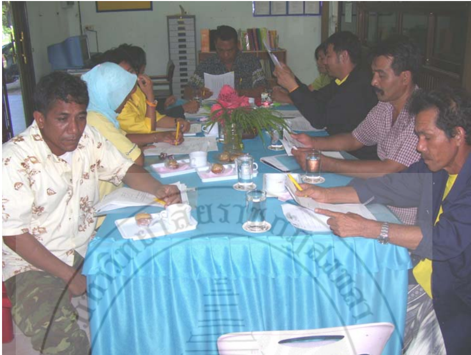
ประชุมคณะกรรมการสถานศึกษาขั้นพื้นฐาน