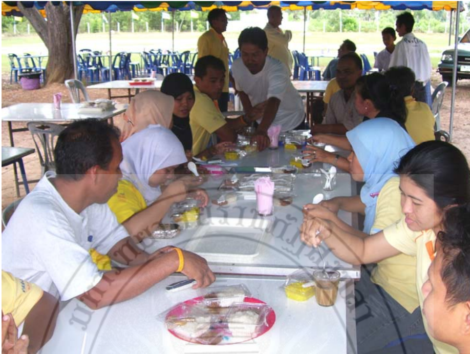
จัดหาทุนพัฒนาโรงเรียน