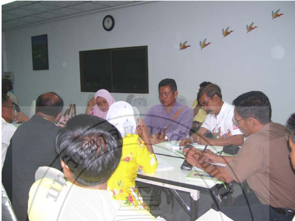
การมีส่วนร่วมของชุมชน