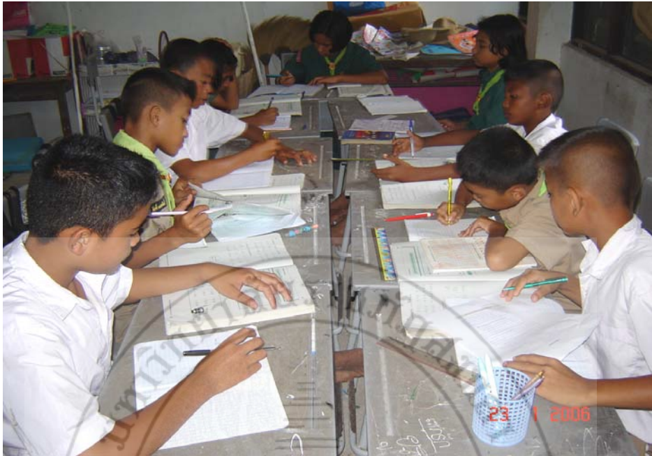
ระเบียบวินัยในการเรียน