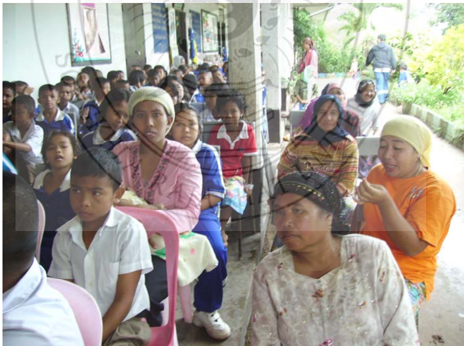
ประชุมผู้ปกครอง