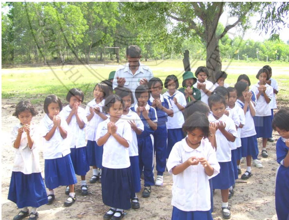
ระเบียบวินัยในการทำพิธีทางศาสนา