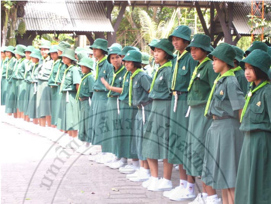
กิจกรรมลูกเสือ-เนตรนารี