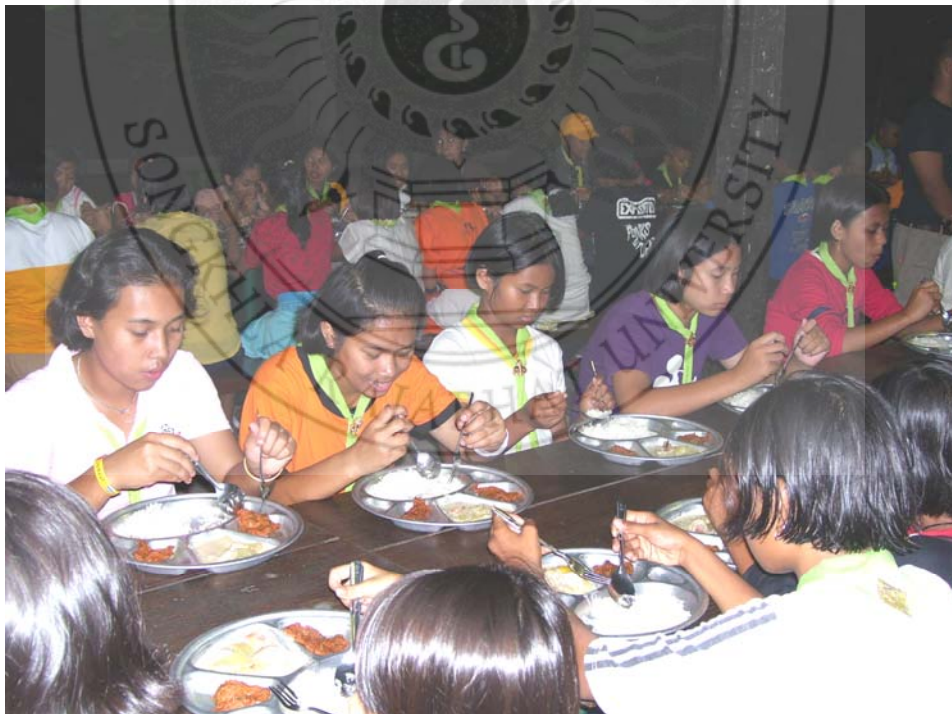
ระเบียบวินัยในการรับประทานอาหาร