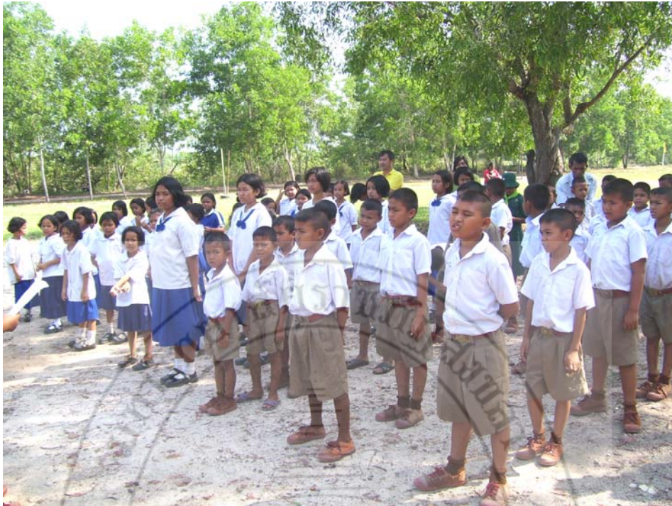
ระเบียบวินัยในการเข้าแถว