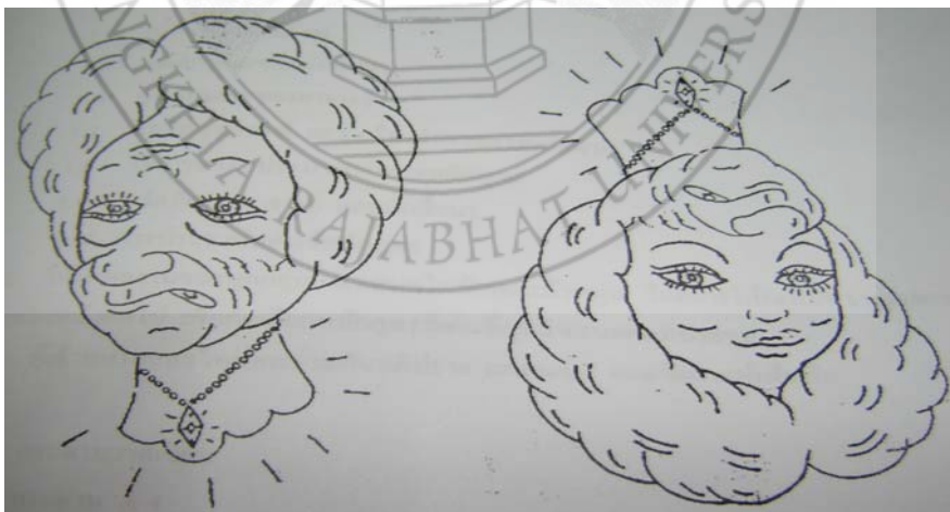
ผู้ที่ไม่รู้จักให้อภัย