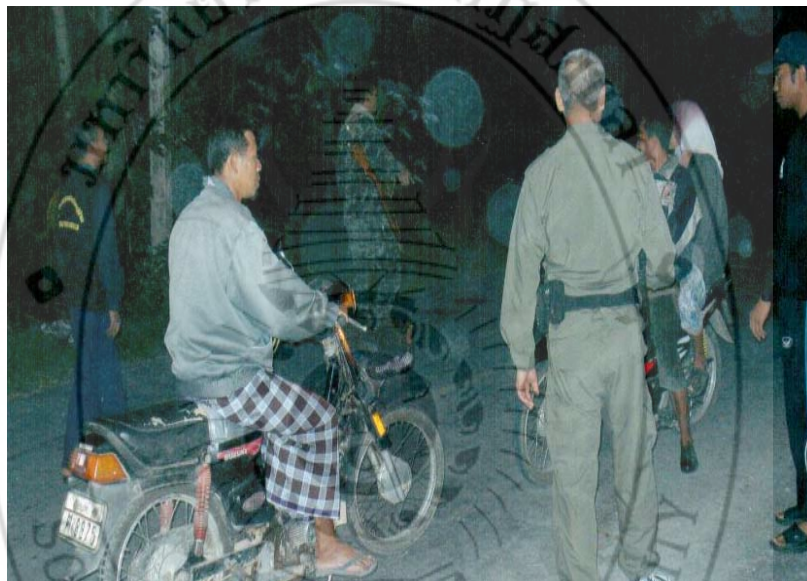
ภาพ 15 สนธิกำลัง

เป็นแนวทางปฏิบัติที่สำคัญ เนื่องจากในการปฏิบัติการรักษาความปลอดภัยนั้นจำเป็นต้องมีขั้นตอนของการตรวจค้นทั้งในส่วนของบุคคล ยานพาหนะ หรือสถานที่ ซึ่งชุดรักษาความปลอดภัยหมู่บ้านในฐานะผู้ช่วยเจ้าพนักงานตามประมวลกฎหมายวิธีพิจารณาความอาญาจะปฏิบัติการเพียงลำพังไม่ได้ จำเป็นต้องอาศัยทหาร ตำรวจ และเจ้าหน้าที่ฝ่ายปกครองเป็นที่เล็งในการปฏิบัติงาน เนื่องจากไม่มีอำนาจในการตรวจค้น และการจับกุมโดยพลการตามกฎหมาย จึงจำเป็นต้องปฏิบัติหน้าที่ภายใต้การรอบของผู้ช่วยเจ้าพนักงานตามประมวลกฎหมายวิธีพิจารณาความอาญา