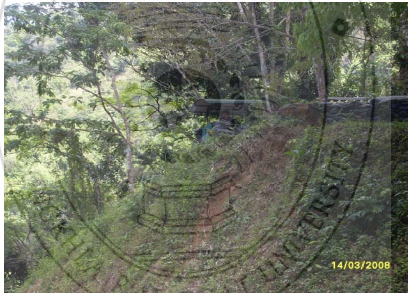
ภาพ 9 พื้นที่ในการรักษาความปลอดภัย “จุดสูงข่ม”

“...เดิมฐานที่ตั้งเคยอยู่ที่ต่ำ แต่ต่อมาเมื่อ 17 ธันวาคม 2549 มีคนร้ายได้เข้ามาลอบวางเพลิงและยิงปืนทำร้ายชาวบ้าน ในการปฏิบัติการครั้งนั้นคนร้ายสามารถเข้ามาในพื้นที่ และสามารถปฏิบัติการทำร้ายชาวบ้าน โดยจุดตรวจที่ชาวบ้านตั้งไว้เดิมอยู่บริเวณระดับเดียวกับถนน แต่หลังจากนั้นได้มีการจัดทำสุมกปากัดและมีมติให้เลื่อนตำแหน่งจุดตรวจการไปไว้ที่สูง เพราะทำให้สามารถมองเห็นได้กว้าง จึงทำให้มีศักยภาพหรือที่ภาษาชาวบ้านเรียกว่า “สูงข่ม” นั่นเอง...”