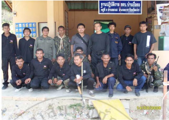
ภาพ 11 ชุดรักษาความปลอดภัยชุมชน