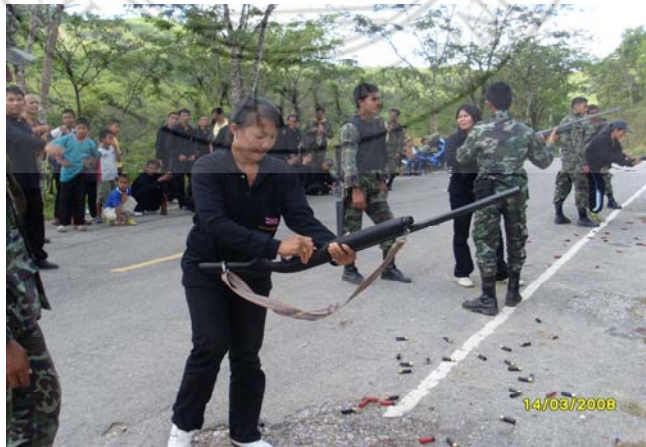
ภาพ 12 อาวุธประจำกาย