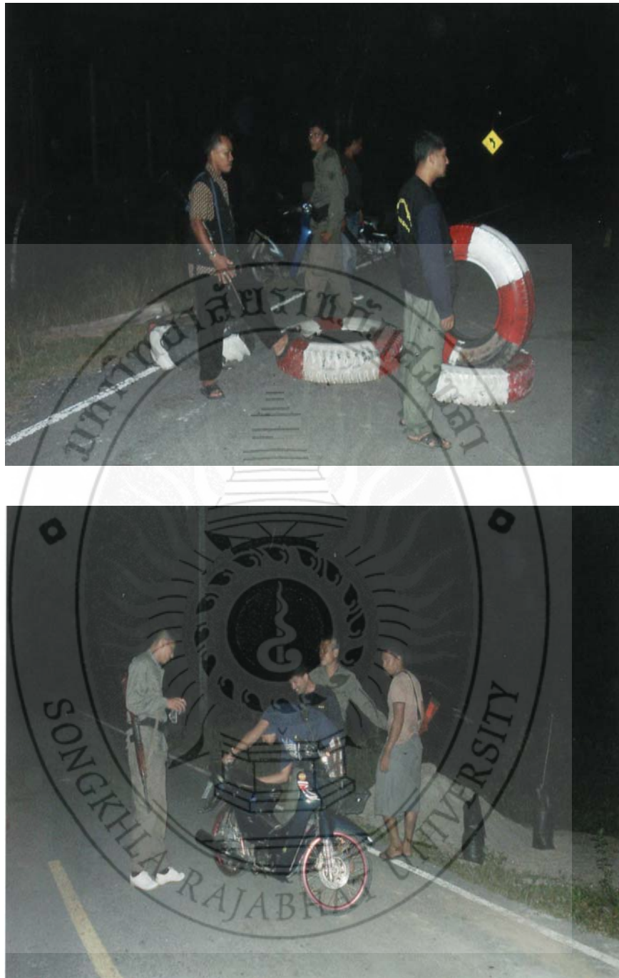
ภาพ 14 การตรวจตราผู้คนเข้า-ออกในชุมชน