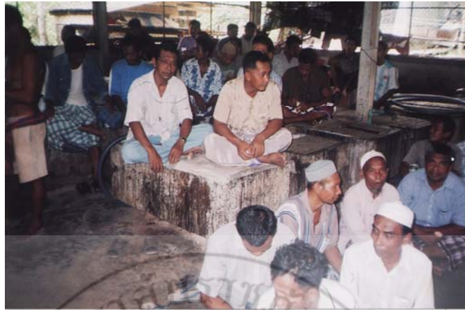
ภาพ 5 ขั้นตอนการร่วมกันเลือกพื้นที่การรักษาความปลอดภัย