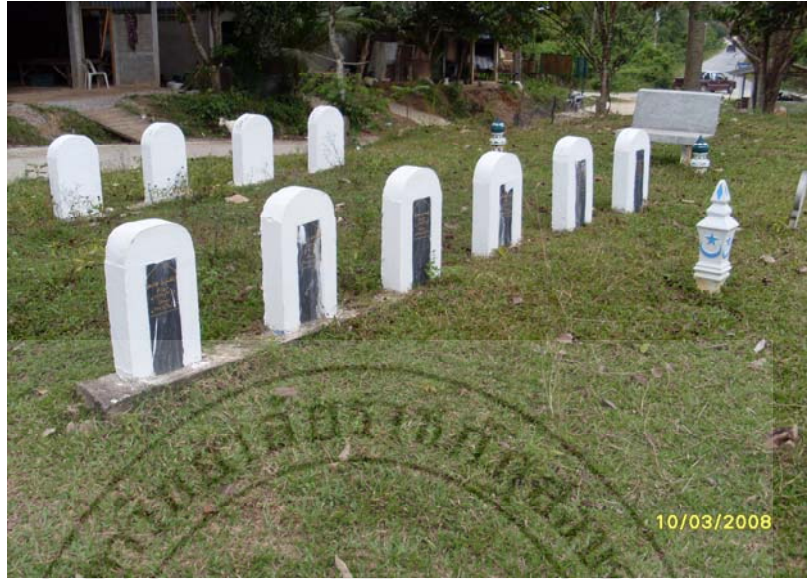
ภาพ 16 ฎโบซึ่งฝังศพของเด็กวัยรุ่นในชุมชนที่เสียชีวิตเมื่อวันที่ 28 เมษายน 2547