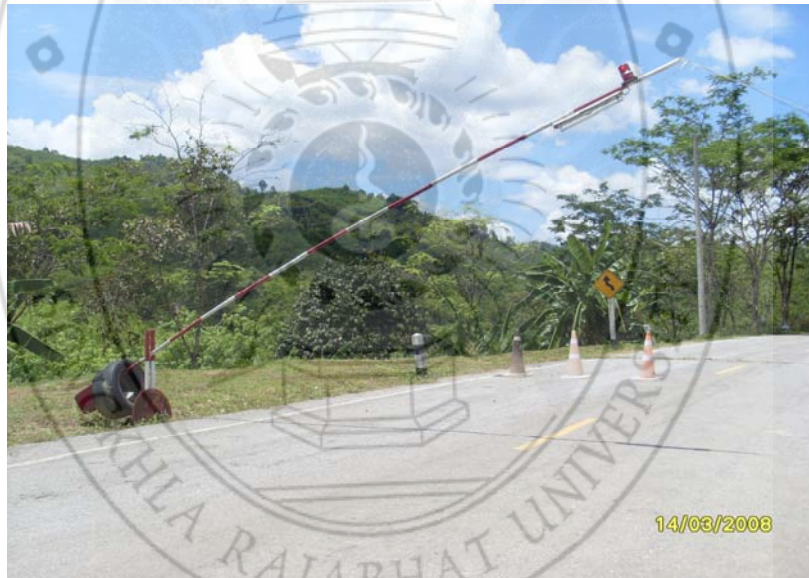
ภาพ 8 สิ่งกีดขวางในการรักษาความปลอดภัยของชุมชน