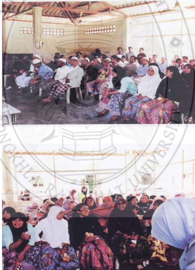
ภาพ 3 กิจกรรมการดำเนินงานประชุมประชาคม เพื่อจัดตั้งกฎกติกาหมู่บ้าน (สุกมปากัต) หมู่บ้านนำร่อง

ซึ่งในทุกขั้นตอนจะต้องผ่านการยอมรับของชุมชน โดยข้อตกลงร่วมกันของคนในชุมชนก็คือพลังของชุมชนนั่นเอง