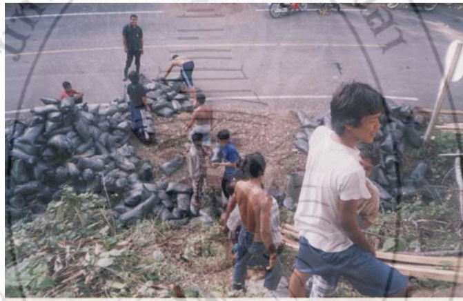
ภาพ 7 การตั้งจุดตรวจชุมชน เพื่อเป็นจุดรักษาความปลอดภัยของชุมชน