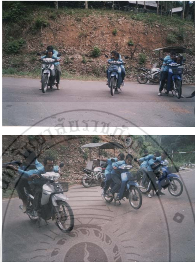
ภาพ 4 การฝึกอบรมการรักษาความปลอดภัย