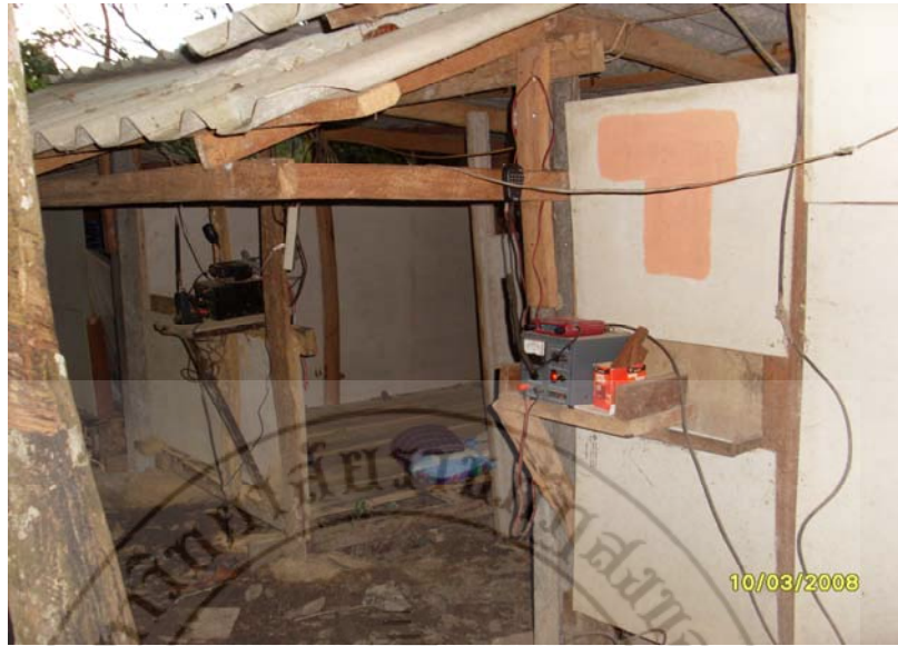
ภาพ 10 จุดที่วางวิทยุสื่อสาร