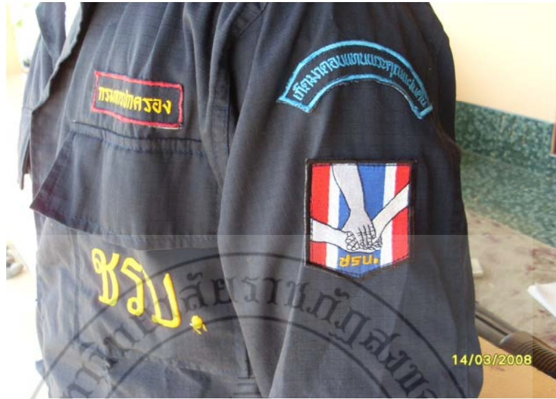
ภาพ 13 เครื่องแบบชุดปฏิบัติการ