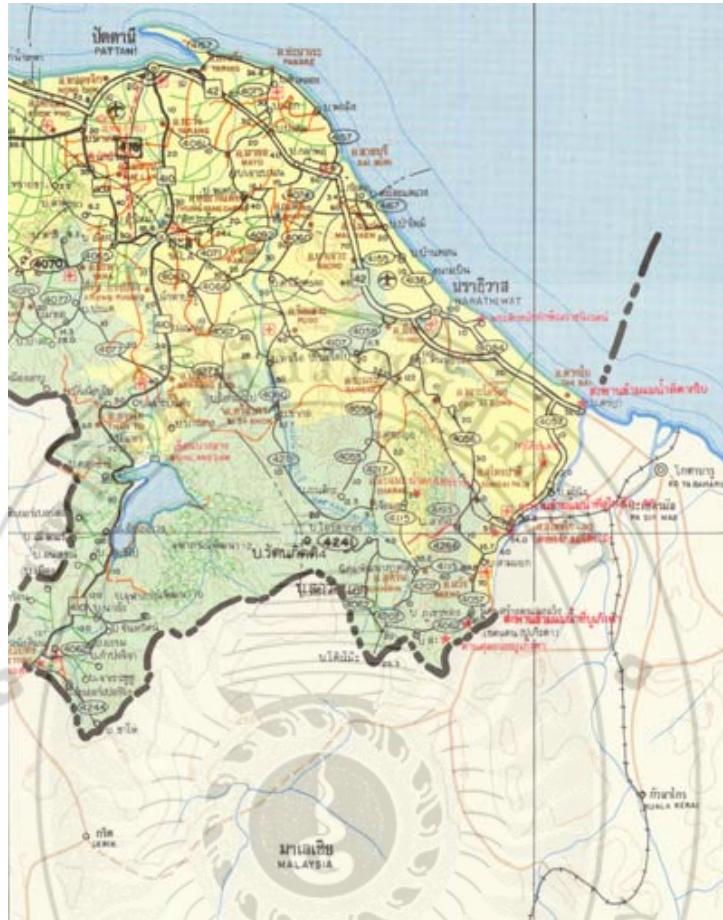
ภาพ 2 แผนที่ 3 จังหวัดชายแดนภาคใต้