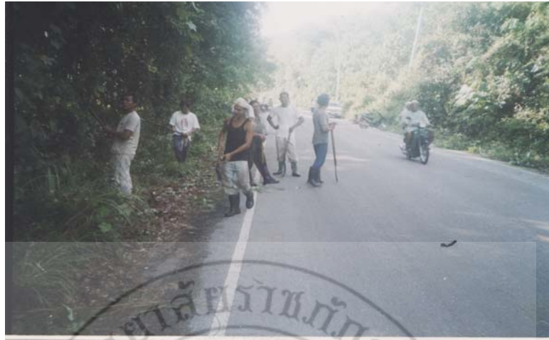
ภาพ 17 กิจกรรมพัฒนาภายในชุมชน