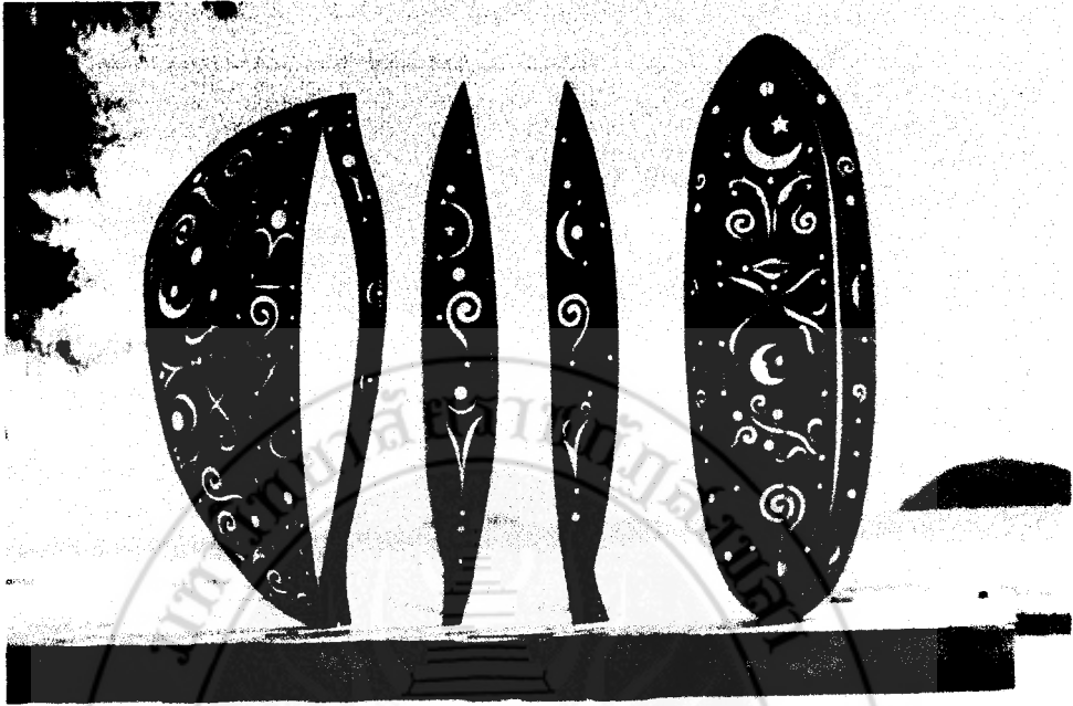
ภาพที่ 38 พิชพรณ : สัญลักษณ์แห่งชีวิต เชื่อมเหล็ก 2 x 7 x 4 เมตร (วิโชค มุกดามณี, 2548)

กล่าวโดยสรุปได้ว่า การสร้างสรรค์ผลงานแต่ละช่วงแต่ละยุค ศิลปินสามารถที่จะสะท้อนความเป็นศิลปะสมัยใหม่ (Modern Art) ตามยุคสมัยของโลกศิลปะได้เป็นอย่างดีภายใต้กรอบของความเชื่อและกลวิธีแตกต่างกันไปตามยุคสมัย และมีขนาดใหญ่กว่าของจริง