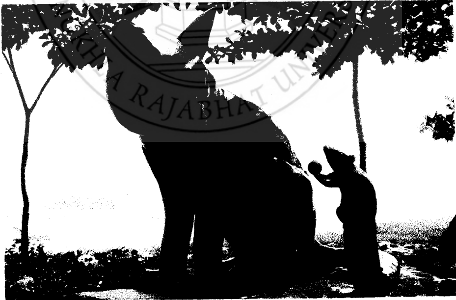
ภาพที่ 36 หนุ – แมว หล่อทองเหลืองรมดำ 1.20 x 2.50 x 0.80 เมตร (มนตรี สังข์มุสิกานนท์, 2543)

ยุคที่สอง “หนุ – แมว” หล่อทองเหลืองรมดำ สร้างขึ้นเมื่อปี พ.ศ. 2543 มีรูปแบบจินตนาการเหนือจริง (Idealistic) ศิลปินยังคงสร้างตามเนื้อหาเรื่องราว (Subject Matter) ที่เป็นตำนานเรื่องเล่าสืบต่อกันมา โดยมีรูปแบบผลงานตามแบบอย่างศิลปะเหนือจริง (Surrealism Art) และมีขนาดใหญ่โตกว่าของจริงมาก