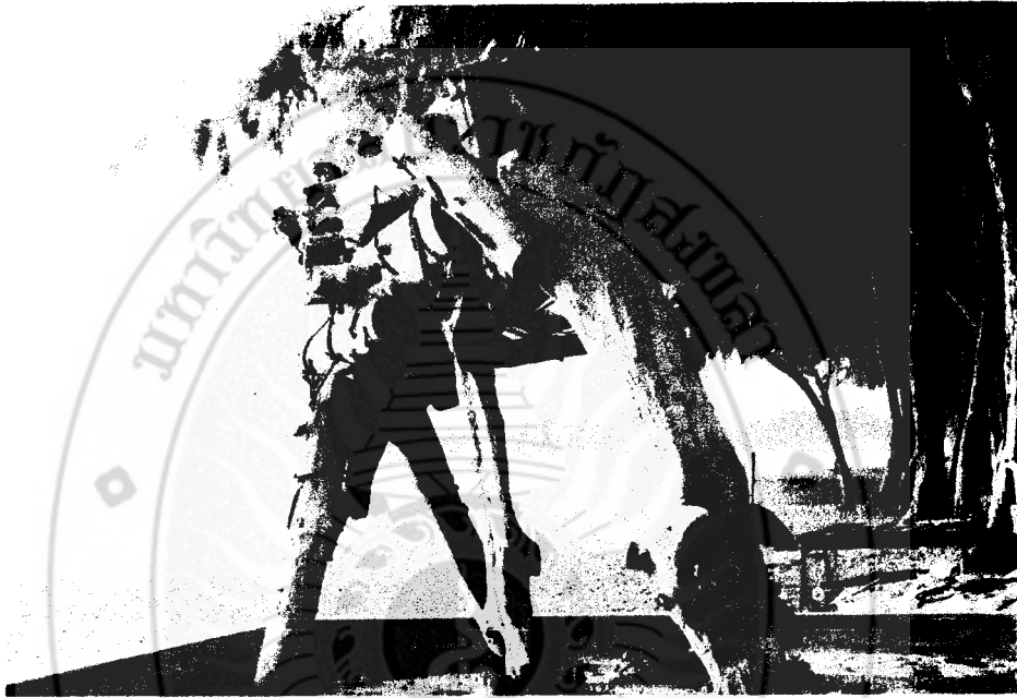
ภาพที่ 37 ม้าไม้ ท่อนไม้ปะติด 1 x 2 x 2 เมตร

ยุคที่สาม “ม้าไม้” ท่อนไม้ปะติด สร้างขึ้นเมื่อปี พ.ศ.2548 มีรูปแบบกึ่งนามธรรม (Semi – Abstract) สร้างตามเนื้อหาเรื่องราว (Subject Matter) ที่เป็นส่วนหนึ่งของวิถีชีวิตชุมชนในพื้นที่แวดล้อม (แหลมสมิหลา) และมีรูปแบบผลงานตามแบบอย่างศิลปะกึ่งนามธรรม (Semi – Abstract) โดยมีขนาดใหญ่กว่าของจริง