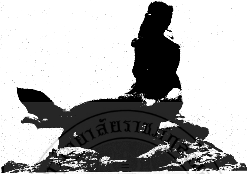
ภาพที่ 35 หนุ-แมว หล่อทองเหลืองรมดำ 1 \frac{1}{2} เท่าคนจริง (จิตร บัวนุศย์, 2509)

ยุคที่สอง “หนุ – แมว” หล่อทองเหลืองรมดำ สร้างขึ้นเมื่อปี พ.ศ. 2543 มีรูปแบบจินตนาการเหนือจริง (Idealistic) ศิลปินยังคงสร้างตามเนื้อหาเรื่องราว (Subject Matter) ที่เป็นตำนานเรื่องเล่าสืบต่อกันมา โดยมีรูปแบบผลงานตามแบบอย่างศิลปะเหนือจริง (Surrealism Art) และมีขนาดใหญ่โตกว่าของจริงมาก