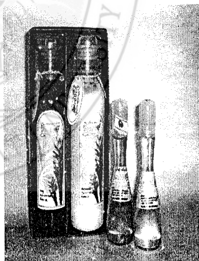
ผลิตภัณฑ์ที่เปลี่ยนฉลากและบรรจุภัณฑ์แล้ว