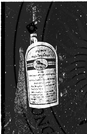
ภาพที่ 4 รูปแบบฉลากและบรรจุภัณฑ์สินค้าเครื่องสำอางสมุนไพร (ก่อนการพัฒนา)

ในการบรรยายเกี่ยวกับการออกแบบบรรจุภัณฑ์ครั้งนี้ได้แนวคิดในการพัฒนาผลิตภัณฑ์เครื่องสำอางสมุนไพรทั้งในรูปแบบฉลากและบรรจุภัณฑ์ โดยเลือกผลิตภัณฑ์ที่ได้รับความนิยมมากที่สุด ได้แก่ แชมพูสมุนไพร ครีมนวดผมสมุนไพรและสินค้าตัวใหม่ที่ต้องการเปิดตลาด ได้แก่ น้ำมันนวดสปา น้ำมันมะพร้าวบริสุทธิ์ สำหรับการออกแบบฉลากนั้นได้มีการออกแบบที่สอดคล้องกับบรรจุภัณฑ์ รวมทั้งมีการสร้างมูลค่าเพิ่มให้กับผลิตภัณฑ์โดยการทำบรรจุภัณฑ์เป็นแพ็คเกจสำหรับสินค้าที่เป็นแชมพูและครีมนวดผมสมุนไพร โดยมีจุดประสงค์เป็นสินค้าของฝากในช่วงเทศกาลกระแสรักสุขภาพ