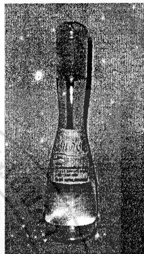
น้ำมันมะพร้าวบริสุทธิ์