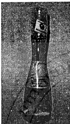
น้ำมันนวดสปา