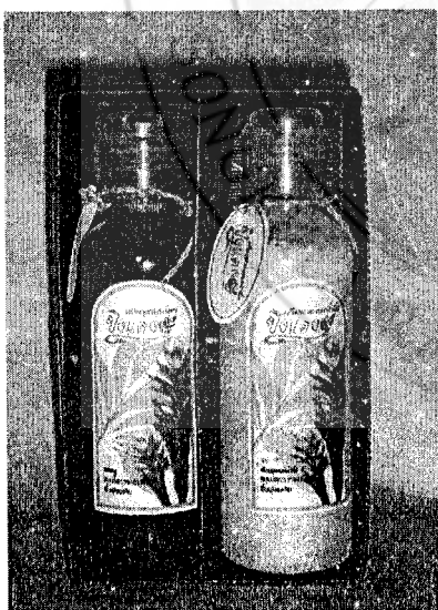
ครีมนวดและแชมพูสมุนไพรแพ็คเกจ