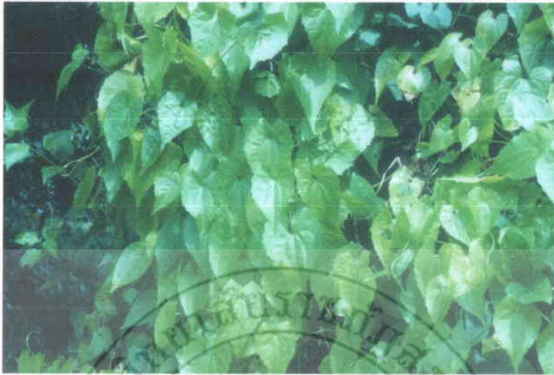
5. จีไต้ย่าน Mikania cordata (Burm.f.) B.L. Robins.