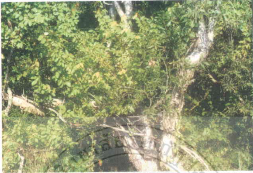
13. แฟบ Hymenocardia sp. (ขึ้นอยู่ติดกับต้นเสม็ดขาว)