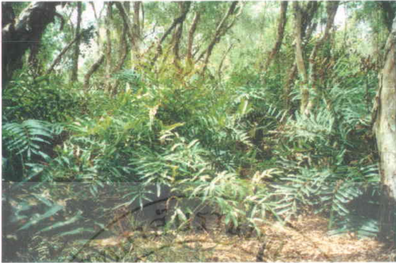
25. ปรงทะเล Acrostichum aureum Linn.