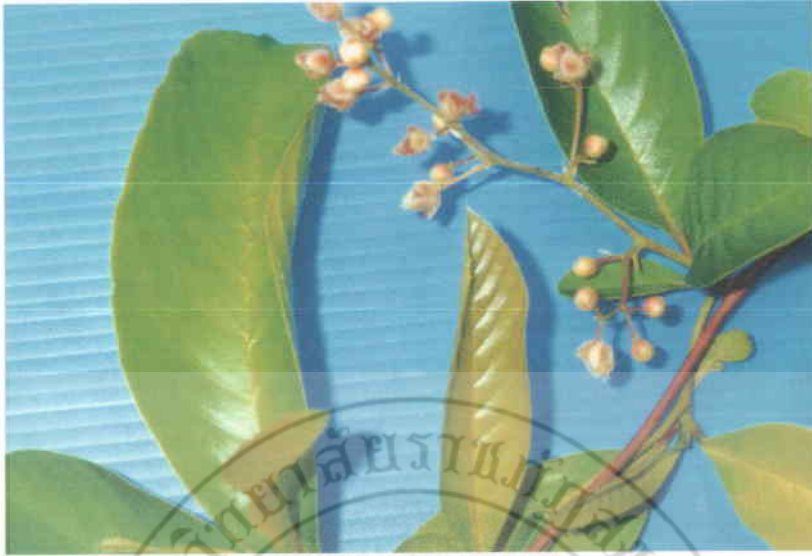
11. รตศุนธุ์ Tetracera loureiri (Fin & Gagnep) Craib.