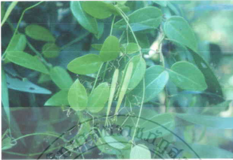
3. จมูกปลาหลด Tylophora tenuis Bl.