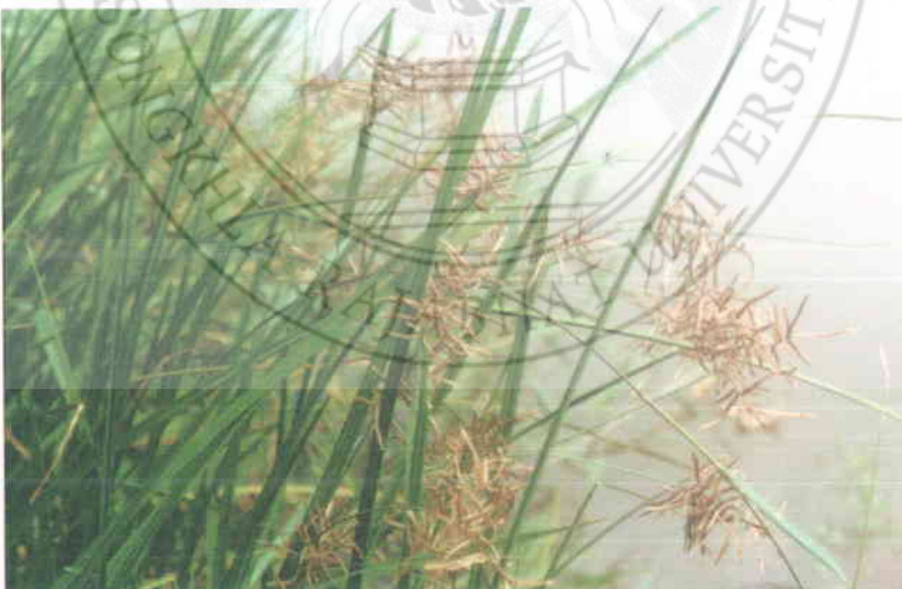
10. หญาตะกรั้บ Cyperus procerus Rottb.