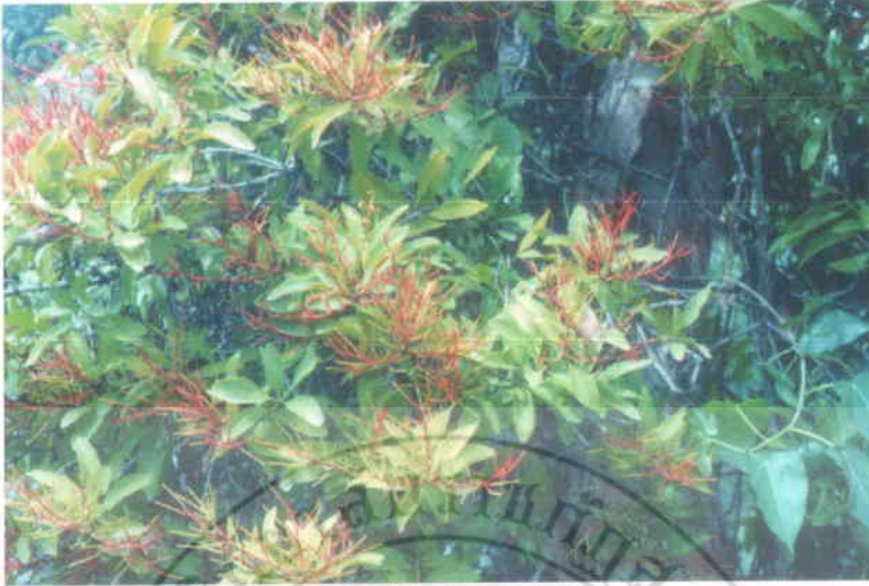
19. กาฝากเสม็ด Helixanthera cylindrica (Jack.) Dans.