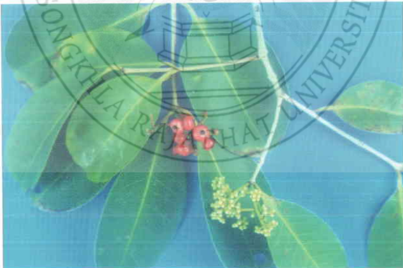
20. หว่านา Eugenia pseudosubtilis King.