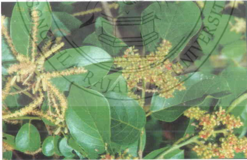
12. เม่า Antidesma ghaesembilla Gaertn.