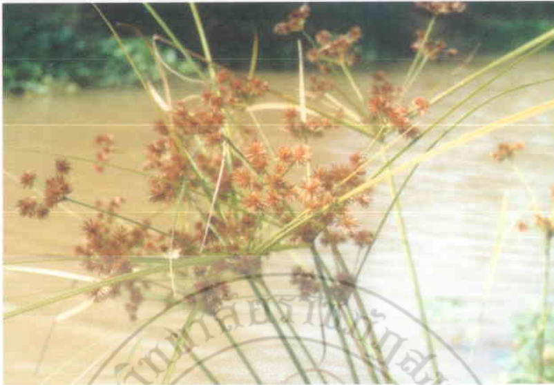
9. หญาไ้บคค Cyperus compactus Retz.