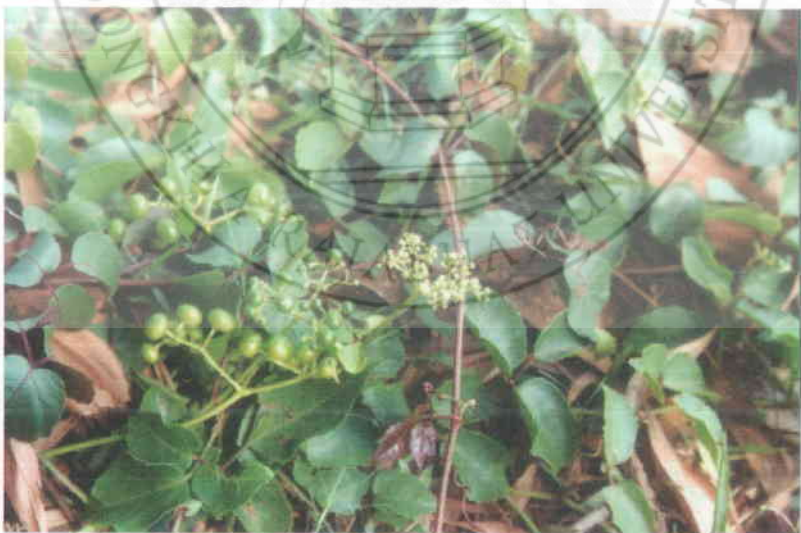
28. เถาวัลย์ Cayratia trifolia (L.) Domin.