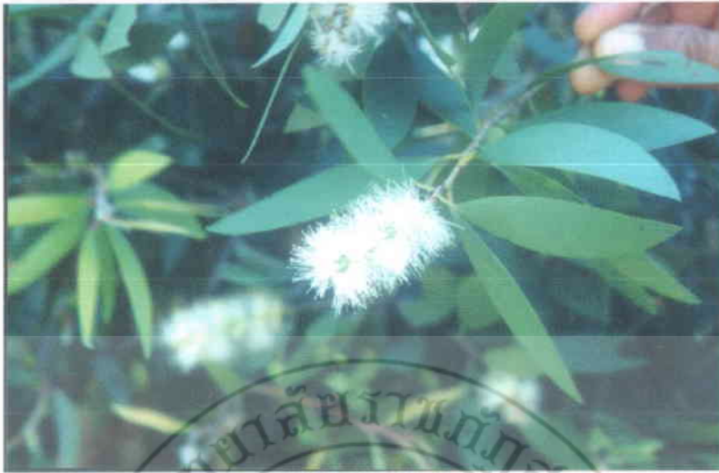
21. เสม์คขาว Melaleuca leucadendra Linn.