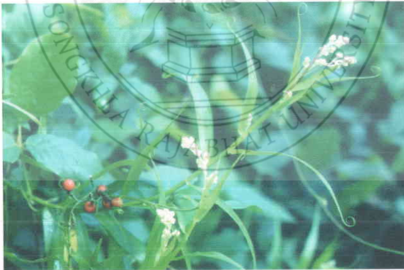
16. หวายลิง Flagellaria indiae Linn. (ช่อดอกและผล)