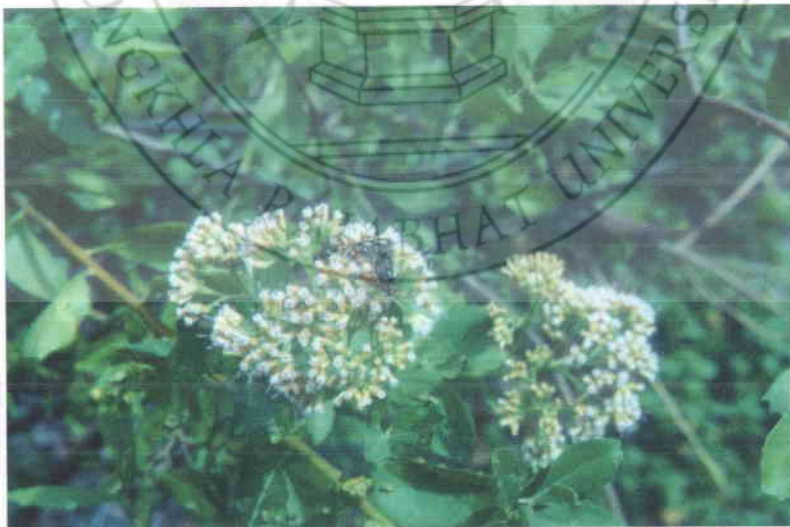
4. ขลุ่ Pluchea indica (Linn.) Less.