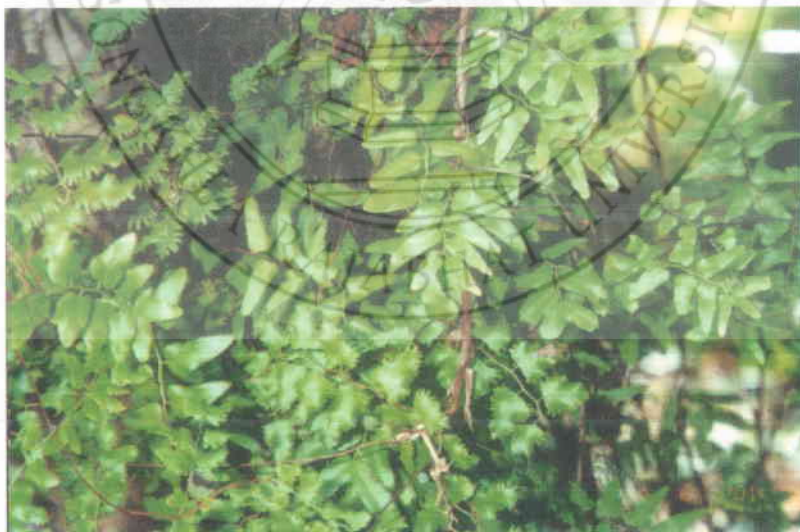
26. ลิเถายุ้ง Lygodium microphyllum (Cav.) R.Br.