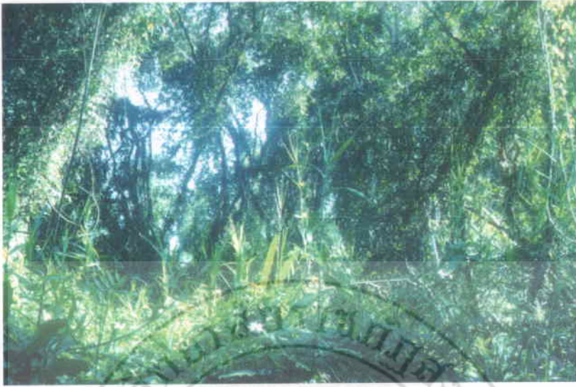
15. หวายลิง Flagellaria indica Linn. (ขึ้นปกคลุมเสม็ดขาวที่โคนล้ม)