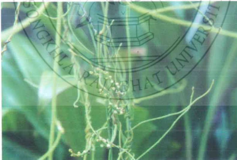
18. สังกวาลัยพระอินทร์ Cassytha filiformis Linn. (ช่อดอก)