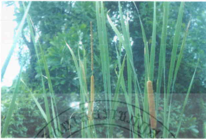
27. ธูปฤาษี Typha angustifolia Linn.