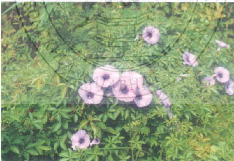
6. ผักนึ่งร้ว Ipomoea cairica L. Sweet.