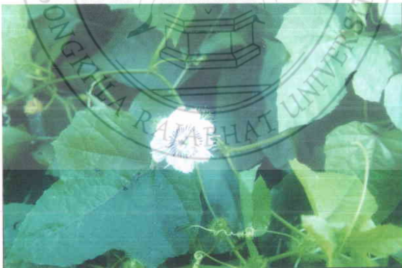
24. กระทกรก Passiflora foetida Linn.