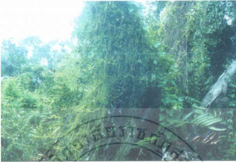
17. สังกวาลัยพระอินทร์ Cassytha filiformis Linn. (ขึ้นปกคลุมต้นเสม็ดขาว)