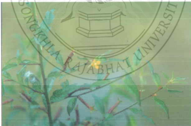
22. หญ้ารังกา Jussiaea suffruticosa Linn.