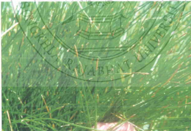
8. หัวทรงกระเทียม Eleocharis dulcis (Burm.f.) Hensch.