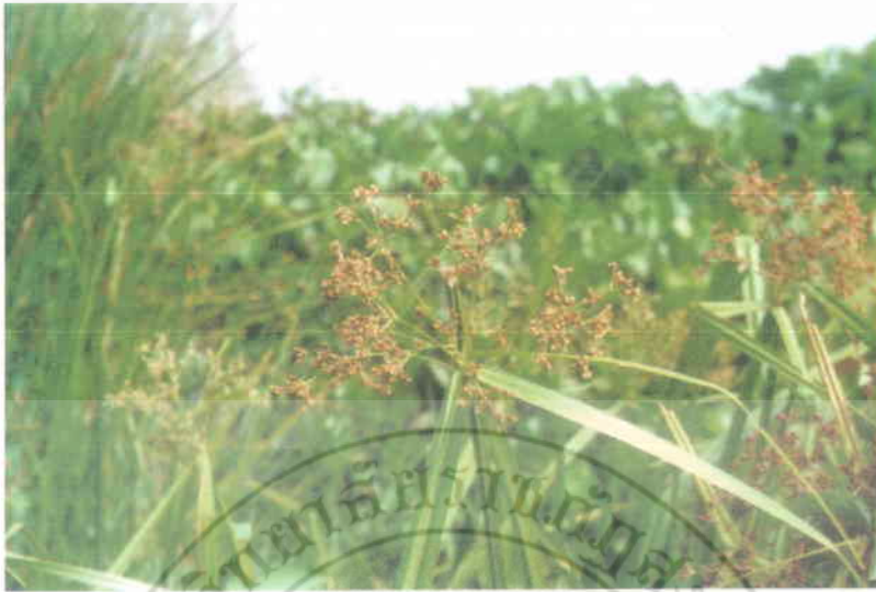
7. กกสามเหลี่ยม Actinoscripus grossus (L.f.) Goetgh. & A.D. Simpson.