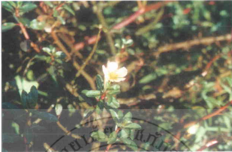
23. แพงพวยน้ำ Jussiaea repens Linn.