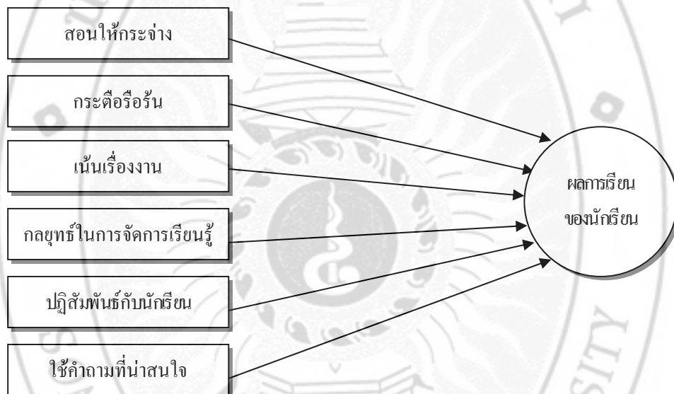
ภาพที่ 3 แสดงการจัดการเรียนรู้ที่มีประสิทธิภาพของ ชาญชัย อาจินสมาจาร

จากรูปแบบการจัดการเรียนรู้ที่มีประสิทธิภาพ สรุปได้ดังภาพที่ 3