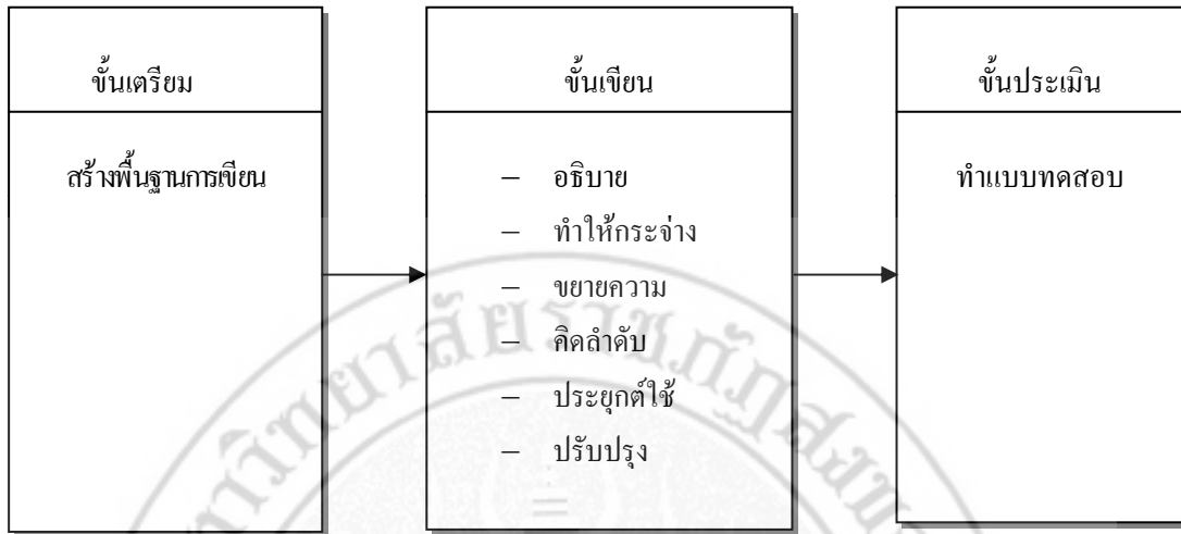
แผนภาพที่ 5 รูปแบบการจัดการเรียนรู้