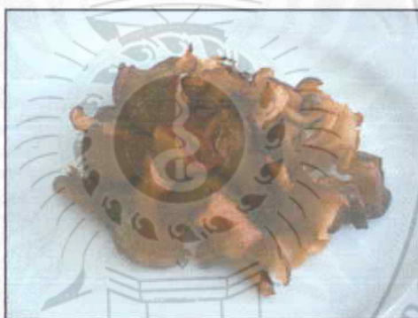
ภาพที่ 3 ส้มแขกแห้ง

ส้มแขก (Garcinia) (เบญจวรรณ สุริยะ และมณฑา พรหมกุล, 2545)