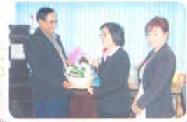
สถานีวิทยุโทรทัศน์แห่งประเทศไทย จ.สงขลา