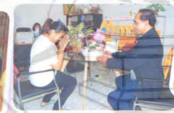
หนังสือพิมพ์ไทยธุรกิจ ภาคใต้