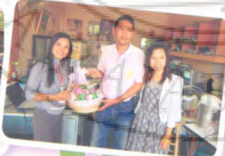
หนังสือพิมพ์ศรีมหาไถ่