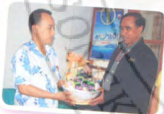
หนังสือพิมพ์ทางใต้