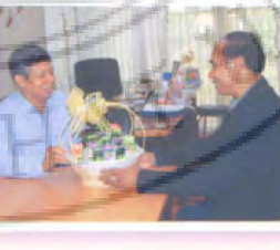
หาดใหญ่เคเบิล ๔๗