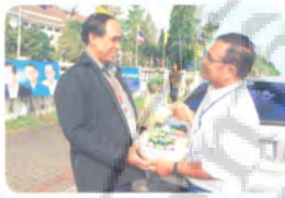
ผู้สื่อข่าวช่อง ๕