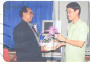
ศูนย์ข่าวทีวีไทย