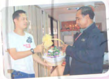
ศูนย์ข่าว ช่อง ๗