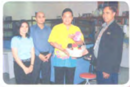
ประชาสัมพันธ์ จ.สงขลา