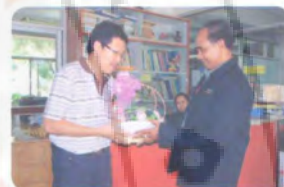
สถานีวิทยุ มอ.หาดใหญ่