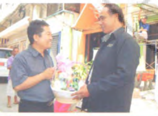
หนังสือพิมพ์พิมพ์ทางใต้