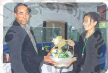
ศูนย์ข่าวช่อง ๕