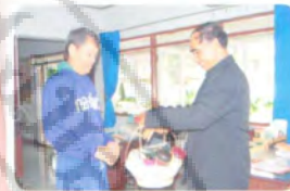
สถานีวิทยุ สทท.