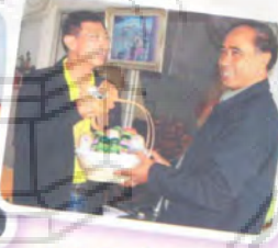
หนังสือพิมพ์ไทยแหลมทอง