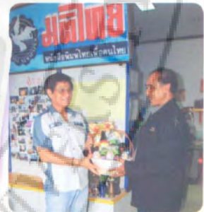
หนังสือพิมพ์พิมพ์ไทย