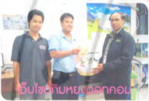
เว็บไซต์กรมยางกอน