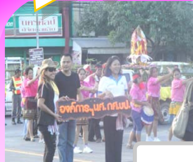
องค์การนักศึกษา