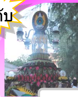
"เวตฉัตรคัม"