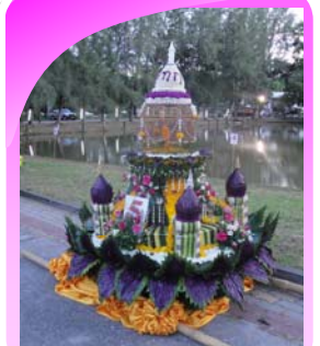
กระทงใหญ่ ประเภท