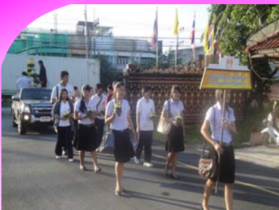
คณะวิทยาการ