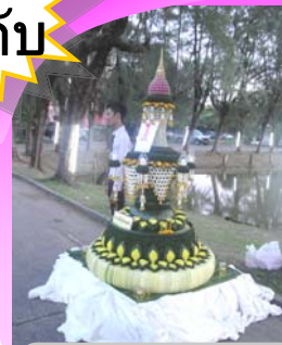
"ศิลปศาสตร์เทิดไท้"