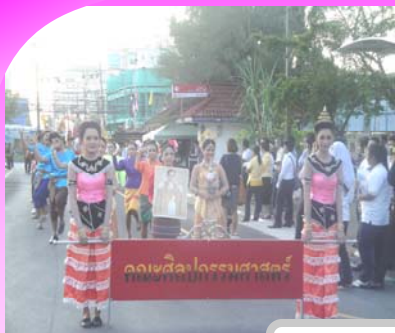
คณะศิลปกรรม