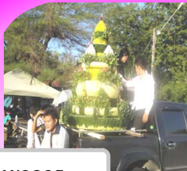
คณะมนุษยศาสตร์และ