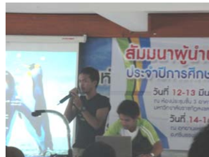
☞ โครงการสัมมนาผู้นำนักศึกษา เมื่อวันที่ 14 - 16 มีนาคม พ.ศ. 2555