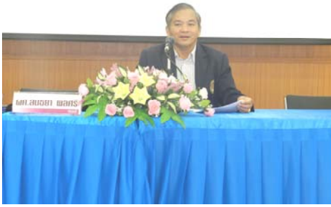
⇒ คณบดีกล่าวเปิดและให้โอวาท