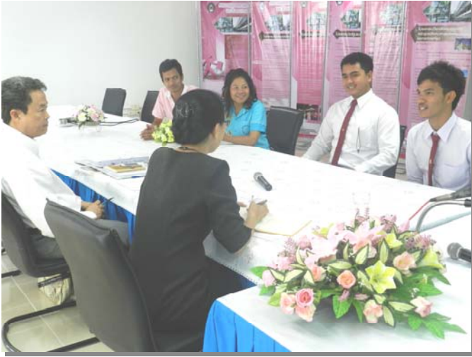
คณะกรรมการตรวจประเมินฯ สัมภาษณ์ศิษย์เก่า และนักศึกษา ปัจจุบัน