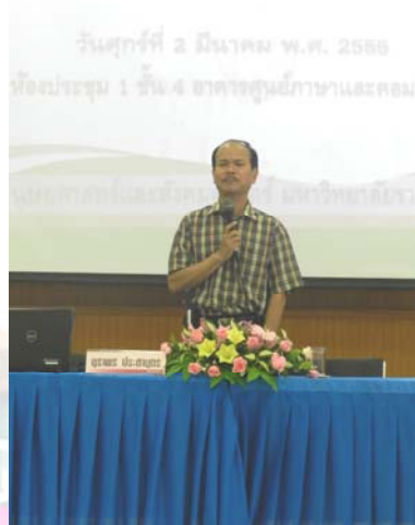
⇒ รองคณบดีกล่าวปิดและให้ โอวาท