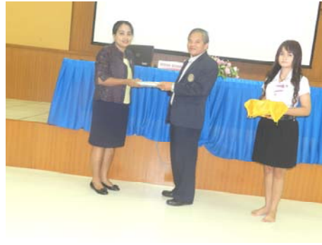
⇒ คณบดีมอบของที่ระลึกให้แก่ วิทยากร