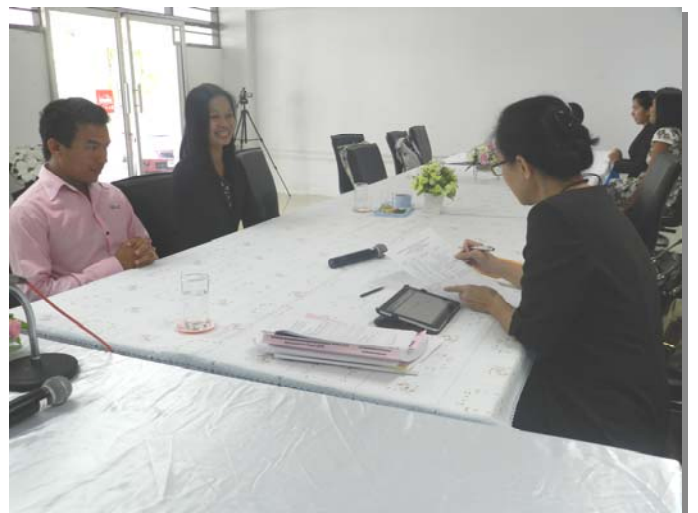
คณะกรรมการตรวจประเมินฯ สัมภาษณ์เจ้าหน้าที่