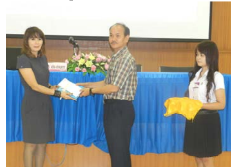
⇒ รองคณบดีมอบของที่ระลึก ให้แก่วิทยากร