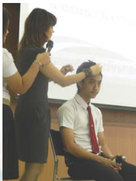
⇒ วิทยากรสอนเทคนิคการ แต่งหน้าและการแต่งทรงผม