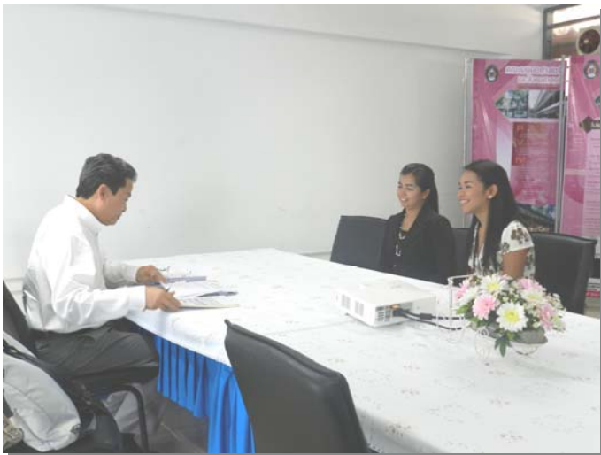
คณะกรรมการตรวจประเมินฯ สัมภาษณ์อาจารย์