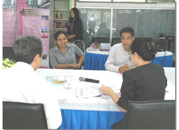
คณะกรรมการตรวจประเมินฯ สัมภาษณ์ผู้ใช้บัณฑิต