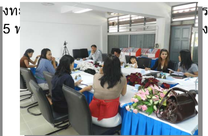
การประชุมงานวิจัยร่วมกับโปรแกรมวิชา