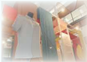
เสื้อกันยุง

TCDC ศูนย์สร้างสรรค์งานออกแบบ ร่วมกับสำนักวิทยบริการและเทคโนโลยีสารสนเทศ จัดแสดงนิทรรศการ แสดงผลงาน รูปแบบผ้าชนิดต่างๆ สิ่งประดิษฐ์ และการนำเศษวัสดุต่างๆ มาใช้ในการผลิตเสื้อผ้าที่สวมใส่ และเครื่องใช้ ลองมาสัมผัส โดดเดียด โอเดียดเด็ด ที่คุณจะต้องทึ่ง และคาดไม่ถึง เบิกทางความคิดให้กับคุณ พร้อมสร้างจินตนาการ ได้ที่บริเวณลานมูมกาแฟ ชั้น 1 อาคาร 2 ชั้น สำนักวิทยบริการและเทคโนโลยีสารสนเทศได้ตั้งแต่บัดนี้ - 22 ตุลาคม 2553