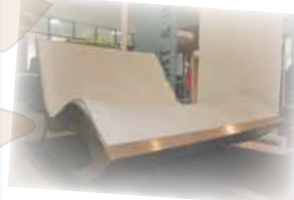
ผ้าทอสามมิติ