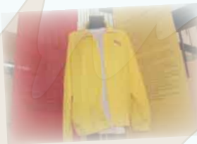
เสื้อไร้เห็บ