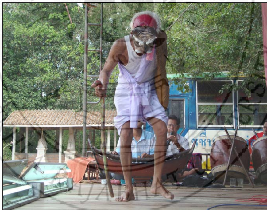
ภาพ 16 ชูชก