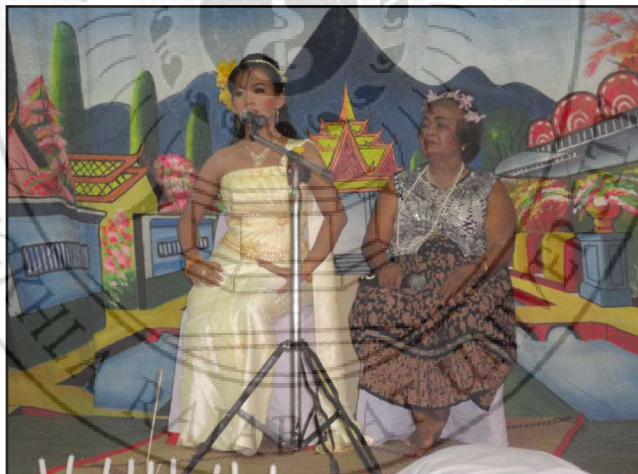
ภาพ 26 การแสดงลิเกแก่นัน เรื่อง “นางเหมย”