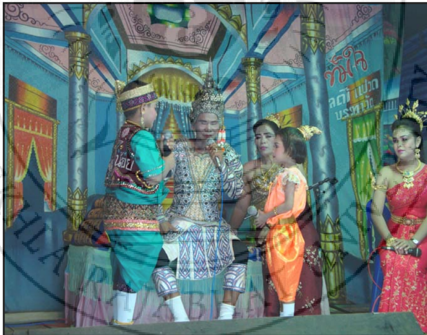
ภาพ 14 ตอน ชาลีและกัณหาออกภัยโทษให้กับพระเวสสันดรต่อที่ท่ากรุงสุโขทัย