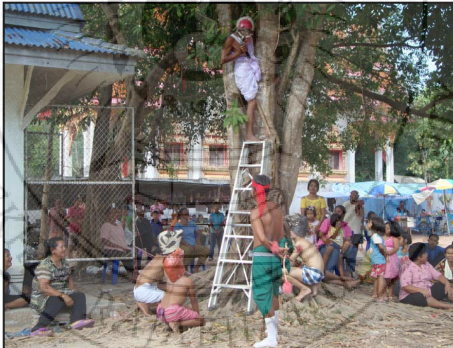
ภาพ 18 ตอน ชุกหนีสุนัขของนายพรานขึ้นต้นไม้ และหลอกนายพรานว่าเป็นทูตจากนครสีพี