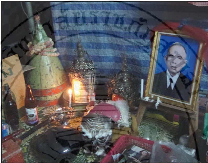
ภาพ 11 ที่ตั้งของแม่ครูหรือบรรพบุรุษของติเกมหาชาติทรงเครื่อง