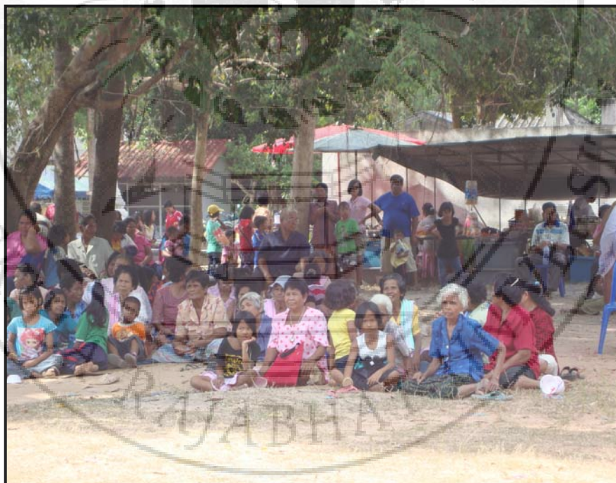
ภาพ 20 บรรยากาศผู้ชมนั่งการแสดงลิเกมหาชาติทรงเครื่อง