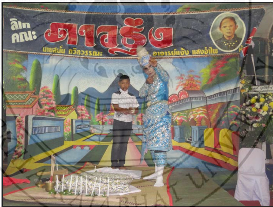
ภาพ 24 การปลุกเสกข้าวสาร