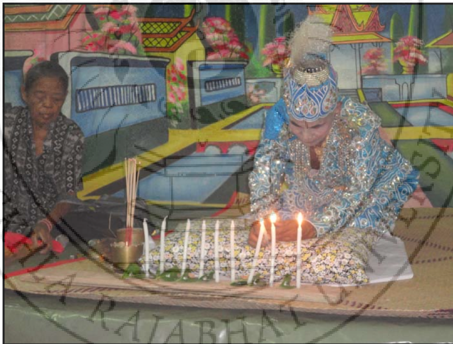
ภาพ 22 พิธีกรรมการแก้บน