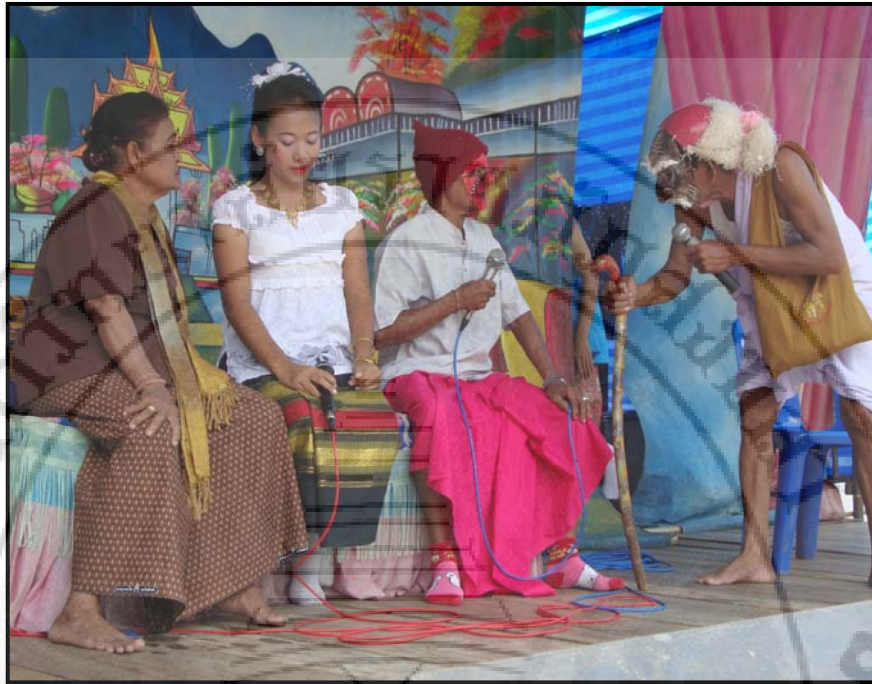
ภาพ 17 ตอน พร้าหมมณีและพร้าหมมณายนางอมิตตดาให้เป็นเมียชุก