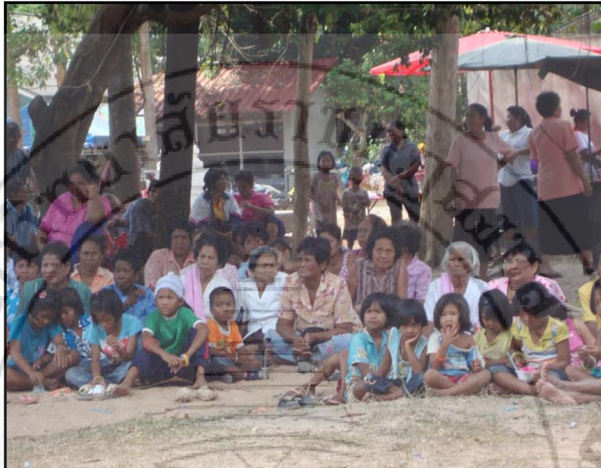
ภาพ 19 บรรยากาศผู้ชมนั่งการแสดงลิเกมหาชาติทรงเครื่อง