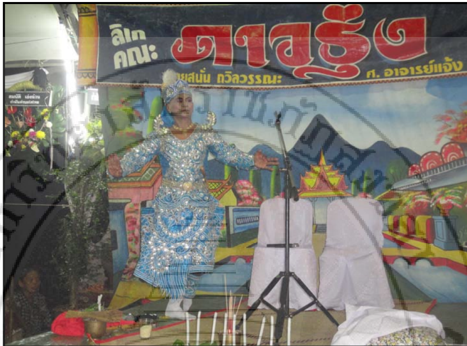
ภาพ 25 การแสดงลิเกแก่นัน เรื่อง “นางเหมย”