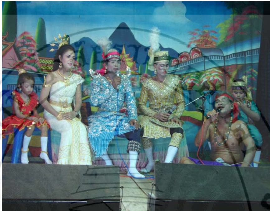
ภาพ 15 ตอน พระเวสสันดร พระนางมัทรี ชาลี กัณหา ออกจากเมืองไปเจอพระสหาย ของพระเวสสันดร