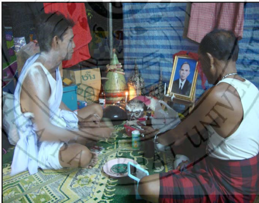
ภาพ 12 ผู้แสดงกำลังถวายเครื่องสักการะแม่ครู