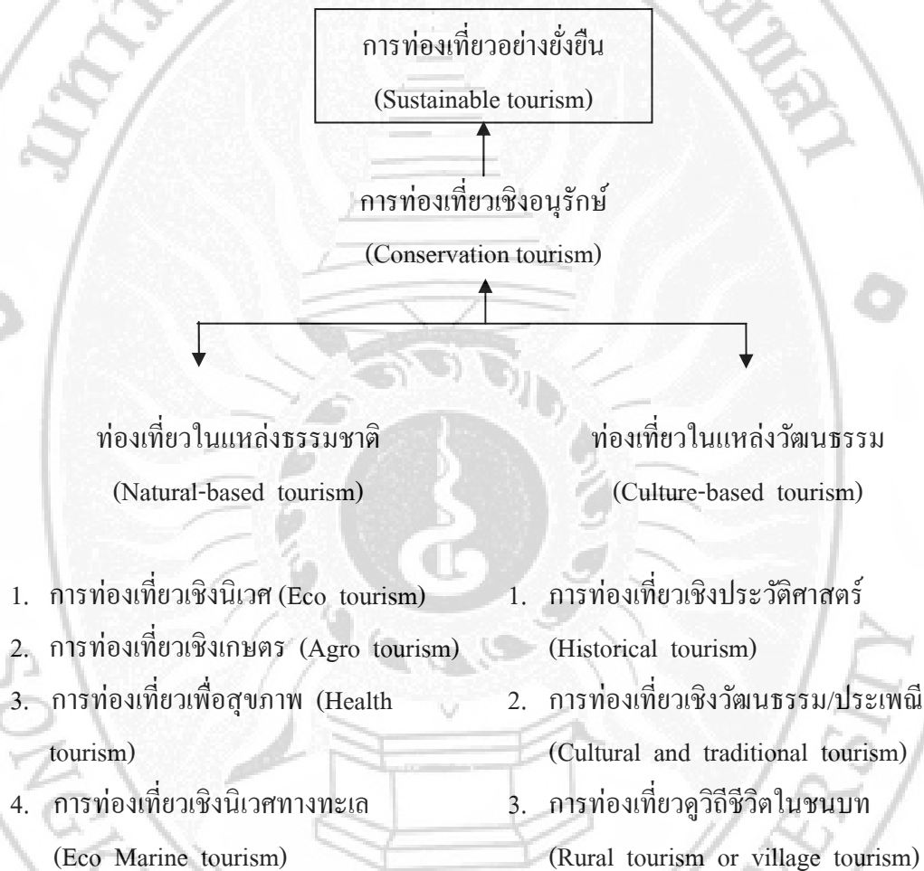
ภาพ 1 แผนภูมิแสดงตัวแบบการท่องเที่ยวที่มุ่งให้เกิดจิตสำนึกต่อการรักษาระบบนิเวศอย่างยั่งยืน

จากที่กล่าวมาข้างต้นพบว่า คำจำกัดความของการท่องเที่ยวเชิงนิเวศ คือ “การท่องเที่ยวที่ครอบคลุมถึงสาระด้านการศึกษา การเข้าใจธรรมชาติสิ่งแวดล้อม และมีการจัดการเพื่อรักษาระบบนิเวศให้ยั่งยืน” โดยธรรมชาติสิ่งแวดล้อมในที่นี้ยังหมายความครอบคลุมถึงขนบธรรมเนียมประเพณีท้องถิ่น ส่วนคำว่า การรักษาระบบนิเวศให้ยั่งยืนนั้นหมายถึง การบั่นผลประโยชน์ต่าง ๆ กลับสู่ชุมชนท้องถิ่นและการอนุรักษ์ทรัพยากรธรรมชาติ