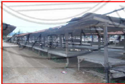
ภาพที่ 4.1 แผงขายสินค้าที่มีหลังคา

ตลาดนัดเกาะหมี่ เริ่มขยายตลาดในช่วง พ.ศ. 2520 – 2536 ด้วยการตัดดินขางพาราในพื้นที่จำนวน 5 ไร่ มีการปรับแต่งพื้นที่ให้มีความสะดวกแก่กลุ่มพ่อค้าแม่ค้า และกลุ่มของผู้ซื้อ มีการแบ่งโซนขายสินค้าที่ชัดเจนขึ้น มีทั้งโซนขายสินค้าที่มีหลังคาและโซนที่เป็นแผงดิน โดยโซนที่มีหลังคานั้นจะมุงด้วยสังกะสีเพื่อความทนทาน ซึ่งมีความยาวต่อแผง คือ กว้าง 2 เมตร ยาว 2 เมตร โดยเริ่มก่อสร้างบริเวณริมทางเข้าบ้านเกาะหมี่ ในส่วนของแผงดิน ขนาดความกว้าง ความยาวก็จะมีขนาดเท่ากันแผงที่มีหลังคา ดังภาพต่อไปนี้