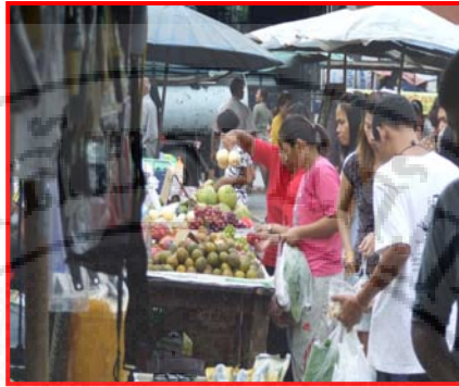
ภาพที่ 4.4 แผงขายสินค้าประเภทผลไม้ในตลาดเกาะหมี่