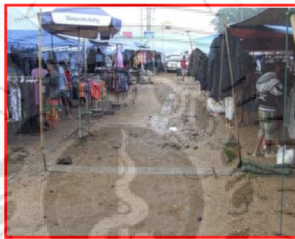
ภาพที่ 4.5 แผงขายสินค้าประเภทเสื้อผ้าในตลาดเกาะหมี่