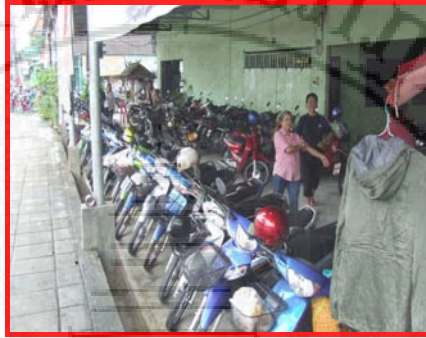
ภาพที่ 4.6 แสดงสถานที่จอดรถในตลาดนัดเกาะหมี่

รถไว้เฉพาะพ่อค้าแม่ค้าเหล่านี้จะไปหาที่จอดรถตามสถานที่ต่าง ๆ ที่อยู่บริเวณตลาดนัดเกาะหมี่ซึ่งส่วนใหญ่พ่อค้าแม่ค้าในตลาดนัดเกาะหมี่ จะมีรถยนต์ที่ใช้รถบรรทุกสินค้ามาจำหน่ายยังตลาดนัดดังกล่าวประกอบต่อไป