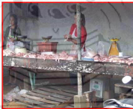
ภาพที่ 4.8 แผงขายสินค้าประเภทเนื้อหมู

สินค้าประเภทผัก ได้แก่ ถั่วฝักยาว หอมหัวใหญ่ มะเขือ พริกดอกแดง – ดอกเขียวพริกขี้หนู ถั่วถั่วงอก หัวข่า ขิงขอย ต้นหอม ผักชี กระเทียม แดงกวา พริกเขียว พริกทอง สะตอ ผักบุ้ง แครอท หัวป้าว หน่อไม้ ใบชะมวง ชะอม บวบ กะหล่ำปลี และผักชนิดอื่น ๆ สินค้าประเภทต้นไม้ ได้แก่ ต้นสะตอ ทุเรียน กระท้อน มะนาว มะกรูด มังคุด เงาะ ขนุน ลำไย และสินค้าประเภทไม้ดอก เช่น จำปี จำปา กระดังงาสงขลา แก้ว มณฑา ยี่หุบและเฟิร์นก้านดำ สินค้าประเภทเครื่องมือทางการเกษตร ได้แก่ มีดกรีดยาง มีดพรวน เสียม ขวาน หินลับมีด คราด จอบ คีมปอกมะพร้าว ขอบเกี่ยวผลไม้ เลื่อย กิ่งไม้ ตะไบลับจอบ กรรไกรตัดต้นไม้ กระจาด มีด ปอกอ้อย และของใช้ในครัวเรือน ได้แก่ มีดทำครัว กะละมัง จาน ช้อนและชนิดอื่น ๆ สินค้าประเภทเสื้อผ้ามีทั้งเสื้อผ้ามือใหม่ เช่น เสื้อ กางเกงเด็ก กางเกงผู้ใหญ่ ชุดนอน เสื้อเชิ้ต และเสื้อผ้ามือสองได้แก่ กางเกงยีนส์ เสื้อเชิ้ต เสื้อแจ็กเก็ต เสื้อยืด ฯลฯ สินค้าประเภทขนมมีทั้งขนมพื้นบ้านและขนมโรง เช่น ขนมกล้วย ขนมครก ขนมพิมพ์ ขนมดอกโดน ขนมมัน ขนมซ็อกโกแลต ขนมปังไส้สับปะรด ขนมขบเคี้ยวและขนมชนิดอื่น ๆ สินค้าประเภทเนื้อ ได้แก่ เนื้อหมู เนื้อวัว เนื้อไก่ และสินค้าประเภทปลา มีทั้งปลาน้ำจืด เช่น ปลาหมอ ปลาแค ปลาตุ๊ก ปลาช่อน ในส่วนของปลาน้ำเค็มมีหลาย ๆ ชนิด เช่น ปลาทู ปลาเก๋า ปลากระพงทะเล ปลาสำลิ ปลาโอ (สัมภานันท์ พ่อค้า แม่ค้า ทุกกลุ่มในตลาดนัด)