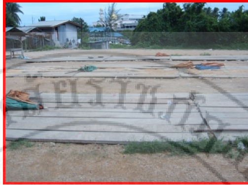
ภาพที่ 4.2 แสงดินที่ได้ก่อสร้างเป็นจุดแรก

จากการที่เริ่มมีการขยายตลาดนัดเกาะหมีนั้น เพราะจำนวนผู้ซื้อภายในตลาดเพิ่มขึ้นอย่างรวดเร็ว อันเนื่องมาจากการปรับปรุงเส้นทางการคมนาคมในหมู่บ้านเป็นถนนลาดยางและเริ่มมีการขยายถนนในหมู่บ้าน จึงทำให้การสัญจรไปมาของคนในชุมชน และพื้นที่ใกล้เคียงมีการเดินทางที่สะดวกขึ้น และราคาของสินค้าก็มีลักษณะที่ไม่แพง จนเกินไปเมื่อเปรียบเทียบกับตลาดที่อยู่ใกล้เคียง และปริมาณของสินค้า เริ่มมีความหลากหลาย เป็นที่ต้องการของกลุ่มผู้ซื้อสินค้าในตลาด