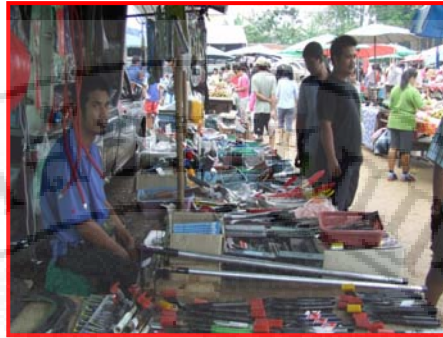
ภาพที่ 4.9 แผงขายสินค้าประเภทเบ็ดเตล็ดทั่วไป

จากที่กล่าวมาทั้งหมดสรุปได้ว่า สินค้าที่จำหน่ายในตลาดนัดเกาะหมี สามารถจำแนกประเภทได้ดังนี้คือสินค้าประเภทผัก สินค้าประเภทต้นไม้ สินค้าประเภทเครื่องมือทางการเกษตร สินค้าประเภทเสื้อผ้า สินค้าประเภทขนมพื้นบ้านและขนมโรง สินค้าประเภทเนื้อ และสินค้าประเภทปลา