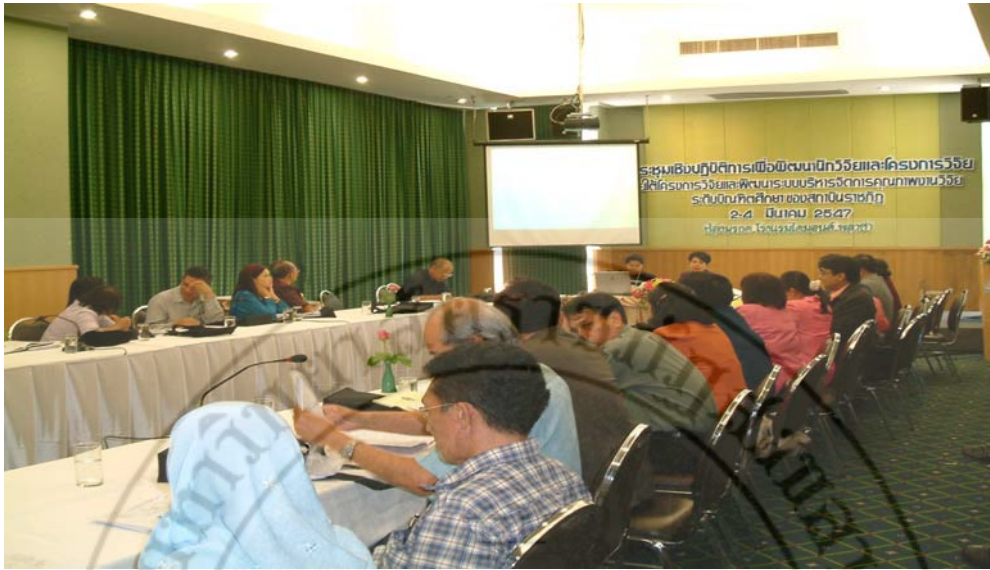
มหาวิทยาลัยราชภัฏนครศรีธรรมราชนำเสนอชุดโครงการวิจัยเพื่อแลกเปลี่ยนร่วมกันระหว่าง มหาวิทยาลัย ระหว่างวันที่ 2-4 มีนาคม พ.ศ.2547 ณ ห้องมรกต โรงแรมไดมอนด์พลาซ่า จังหวัดสุราษฎร์ธานี