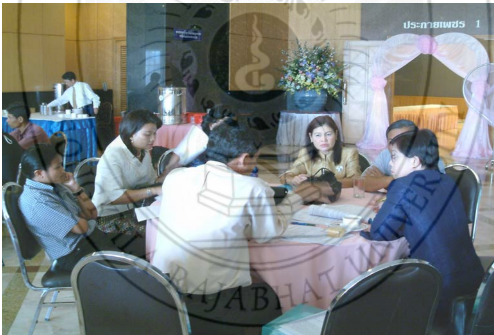
ประชุมกลุ่มย่อยเพื่อวางแผนการพัฒนาชุดวิจัยของมหาวิทยาลัยราชภัฏสงขลา ระหว่างวันที่ 2-4 มีนาคม พ.ศ.2547 ณ ห้องมรกต โรงแรมไดมอนด์พลาซ่าจังหวัดสุราษฎร์ธานี