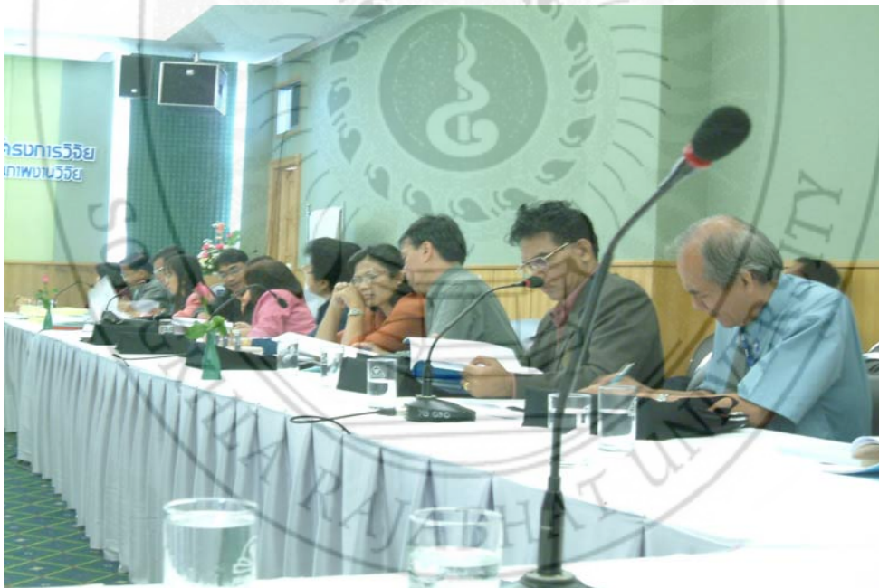
คณะอาจารย์มหาวิทยาลัยราชภัฏ 5 แห่งภาคใต้ และผู้ทรงคุณวุฒิร่วมฟังและให้ข้อเสนอแนะในการพัฒนาหัวข้อวิจัย ระหว่างวันที่ 2-4 มีนาคม พ.ศ.2547 ณ ห้องมรกต โรงแรมโดมอนด์พลาซ่าจังหวัดสุราษฎร์ธานี