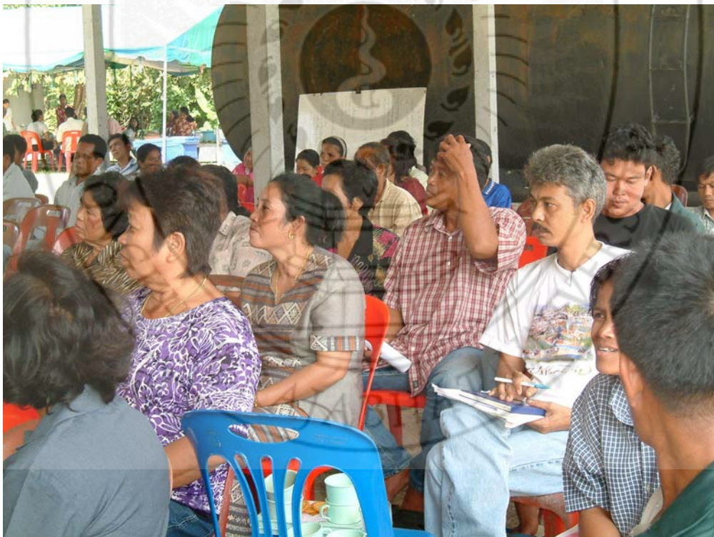
แลกเปลี่ยนทิศทางการพื้นที่ชุมชนบ้านวังลุงร่วมเครือข่ายเทือกเขาหลวง