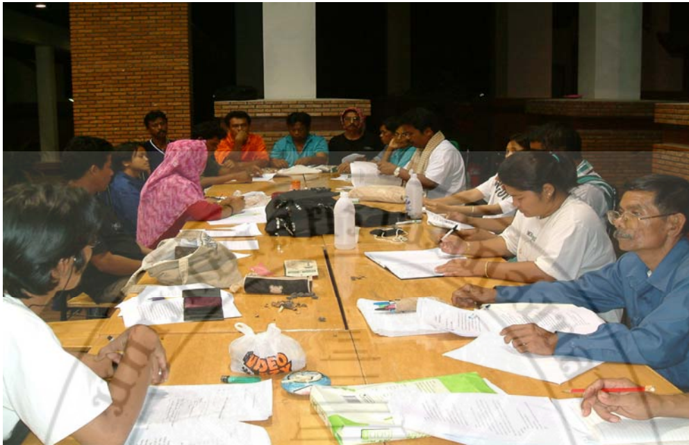
ตรวจสอบความถูกต้องของข้อมูลโดยชุมชนบ้านวังลุงและพื้นที่เครือข่ายใกล้เคียง