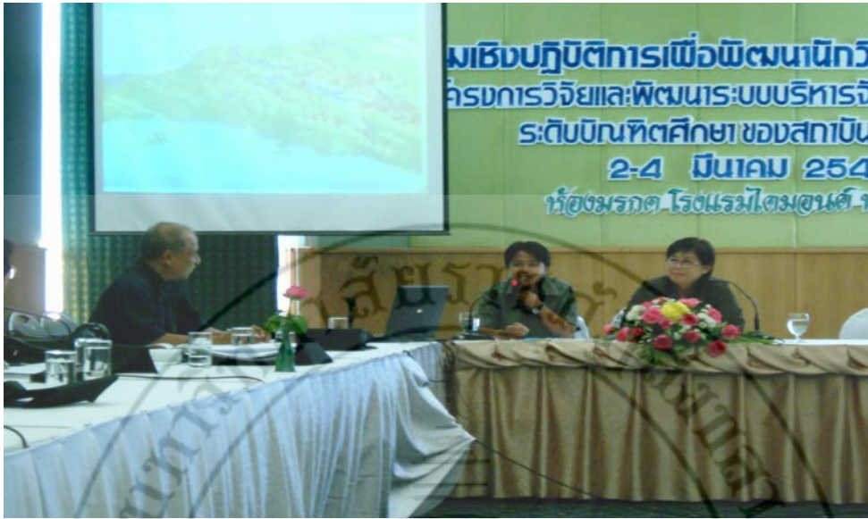
นำเสนอและพัฒนาหัวข้อวิจัยเวทีสัมมนาเชิงปฏิบัติการ จัดโดยสำนักงานคณะกรรมการอุดมศึกษา ระหว่างวันที่ 2-4 มีนาคม พ.ศ.2547 ณ ห้องมรกต โรงแรมโดมอนด์พลาซ่า จังหวัดสุราษฎร์ธานี