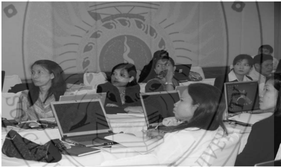
ภาพ.. การพัฒนาบุคลากรของกลุ่มปกติ