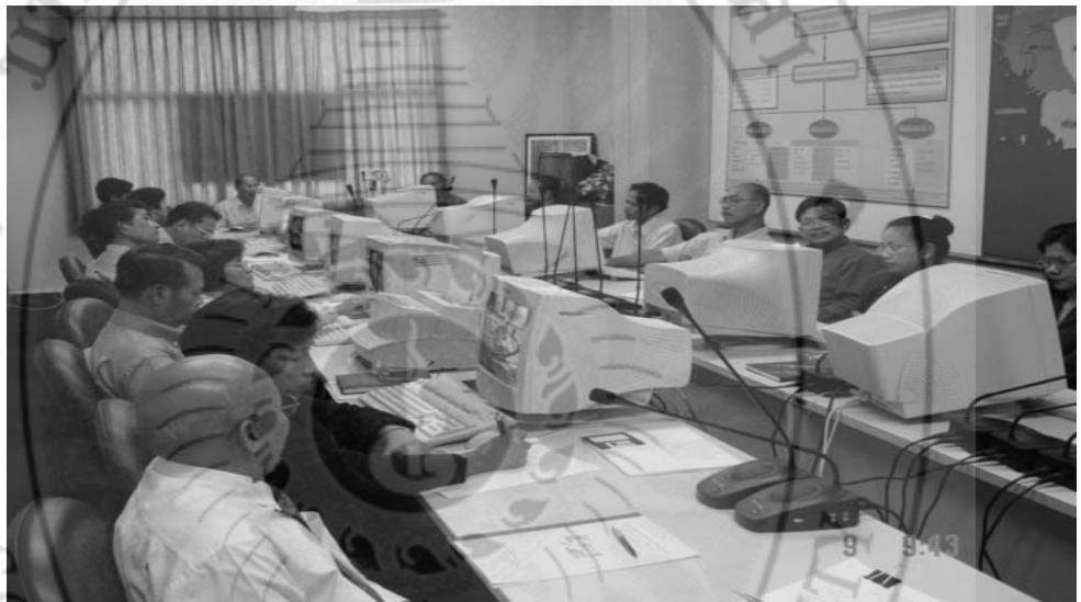
ภาพ... การพัฒนานุเคราะห์ของกลุ่มเพื่อนช่วยเพื่อน โดย 2 วิทยากรแกนนำ