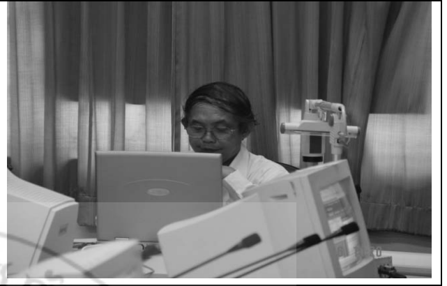
วิทยากรแกนนำกลุ่มเพื่อนช่วยเพื่อน