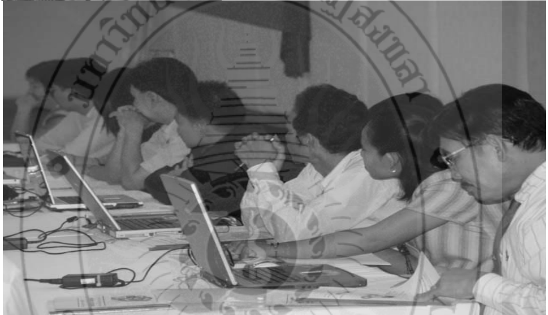
ภาพ... การพัฒนาบุคลากรของกลุ่มปกติ โดยมีวิทยากรจากมหาวิทยาลัยเทคโนโลยีราชมงคลศรีวิชัย วิทยาเขตภาคใต้