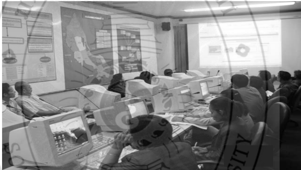
ภาพ... การพัฒนาบุคลากรของกลุ่มเพื่อนช่วยเพื่อน