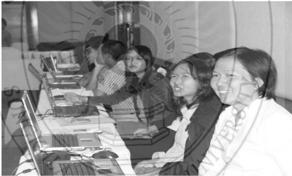
การพัฒนาบุคลากรของกลุ่มปกติ