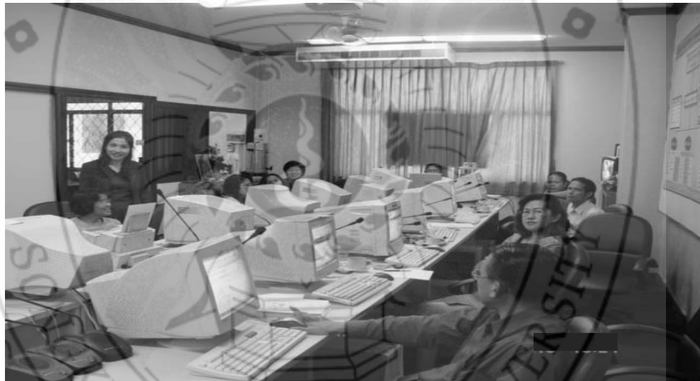
ภาพ... การพัฒนาบุคลากรของกลุ่มเพื่อนช่วยเพื่อน